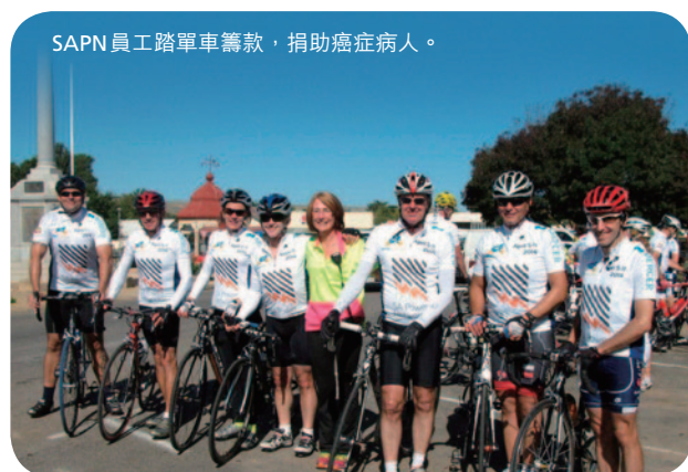
SAPN 員工踏單車籌款，捐助癌症病人。

集團相信，對業務所在社區來說，集團的角色及責任已超越能源供應商的範圍。我們致力成為負責任的優秀企業公民，並相信有責任幫助社會上的弱勢社群。除捐款支持社會及公益活動外，我們亦特別重視員工的義工服務。以下是集團聯營公司及合營公司在二零一四年舉辦的部分社區活動。