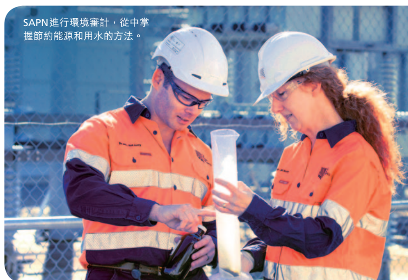
SAPN 進行環境審計，從中掌握節約能源和用水的方法。

珠海、金灣及四平發電廠對減排設備進行大規模檢修，以減少碳足印並遵守政府更嚴格的指引。金灣電廠取得廣東省環境保護局的「綠色」評級。