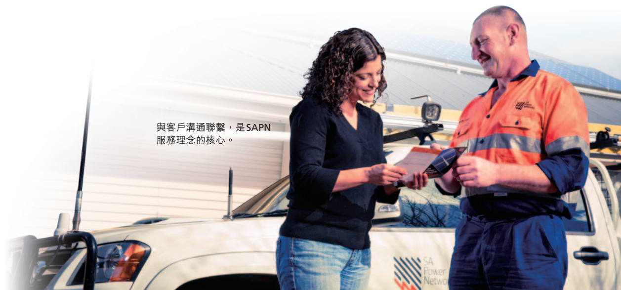
與客戶溝通聯繫，是SAPN服務理念的核心。

集團高度重視對僱員、客戶、承辦商及公眾的關顧責任，並在每個營運層面持守安全第一、肩負社會責任的態度。為達到這個目標，電能實業恪守地方法規及國際最佳範例，鼓勵業務夥伴、聯營及合營公司堅守同等嚴格的標準，以下是一些相關例子。