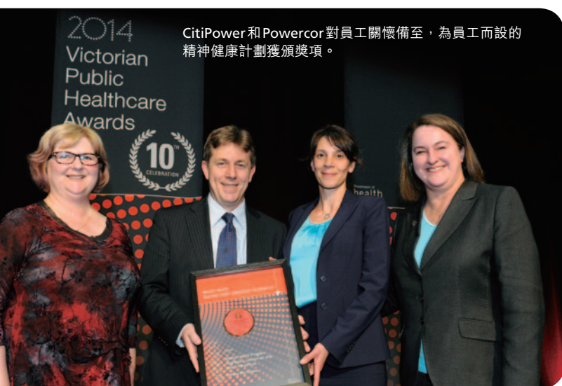
CitiPower和Powercor對員工關懷備至，為員工而設的精神健康計劃獲頒獎項。

SAPN繼續保持AS/NZS 4801及OHSAS 18001安全認證，並躋身澳洲國家安全議會國家安全大獎入圍名單。CitiPower及Powercor Australia推出一套名為「Never Compromise Safety」的安全規則並輔以一個應用程式，以改善風險報告表現及爭取於二零一五年底前達至零意外目標。