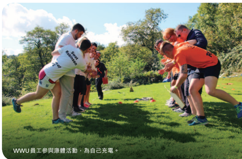
WWU 員工參與康體活動，為自己充電。

二零一四年，由英國就業與技能委員會管理的英國政府機構「Investors in People」，頒發金獎予UK Power Networks (UKPN)，以嘉許其僱員參與、僱員支援和多元共融計劃。這項殊榮對UKPN領導及培育員工，不斷