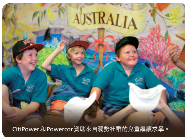
CitiPower 和 Powercor 資助來自弱勢社群的兒童繼續求學。

作為南澳洲唯一的配電商，SAPN 舉辦多元化的贊助及社區支援計劃，惠及多個當地組織，包括藝術團體、教育機構及殘疾人士服務組織。二零一四年九月，SAPN 僱員基金會在短短八年間捐出一百萬元善款，締造一項重大里程碑。