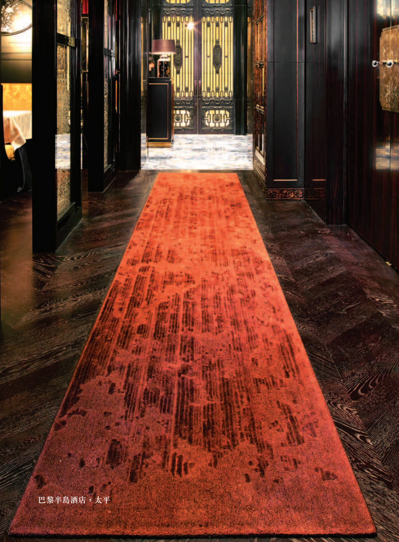
巴黎半島酒店，太平