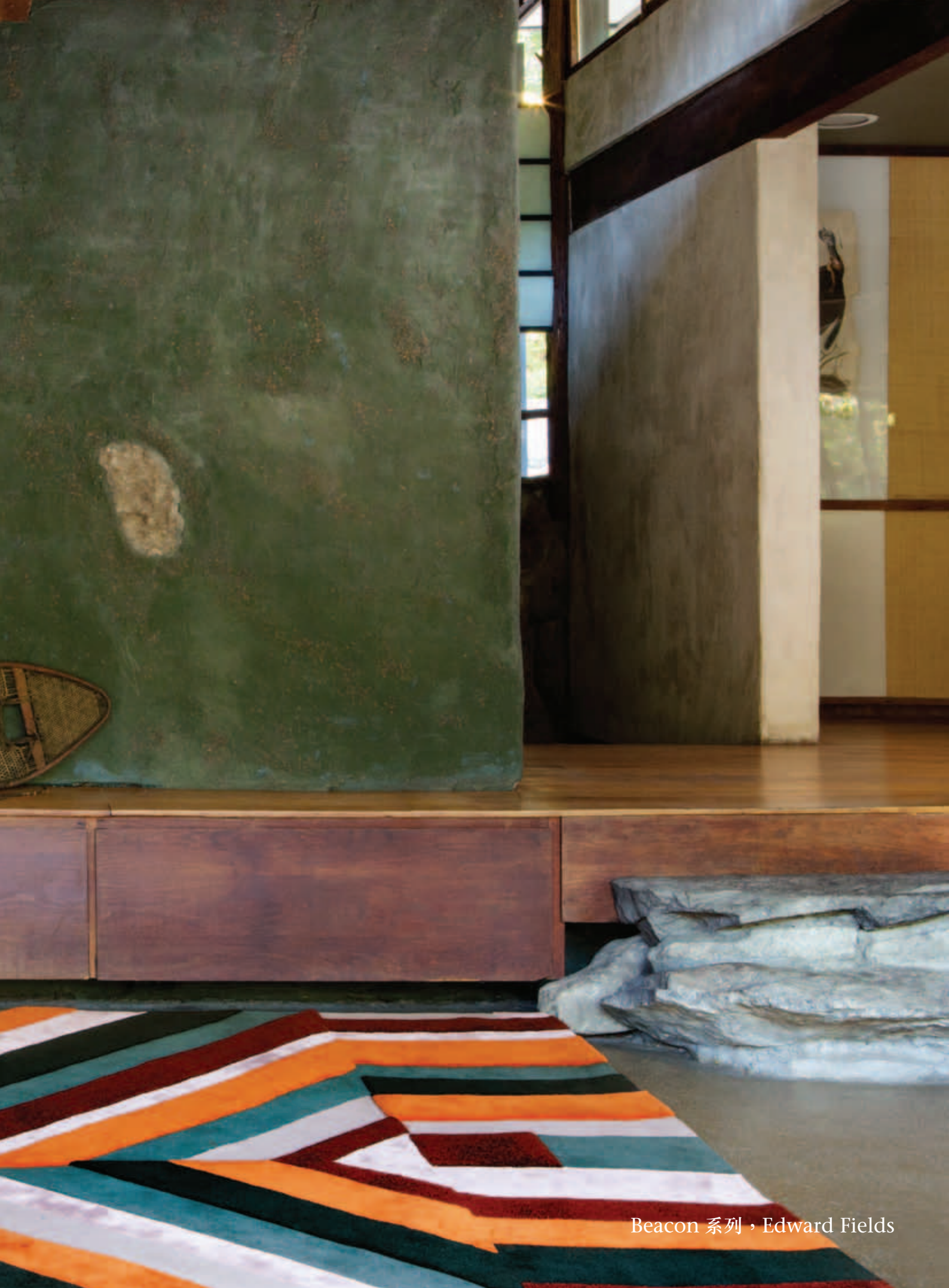
Beacon 系列，Edward Fields