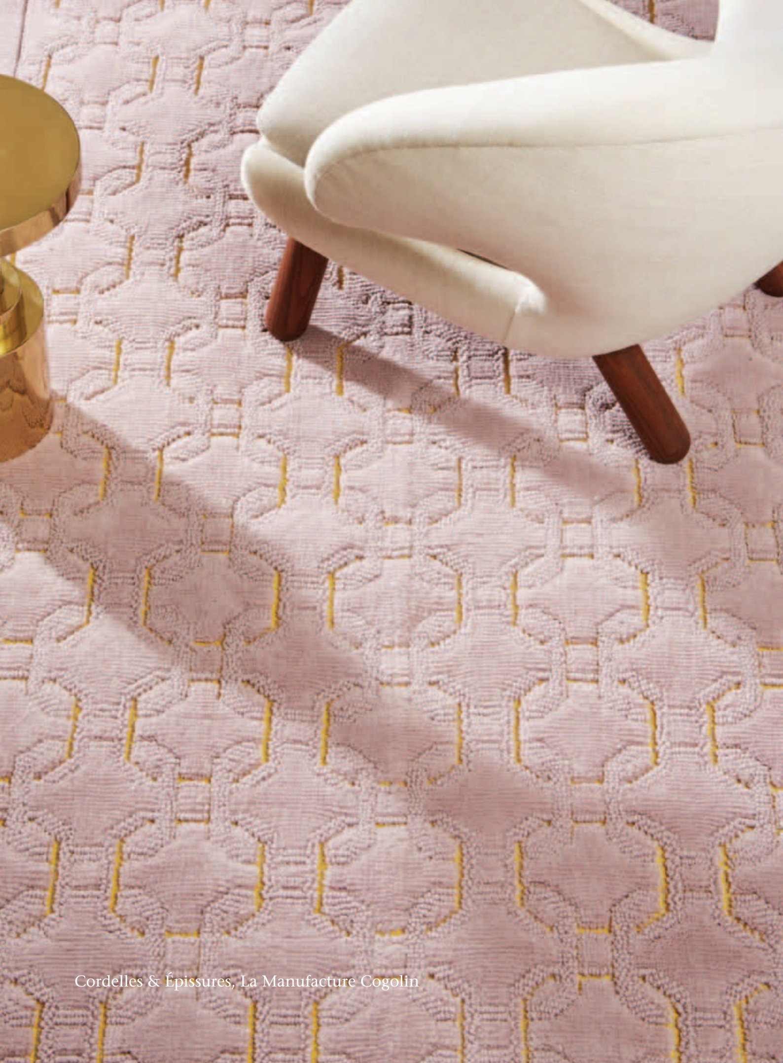
Cordelles & Épissures, La Manufacture Cogolin