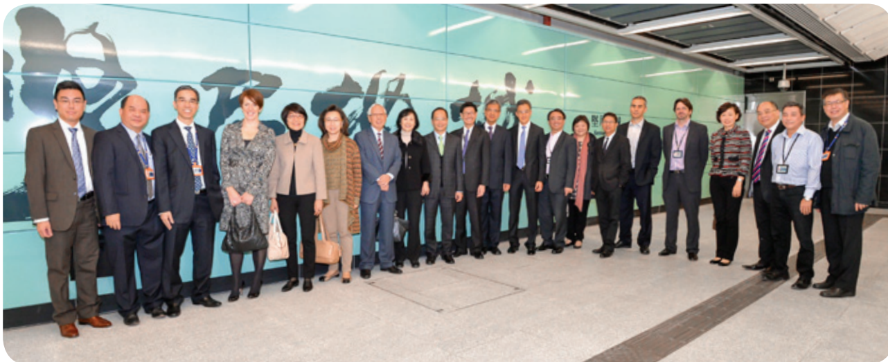
董事局成員實地視察港島綫延綫

於2014年12月，董事局成員獲安排實地視察港島綫延綫至西區站，從而讓董事局成員可第一時間瞭解為準備港島綫延綫於2014年12月底通車至西區的工作及車站運作。