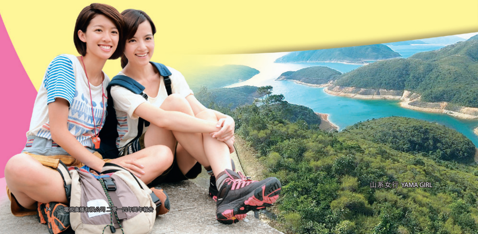
山系女行 YAMA GIRL

此外，J2台的音樂節目陣容亦包括亞洲一些備受矚目的音樂盛事和頒獎典禮，包括「2014香港亞洲流行音樂節2014」、「新城國語力頒獎禮2014」和「2014 Mnet Asian Music Awards」。