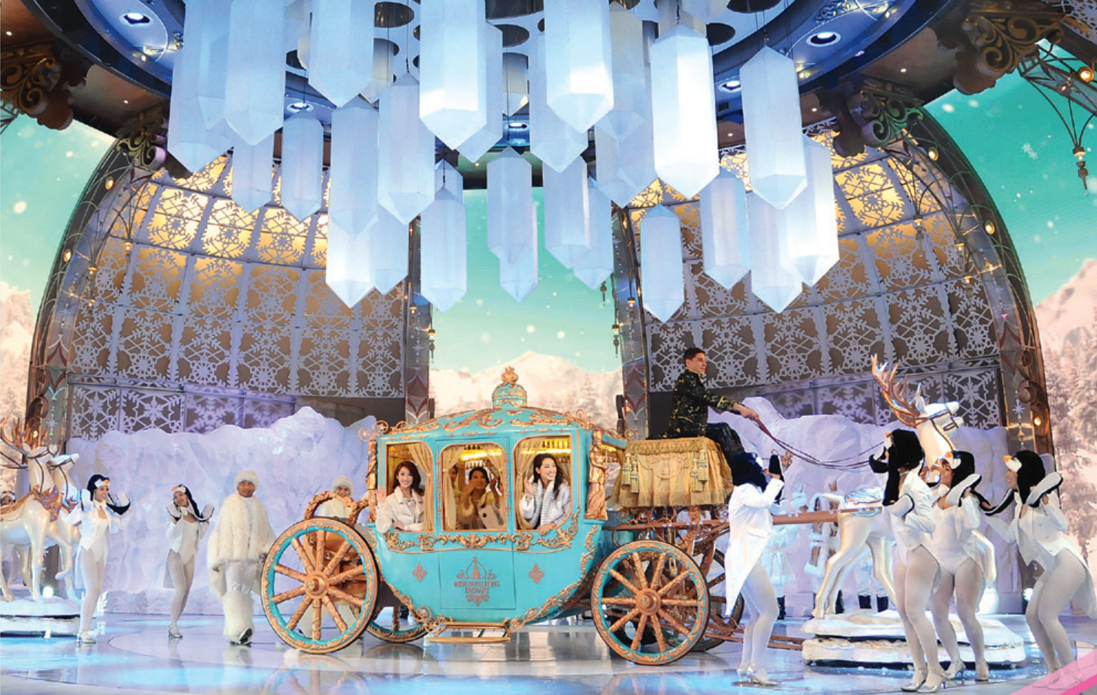
2014 香港小姐競選 決賽