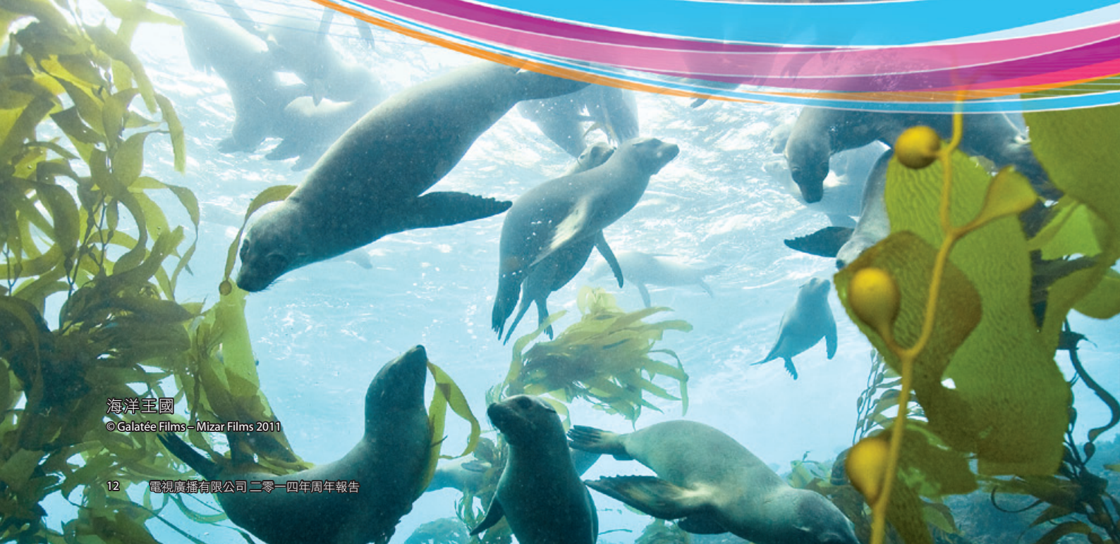
海洋王國