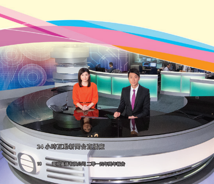
24小時互動新聞台直播廠