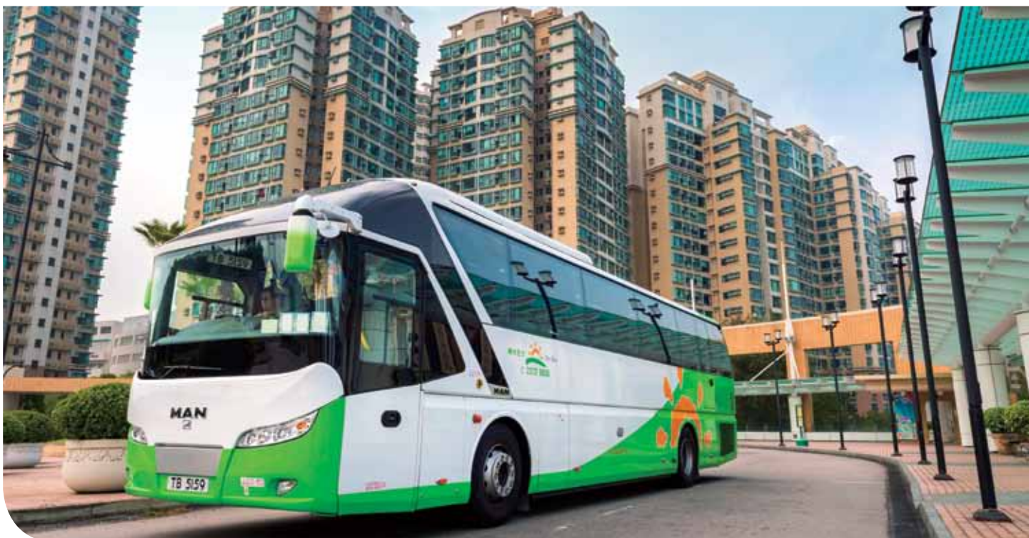
陽光巴士的現代化服務，能配合今天顧客的嚴格要求