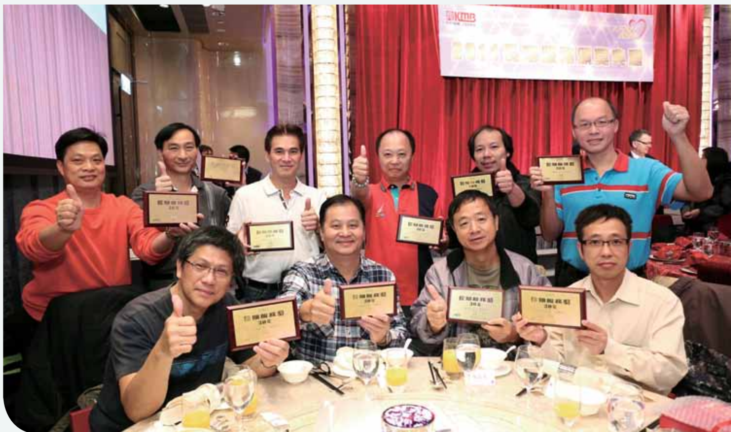
九巴以長期服務獎計劃，嘉許忠心耿耿的員工

為培養員工的團隊精神，我們於2014年舉辦多項車廠比賽，比賽橫跨數個類別，包括羽毛球、足球、籃球、長跑及攝影等。