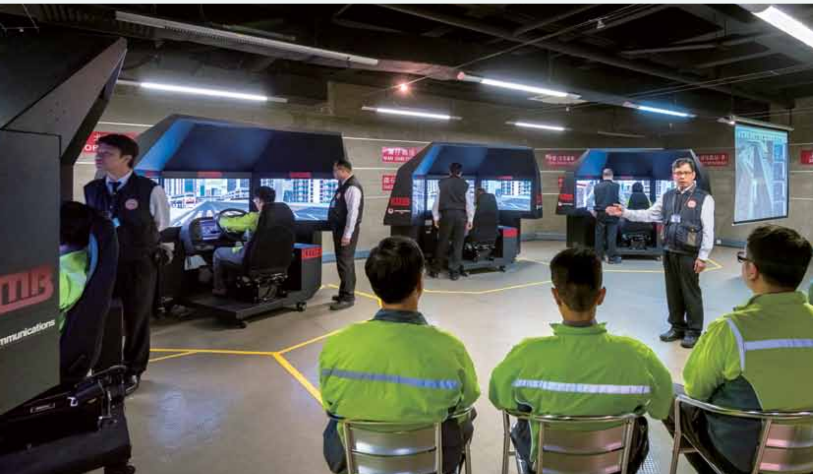
九巴為專業車長提供全面培訓

車長訓練學校內最先進的巴士模擬駕駛室，透過模擬現實世界的環境，協助車長改善駕駛技巧，訓練他們面對不同交通情況時作出適時反應。模擬駕駛室不會佔用路面或消耗燃料，符合環保。訓練學校的四台模擬器均設有巴士駕駛艙，內置司機座椅、駕駛