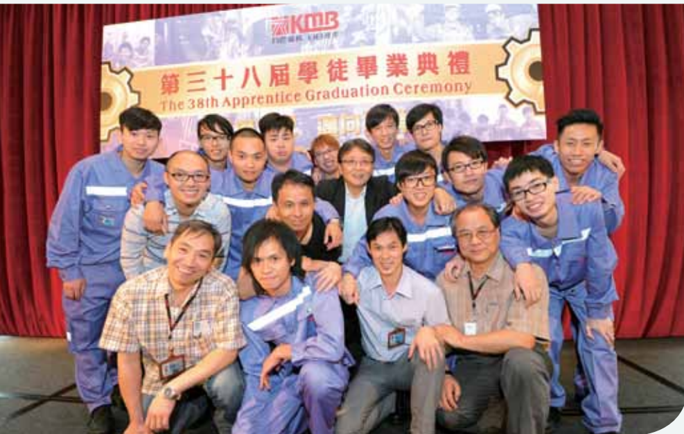
九巴透過學徒培訓計劃，確保合資格的維修員工供應無缺