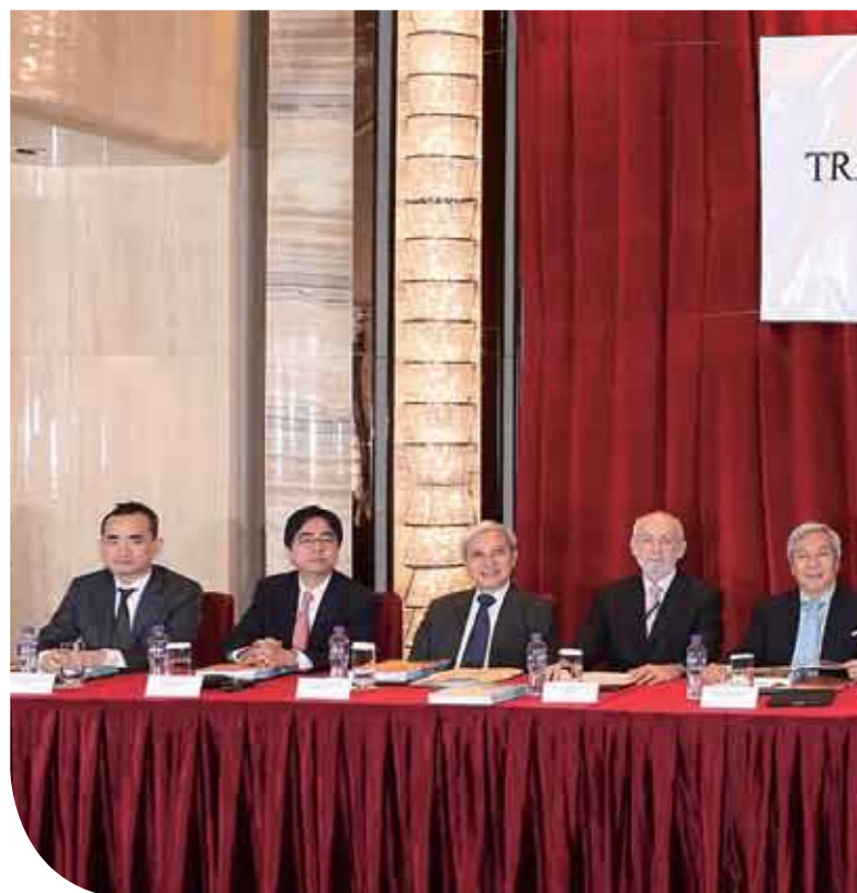
良好管治，是載通國際的營運特色