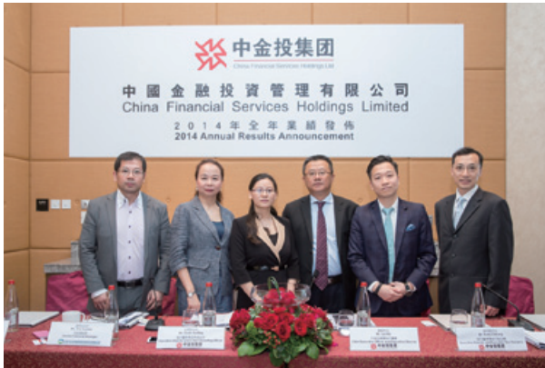
二零一四年全年業績