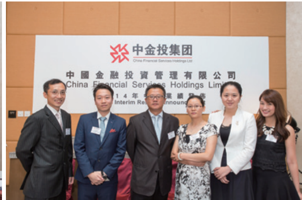
二零一四年中期業績