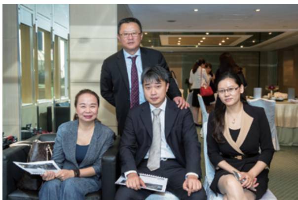
本公司及中合擔保之管理層團隊

二零一四年為本集團至關重要且充滿變數的一年。年內，本集團加大力度探索不同資金來源。本集團的創新及多元化集資工具顯示本集團的努力已得到回報。於二零一四年四月二十三日，本公司完成先舊後新配售事項及發行合共300,000,000股普通股。先舊後新配售事項所得款項為165,000,000港元，及配售有關開支為2,086,000港元，引致現金所得款項淨增加162,914,000港元。於二零一四年十二月，本集團與康宏証券投資服務有限公司訂立配售協議，以於十二個月配售期內安排認購本金總額250,000,000港元的七年期7厘債券。於二零一五年三月，本集團發行人民幣300,000,000元以人民幣計值二零一八年到期的6.5厘優先債券（「該債券」），乃由本公司及第三方擔保人中合中小企業融資擔保股份有限公司（「中合擔保」）共同及個別無條件不可撤回擔保。該債券已於二零一五年三月六日正式於香港聯交所上市。我們相信，本集團是市場上第一家發行上市債券的非銀行金融機構（「非銀行金融機構」）。