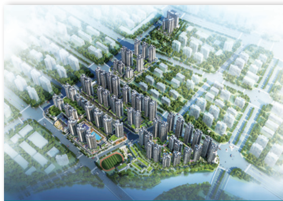
南寧天譽花園－效果圖

截至二零一五年二月二十五日，所有區域均在施工中。建築面積約 78,000 平方米的第 3 區物業單位已開始預售，截至二零一五年二月二十五日已簽訂銷售合同金額約為人民幣 185,000,000 元，佔建築面積 42.2% ，該等物業單位預定於二零一六年第四季度開始交付買家。管理層亦計劃開始預售第 4 及 5 區內若干部分，並預期自二零一六年末至二零一八年分階段向買家作出實體交付。第 4 、 6 及 7 區內總建築面積合共為 289,000 平方米將交付予市政府作為安置房屋，並已於年內從區政府收取訂金合共約人民幣 993,200,000 元。此外，本集團已經收到有興趣團體買家的訂金約人民幣 179,900,000 元。