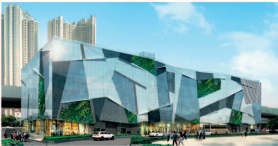
■ 位於新界沙田馬鞍山保泰街沙田市地段第482號之購物商場－地基工程進行中(*)