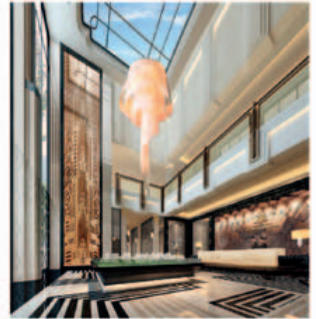
■ 綜合發展項目之住宅大樓大堂(*)