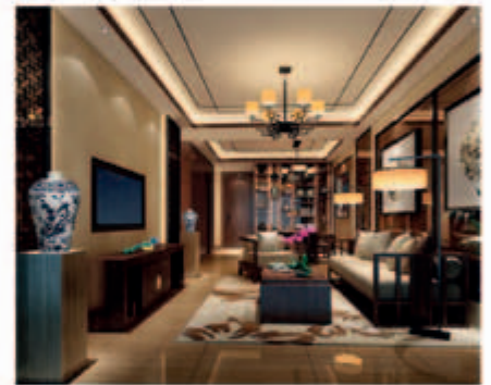
■ 綜合發展項目之住宅單位內部(*)