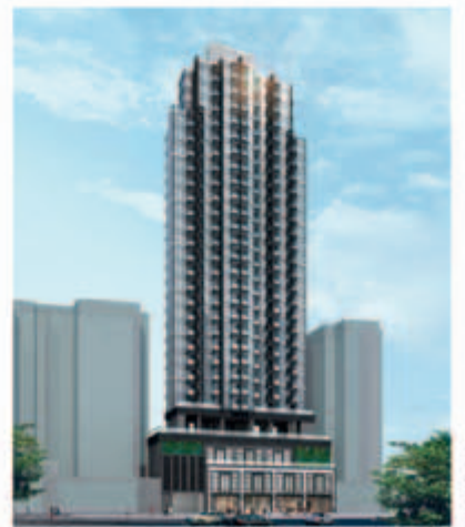
■ 位於九龍深水埗順寧道69至83號之商業/住宅發展項目－地基工程進行中(*)