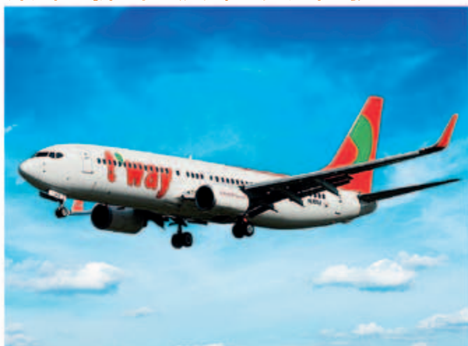
■ 波音 737-800 型號飛機