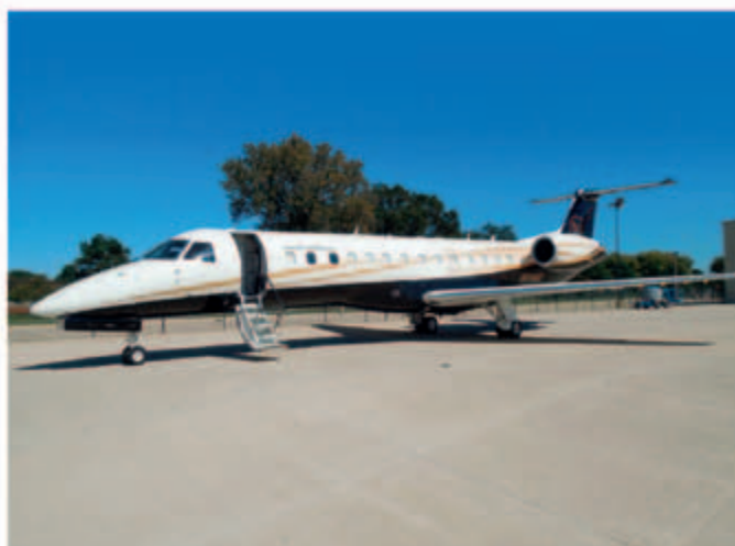
■ ERJ-135 型號 Embraer 飛機