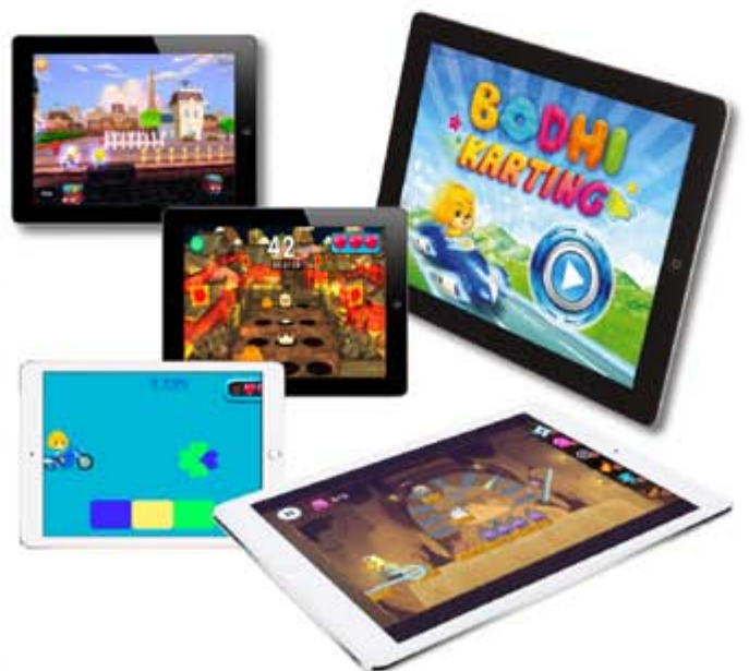
■ 以寶狄與好友為基礎之多元化教育類Apps及遊戲