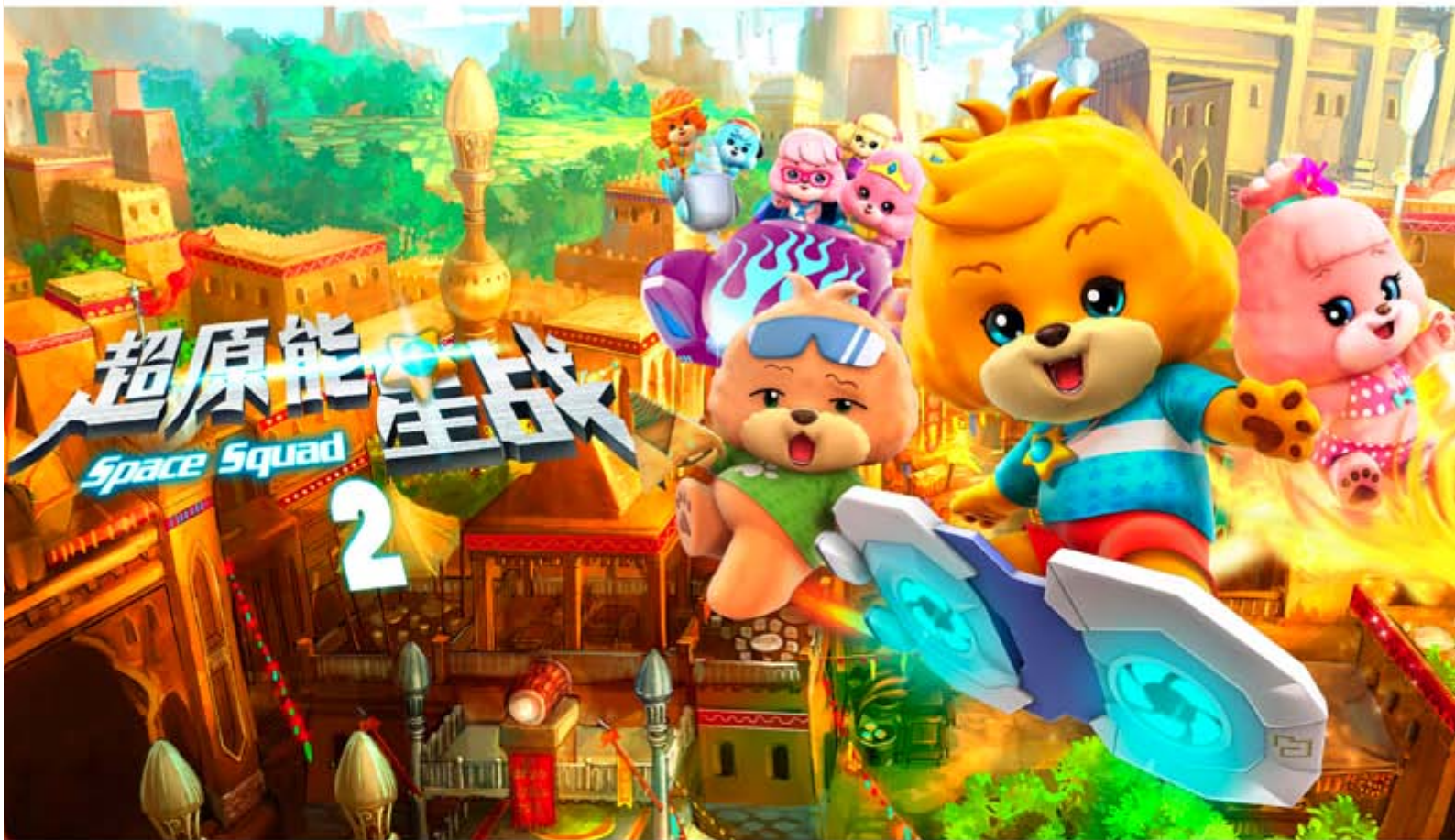
■ 超原能星戰：第二季旗艦動畫系列將在中國播放