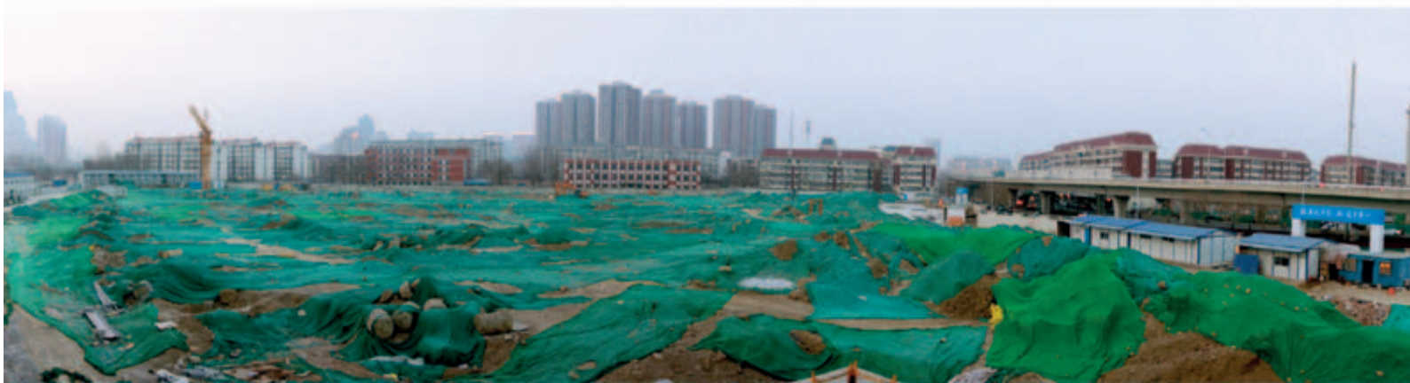
■ 位於天津之綜合發展項目一打樁工程經已完成