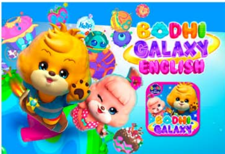
■ 寶狄學堂：為學前兒童提供學前英語學習平台