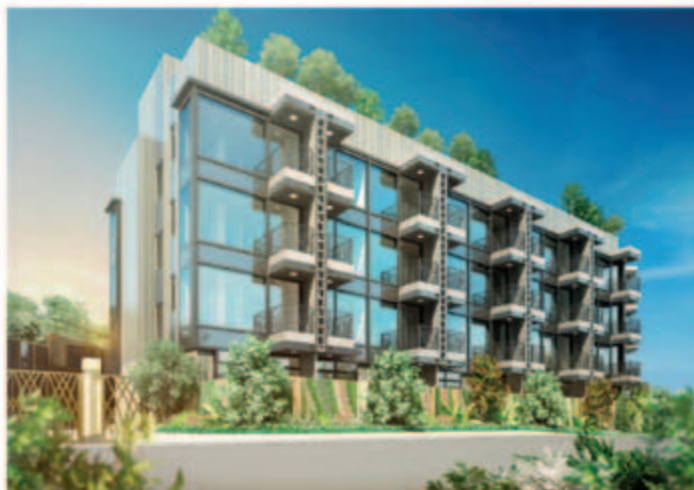
■ 位於元朗丹桂村路之住宅發展項目之公寓單位：尚築(*)