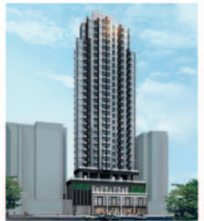
■ 位於九龍深水埗順寧道69至83號之商業/住宅發展項目－地基工程進行中(*)