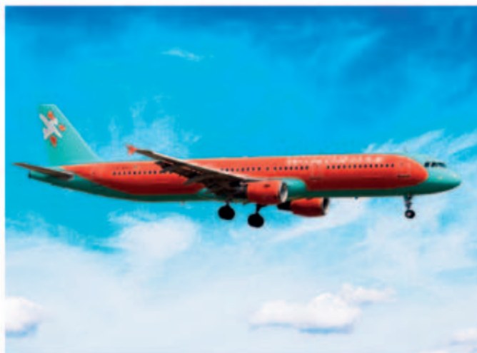
■ A321-211 型號空中巴士