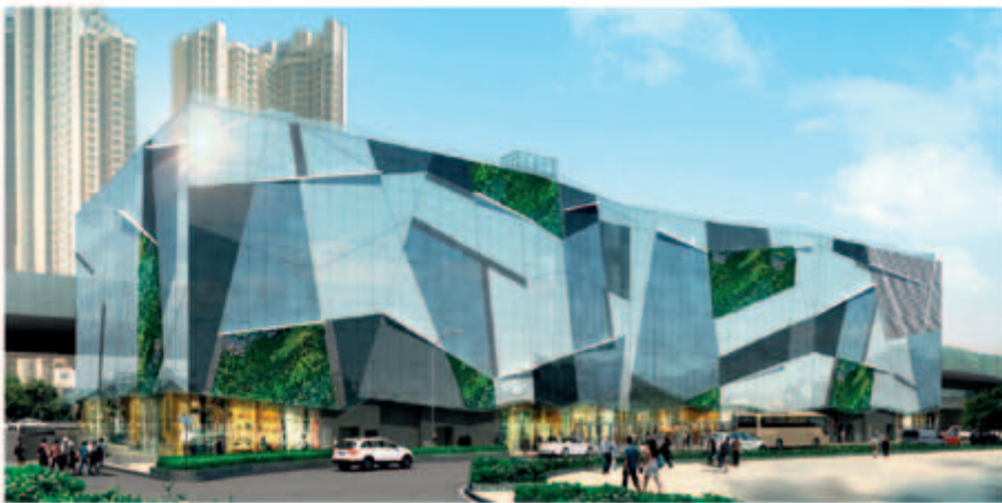
■ 位於新界沙田馬鞍山保泰街沙田市地段第482號之購物商場－地基工程進行中(*)