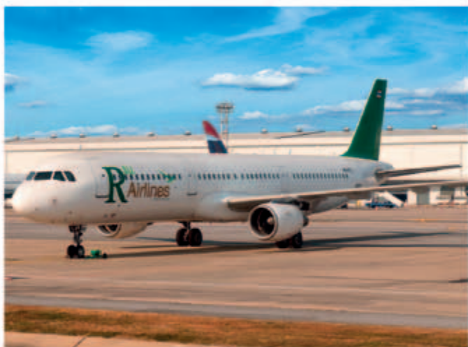
■ A321-200 型號空中巴士