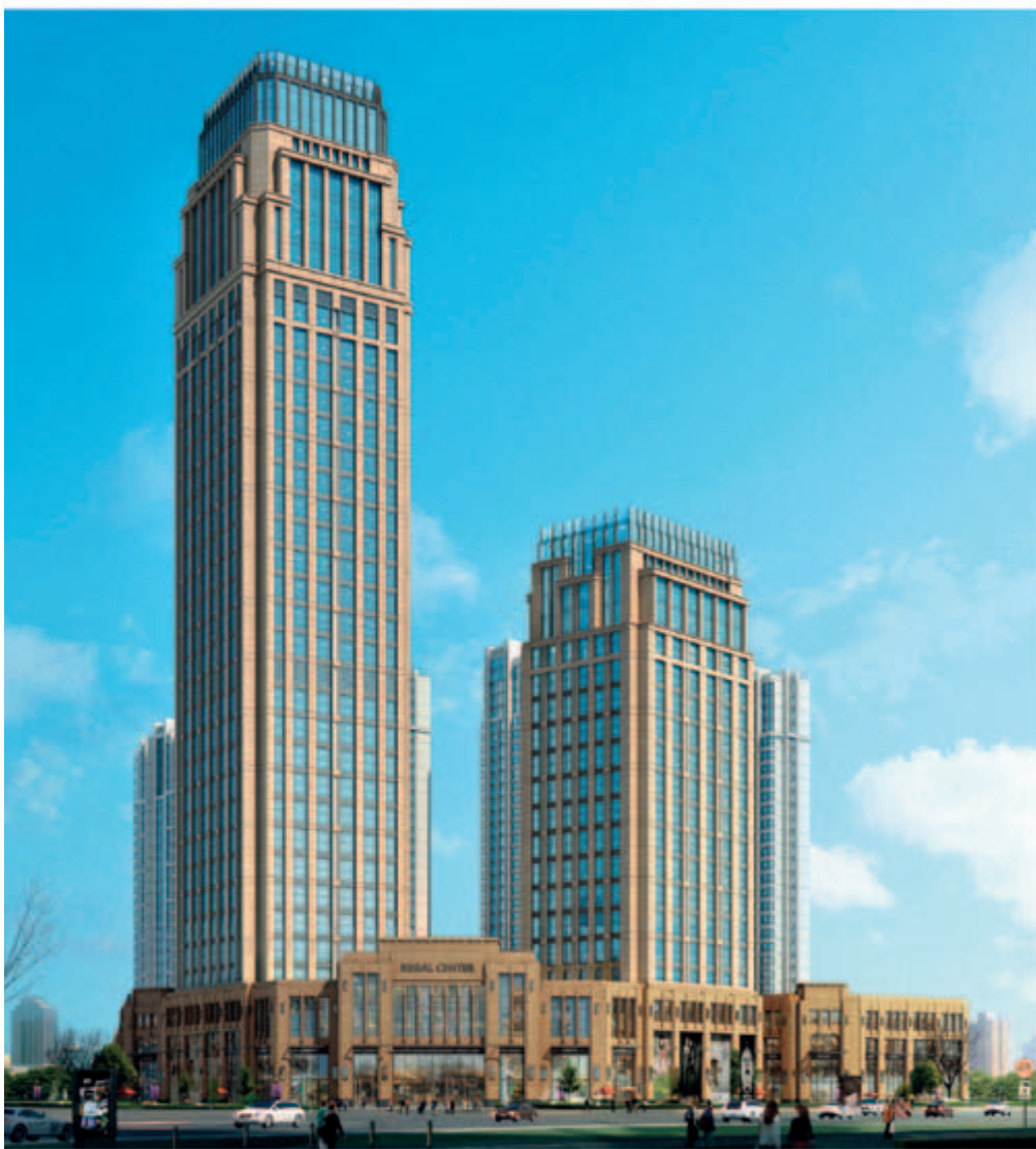
■ 位於天津黃金地段之商業/寫字樓/住宅綜合發展項目(*)