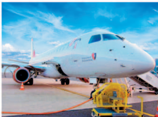
■ E175 型號 Embraer 飛機