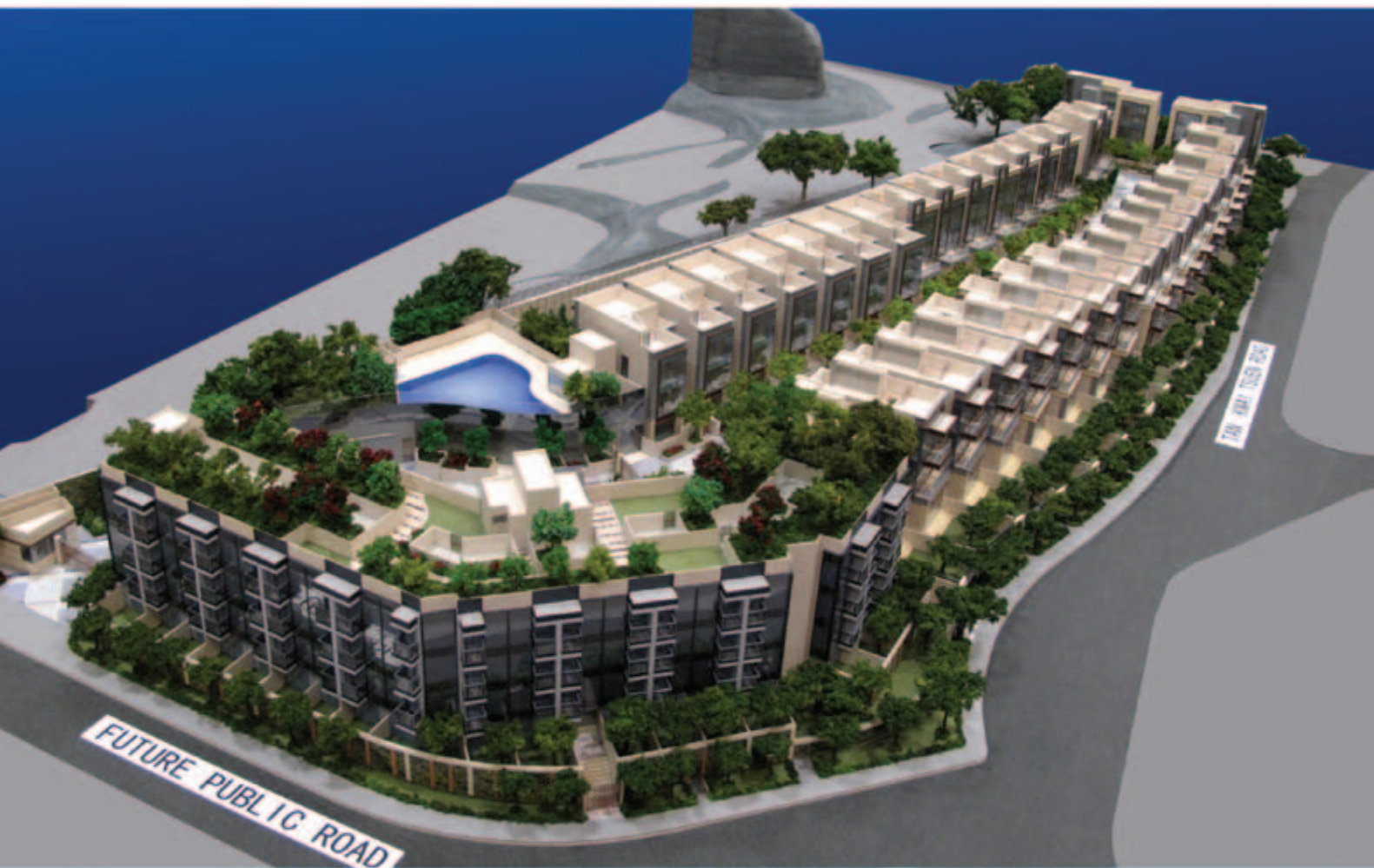
■ 位於新界元朗丹桂村路分界區 124 號地段第 4309 號之住宅發展項目—接近竣工