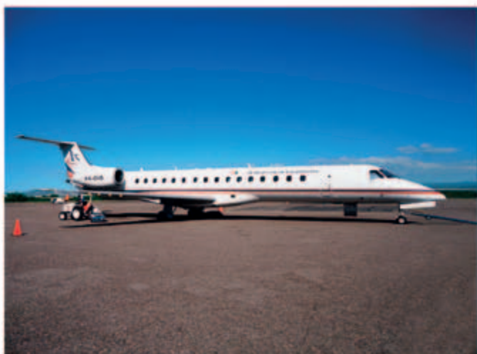
■ ERJ-145 型號 Embraer 飛機