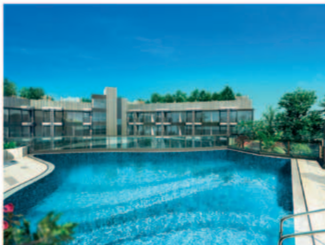
■ 位於元朗丹桂村路之住宅發展項目之會所內之游泳池(*)