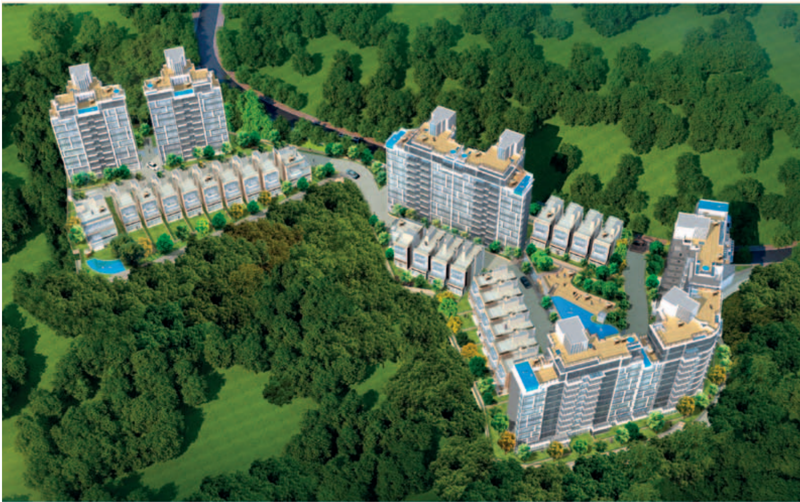
■ 位於新界沙田九肚第56A區沙田市地段第578號之豪華住宅發展項目－地基工程進行中(*)