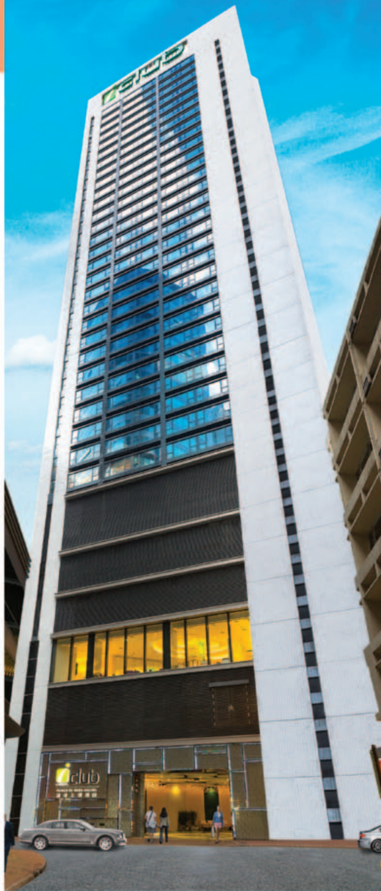
■ 位於上環文咸東街 132 至 140 號之富薈上環酒店 — 已於二零一四年落成及開始營運