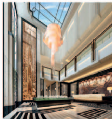
■ 綜合發展項目之住宅大樓大堂(*)