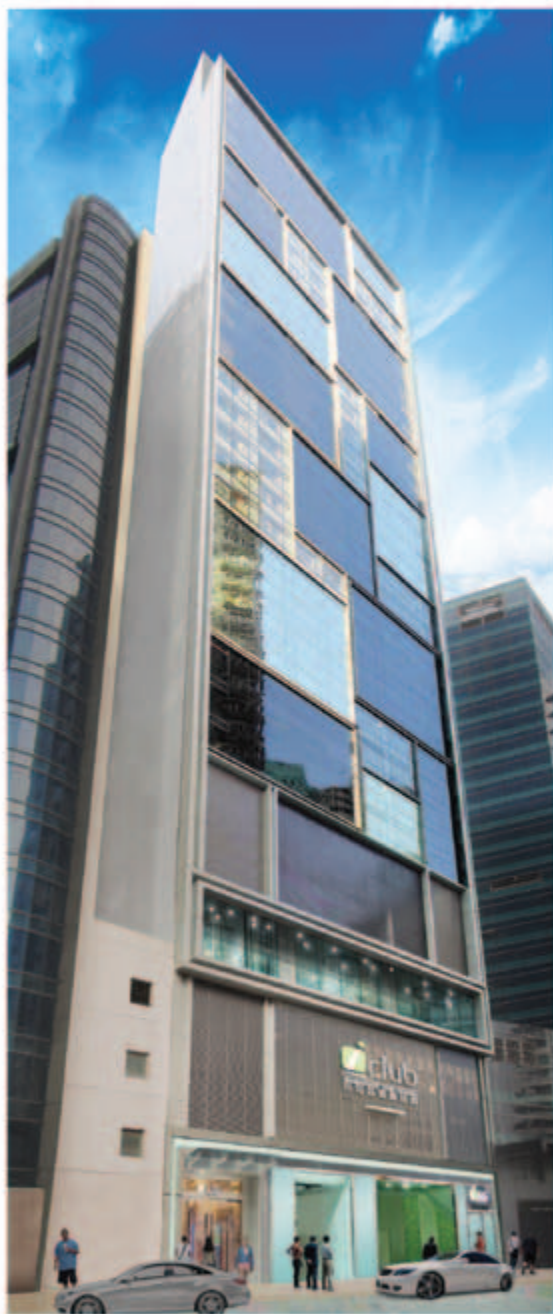
■ 位於北角麥連街 14 至 20 號之富薈炮台山酒店 — 已於二零一四年落成及開始營運