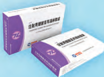
注射用醋酸亮丙瑞林微球