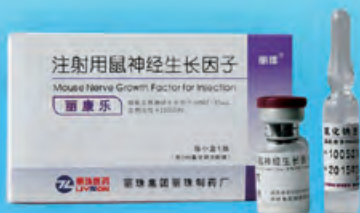
注射用鼠神經生長因子