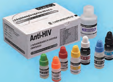
人類免疫缺陷病毒抗體 診斷試劑盒