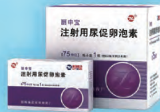
注射用尿促卵泡素