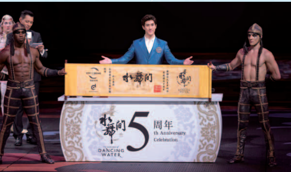
專為澳門度身打造的《水舞間》是澳門首個及唯一世界級水上匯演，至今上演超過2,000場次，為全球各地逾3,200,000名觀眾帶來精彩震撼體驗

本集團積極審慎發掘包括日本在內的環球發展商機。展望未來，新濠將繼續實現領導全球博彩、消閒和娛樂行業的願景，致力推行多元化發展，抓緊在全球各地提供豐富多元的博彩及非博彩業務的機遇。