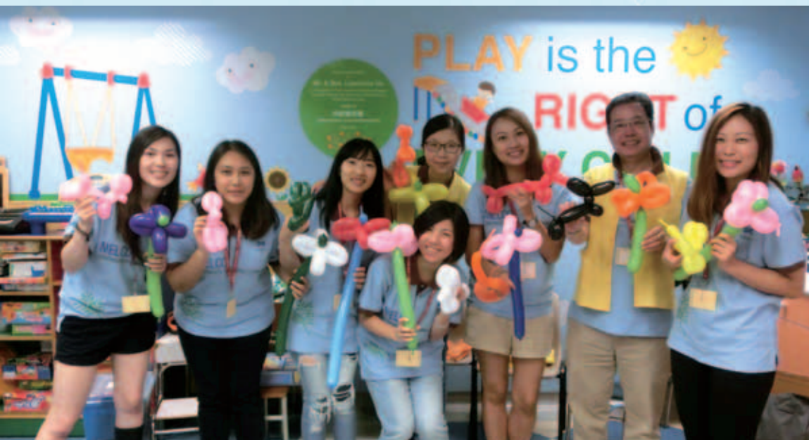
「關懷社區」是新濠企業文化中重要的一環

新濠一直視企業社會責任為本集團營運的關鍵一環，其為貢獻社會，以及關顧與我們息息相關的環境及社區而悉力以赴。