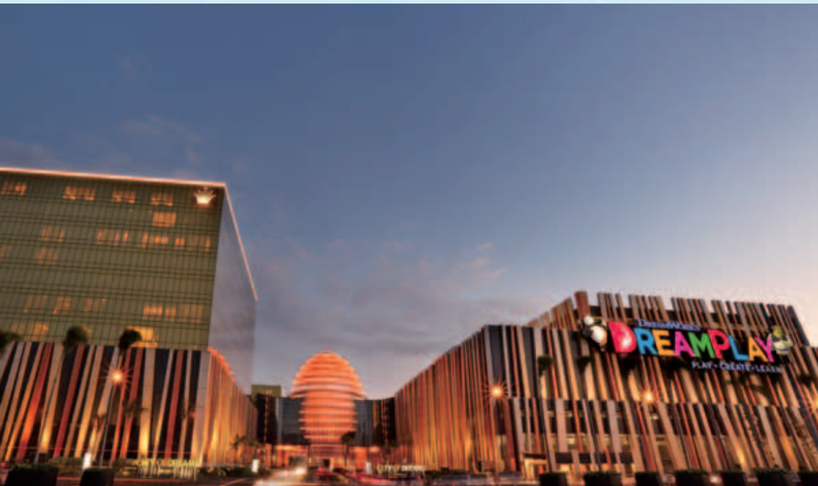
新濠天地(馬尼拉)標誌著新濠成為亞洲領先的 博彩、消閒及娛樂企業的重要里程碑

此分類負責本集團之物業及其他財務投資。截至二零一五年六月三十日止六個月期間，此部門錄得分類溢利18,100,000港元，較二零一四年同期之15,800,000港元增加14.2%，主要是因為截至二零一五年六月三十日止六個月期間之利息收入增加及匯兌虧損淨額甚微。