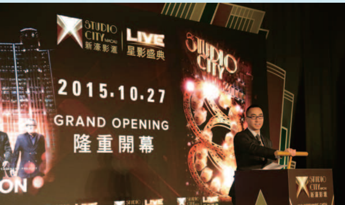
新濠影滙是澳門一個以電影為主題的全新娛樂及消閒項目，將於二零一五年十月二十七日正式開幕

本集團的核心博彩業務透過其主要聯營公司新濠博亞娛樂經營，儘管澳門仍處於充滿挑戰的市場環境，新濠博亞娛樂仍然取得穩健的營運及財務表現。二零一五年上半年的淨收益及經調整物業EBITDA分別為1,971,000,000美元