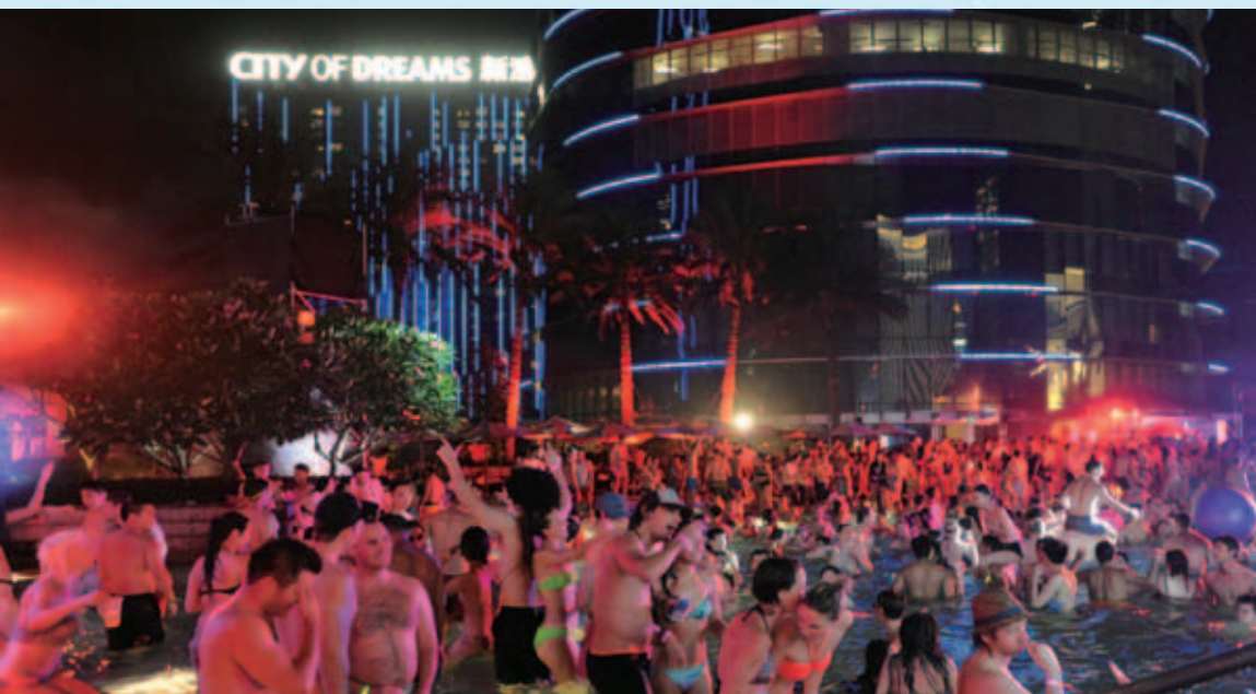
由新濠天地獨家呈獻的SPLASH池畔派對舉辦五年來， 已成為亞洲區派對界最觸目年度盛事

EGT從事角子機營運、於中印地區發展及經營地區娛樂場及博彩會所，以及設計、製造及分銷博彩籌碼及飾板籌碼。經計及根據香港財務匯報準則作出的調整後，於回顧期間，本集團應佔來自EGT的分類溢利為27,000,000港元（截至二零一四年六月三十日止六個月期間：無）。