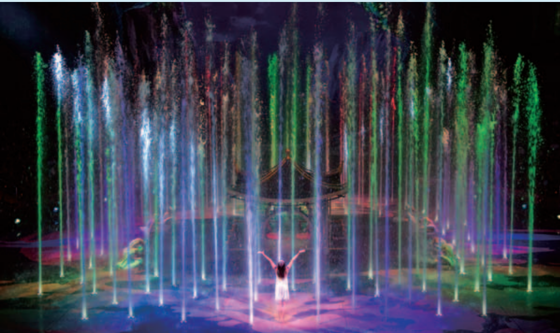
全球最大型及最壯觀的水上匯演《水舞間》為澳門增添更豐富的非博彩旅遊元素，是吸引訪澳旅客的其中一個重點娛樂項目

即將開幕的新濠影滙所提供的多種創新消閒及娛樂設施將進一步豐富本集團的娛樂組合，同時提升我們的市場佔有率。新濠影滙位於澳門的優越地段，毗鄰連接中國橫琴島的蓮花大橋及擬建的澳門輕軌車站，方便旅客到訪。訪澳旅客人數將會就修訂新禁煙法及延長訪澳旅客簽證的潛在可能性而有可能提升。