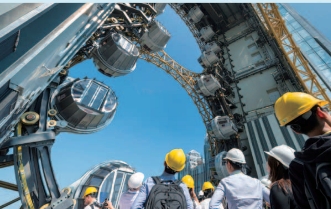
新濠影滙富裝飾派藝術風格的外牆建有全球最高「8」字形摩天輪「影滙之星」

Entertainment Gaming Asia Inc. (「EGT」) 於納斯達克資本市場上市，本集團持有EGT 64.8%之實際股本權益。在其博彩籌碼及飾板籌碼銷售以及博彩業務的收益均見增長所帶動下，EGT於二零一五年上半年錄得15,900,000美元的綜合收益，按年增加約65.2%。EGT於二零一五年上半年錄得綜合淨收入及經調整EBITDA分別為2,000,000美元和5,700,000美元。截至二零一五年六月三十日，EGT錄得現金結餘24,600,000美元及並無負債。