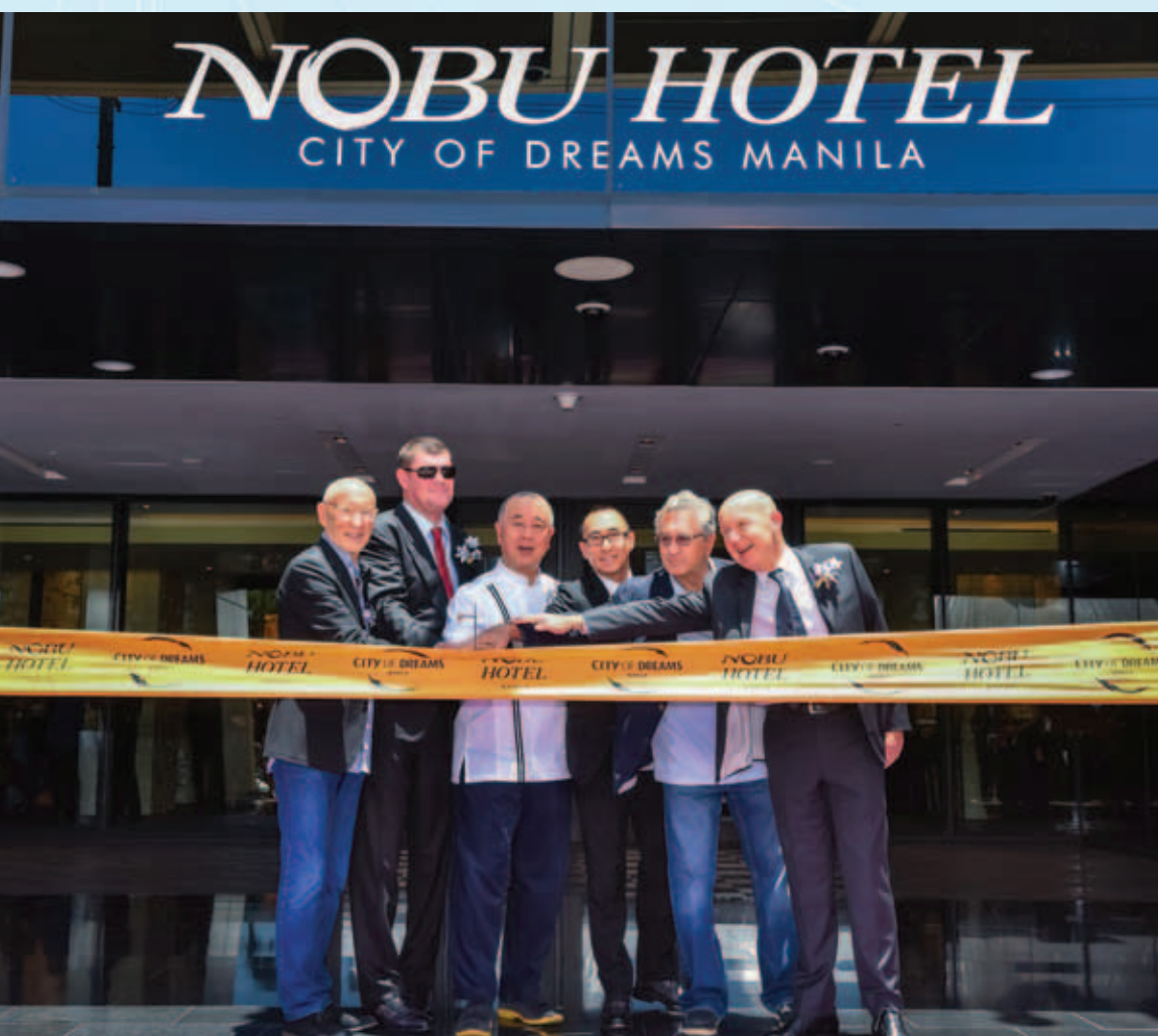
以開創潮流聞名的精品酒店Nobu酒店慶祝開幕，為到訪新濠天地（馬尼拉）的旅客帶來最具型格以及最刺激奢華的頂級體驗