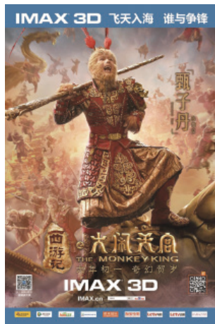
《西遊記之大鬧天宮》