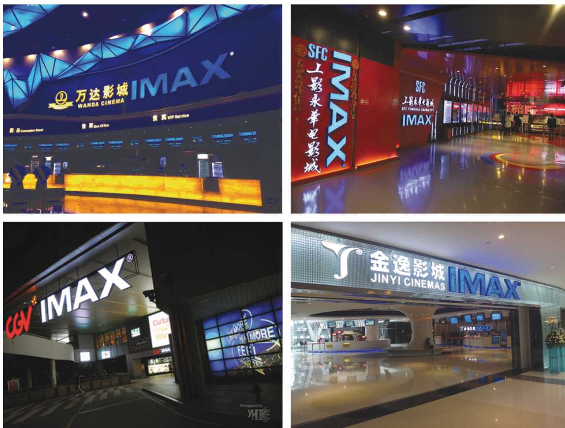
由若干放映商合作夥伴運營的IMAX影院大廳