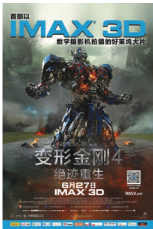
《變形金剛4：絕跡重生》