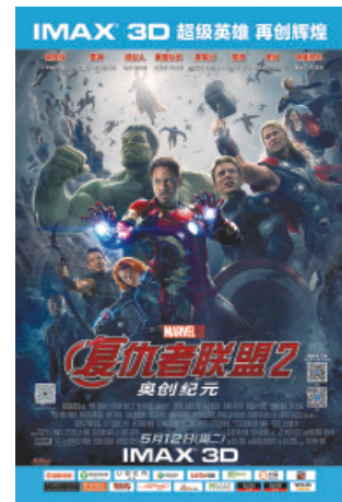
《復仇者聯盟2：奧創紀元》

好萊塢影片在IMAX Corporation平台上作全球發行，通常由IMAX Corporation使用專有IMAX DMR轉製技術轉製為IMAX格式(可提升影片的影像品質)。詳情請參閱「IMAX技術」。我們的行政總裁及影院開發與電影製作總監均為IMAX Corporation高管人員管理委員會的成員，該委員會就好萊塢影片轉製為IMAX格式與製片廠磋商，積極參與有關討論、分析和決策流程。