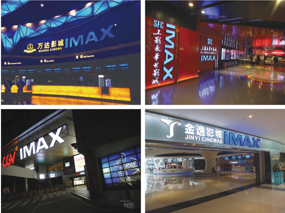
由一些放映商合作夥伴運營的IMAX影院大廳