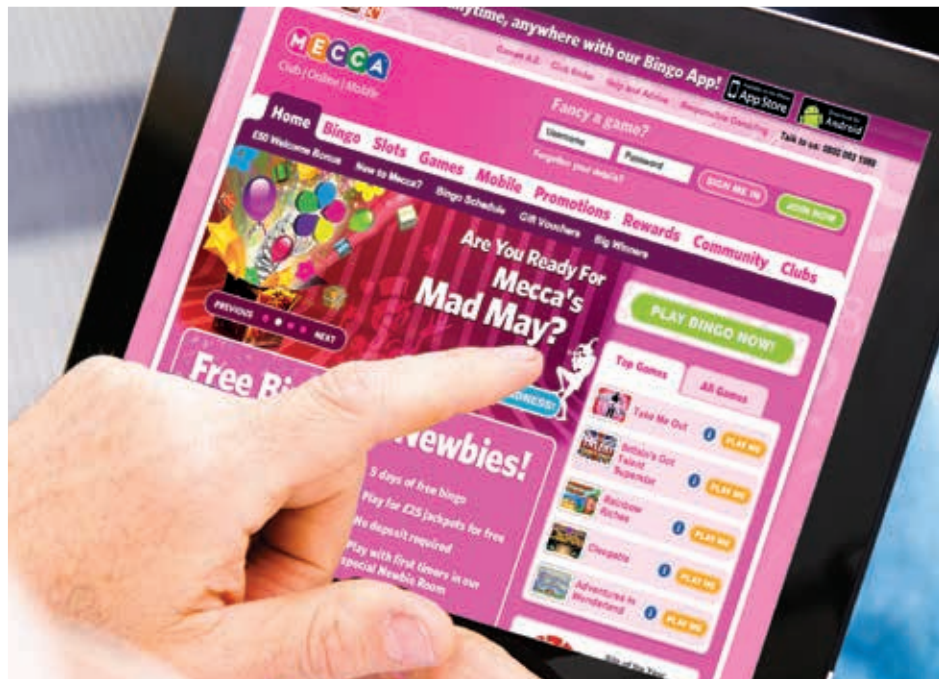
Rank 的數碼渠道提供一系列的博彩娛樂包括實況賭場，bingo及多種角子機遊戲。

持續經營業務的收益增長3%至7.007億英鎊，而電子博彩業務強勁增長18%，然而Mecca Bingo場所(繼一些業績欠佳的場所關閉後)的收益減少以及西班牙及比利時以歐元計值的收入受到不利匯兌影響而抵銷。