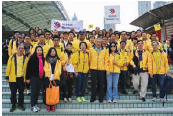
國浩於 2015 年公益金百萬行整體籌款金額排名第二。

於二零一四年，Rank推出一項募捐和自願者工作計劃—Rank Cares，支持Carers Trust幫助一些需要照料的人。此計劃為從事常令人心身俱疲工作的人士提供支持、諮詢和濟助，並提供框架予Rank的員工自願投入時間來協助Carers Trust。於二零一五年六月三十日，Rank已為Carers Trust籌得80萬英鎊。