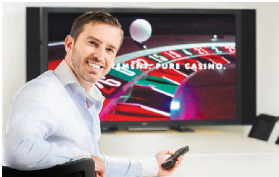
Grosvenor Casinos 透過跨媒體促銷活動推出一個包括博彩場所、流動電話及電腦桌面的三渠道博彩遊戲。

未計特殊項目經營溢利相比去年上升16%至8,400萬英鎊，三個品牌的溢利全部均錄得增長。Grosvenor Casinos品牌的經營溢利增加17%至6,650萬英鎊。而儘管受自二零一四年十二月一日起所有英國電子博彩業收入均須徵收的15%遠程博彩稅(以消費基準計)之影響，其數碼渠道收益首次錄得溢利。雖然各場所收益較去年稍微下跌，Mecca的溢利增加16%至4,300萬英鎊。溢利顯著改善，主要是由於bingo的博彩稅率由20%削減至10%、收緊控制場所成本及關閉一些業績欠佳的會所等所致。