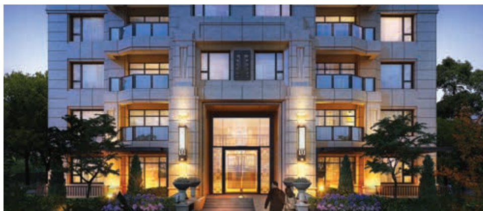
構思圖 – 上海住宅項目·長風滙都

中國新房價格於二零一五年七月連續三個月上升。在70個主要城市當中，31個城市的房價增強，而北京及上海等一線城市正帶領復甦。