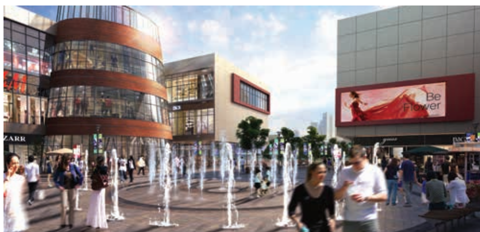
構思圖 – 上海·長風·國盛中心