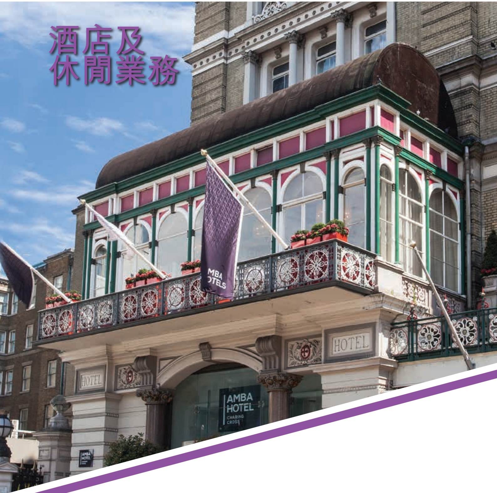
倫敦 · Amba Hotel Charing Cross