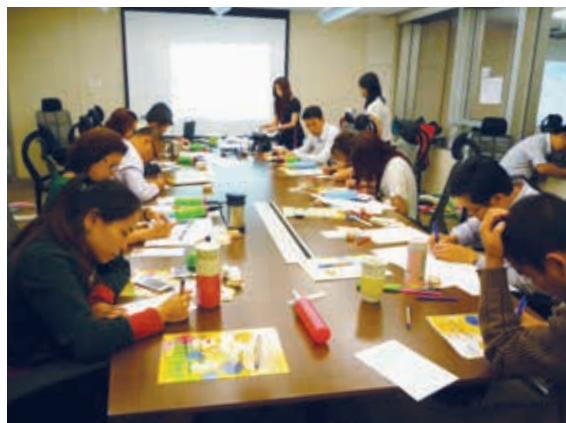
國浩員工參加月餅工作坊及家長工作坊。