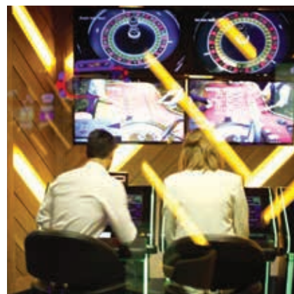
Rank 的賭場及bingo場所為客戶提供最佳的賭博及遊戲體驗。

特殊項目及已終止業務合共貢獻1,790萬英鎊，包括由於關閉或出售一些bingo會所後所得之重組及法律成本210萬英鎊、以及已終止業務的稅務撥備撥回1,580萬英鎊。撥回稅務撥備主要與成功終結一項轉移定價之長期爭議有關。