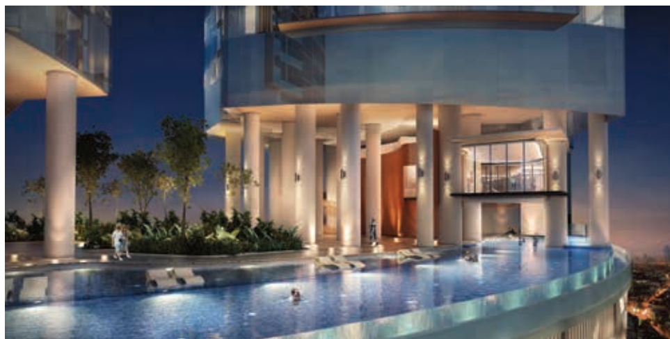
構思圖 – DC Residency，白沙羅城住宅泳池景色