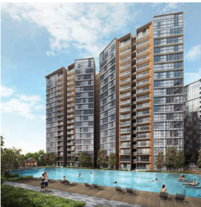
構思圖 – 新加坡 Sims Urban Oasis 住宅項目

新加坡整體樓市依然低迷。根據市區重建局公佈的數據顯示，整體私人住宅物業價格指數於二零一五年第二季度下降了0.9%。這是連續第七個月下跌，跌幅與去年季度大致相同。然而，新加坡對外國人而言仍屬可拓展的市場，外國人於第二季度購買的物業數量(1,017宗成交)較二零一五年第一季度(636宗成交)有所增加。