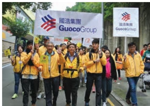
國浩員工參加由香港公益金舉辦的賣旗日及2015年度百萬行。

國浩集團以實現長期股東價值及業務持續發展為業務目標，同時顧及我們的權益人士之利益。本集團相信服務社群不只是經營成功業務不可或缺之一部份，同時是作為全球公民其中一份子應該承擔個人責任之一部份。本集團持續支持社群，從而鞏固本集團與員工、客戶、商業夥伴和其他權益人士之關係及聲譽。