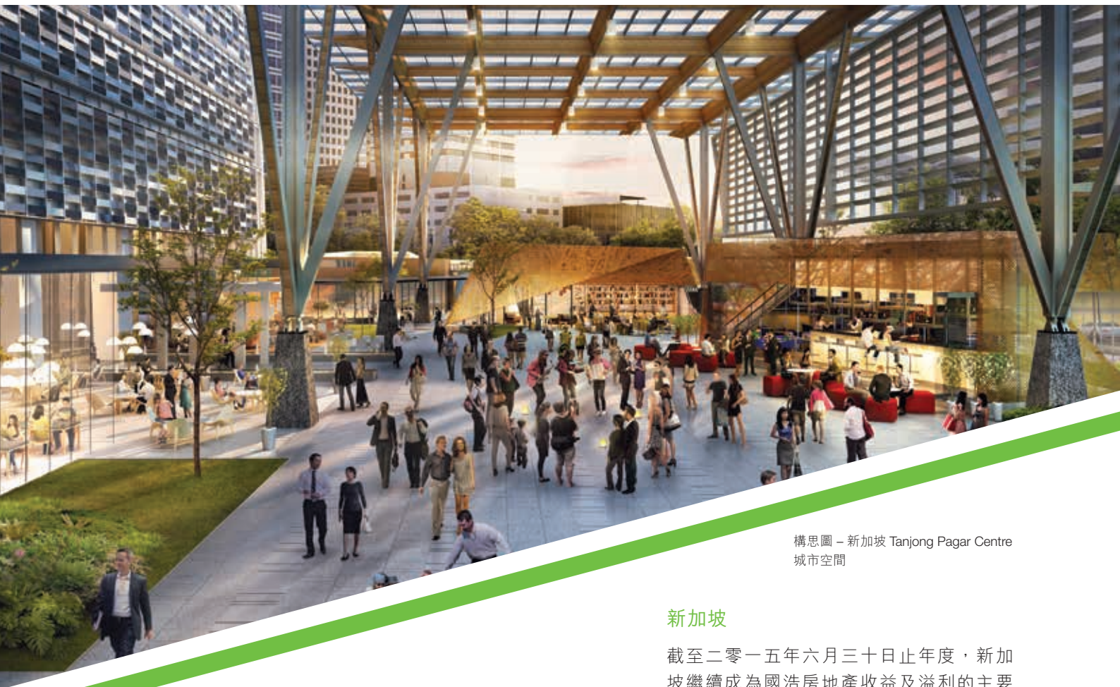
構思圖 – 新加坡 Tanjong Pagar Centre 城市空間