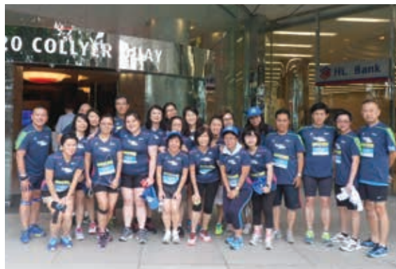
國浩房地產員工參加2015 SGX Bull Charge企業慈善賽跑。

本集團亦積極推動員工熱誠投入參與社會、員工聯誼、郊遊、志願者工作和慈善活動。於年內，香港員工曾參加香港公益金舉辦的百萬行及賣旗日。其他員工聯誼活動包括員工週年晚宴、慈善跑步、月餅工作坊及保齡球比賽等。