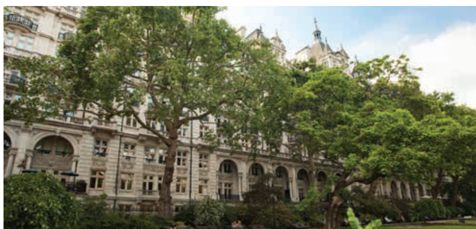
倫敦 · The Royal Horseguards Hotel 園景

以GuocoLeisure兩個新品牌營運的首批酒店於本財政年度已開始營業—於二零一四年十二月開業的Amba Hotel Charing Cross及於二零一五年二月開業的every Hotel Piccadilly。