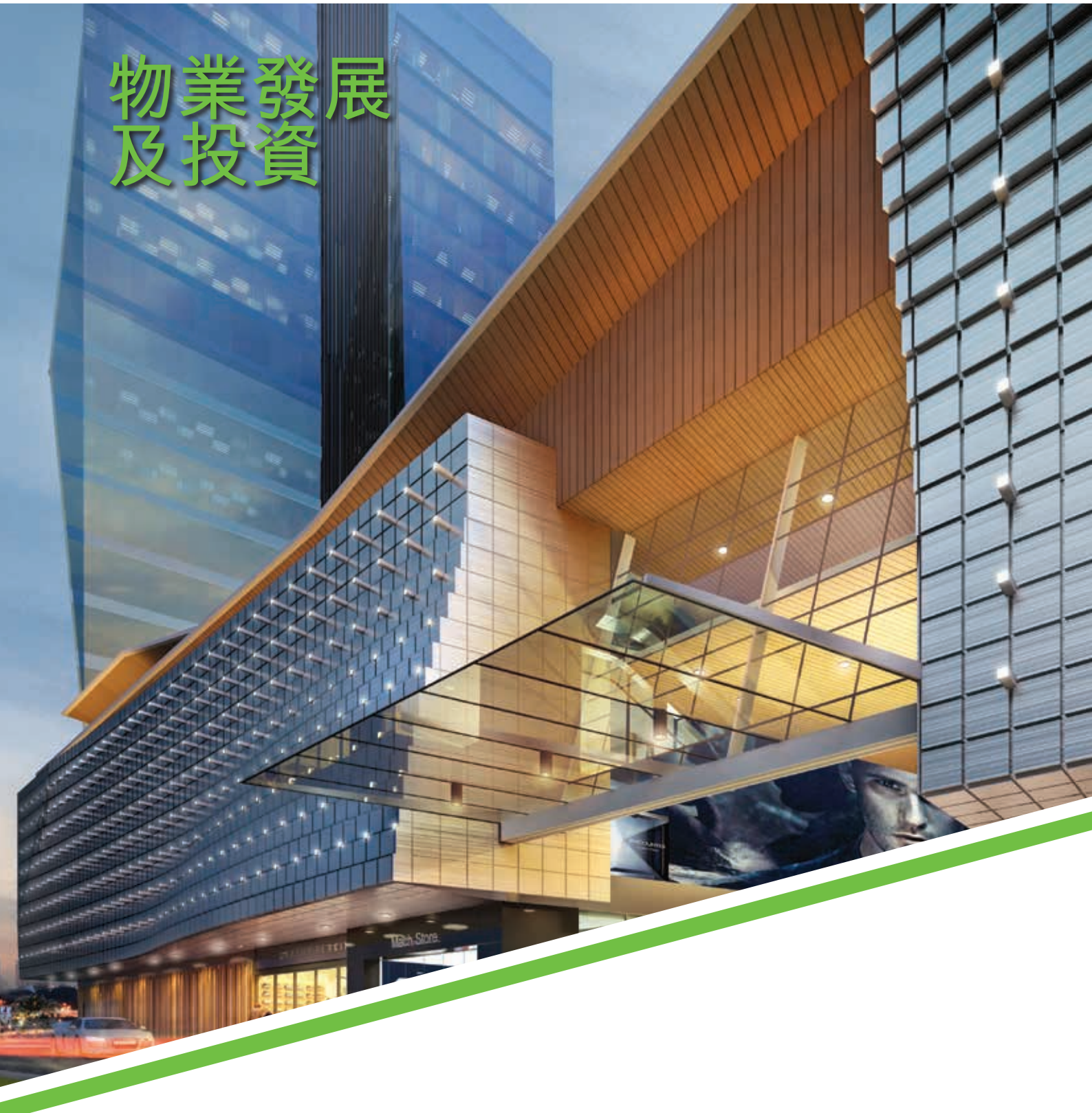
構思圖 - 馬來西亞綜合發展項目·白沙羅城