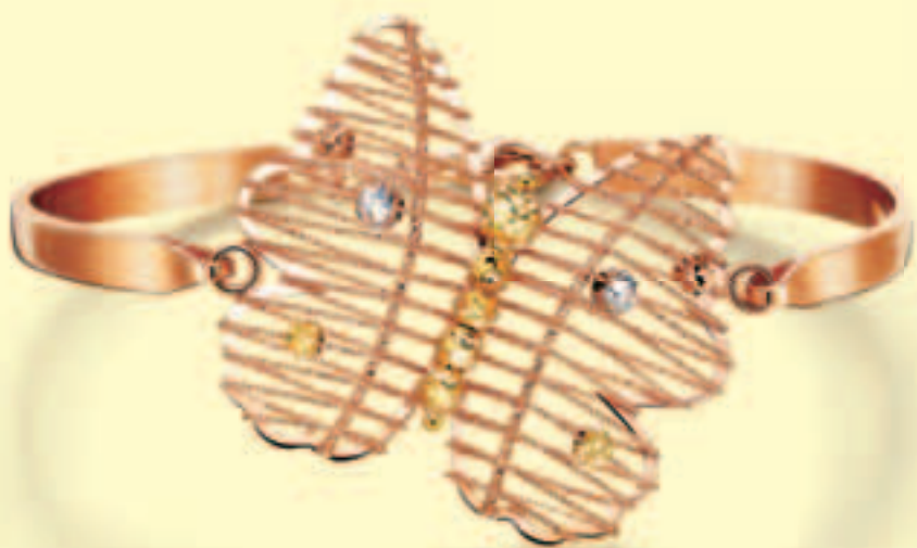
「蝴蝶效應」榮膺於足金首飾設計比賽 2014 公開組 (生活靈感) 得獎作品

本集團持續尋覓貴金屬及寶石產品；實體及電子商務分銷渠道；以及特許專營或聯盟戰略匹配之合作夥伴。