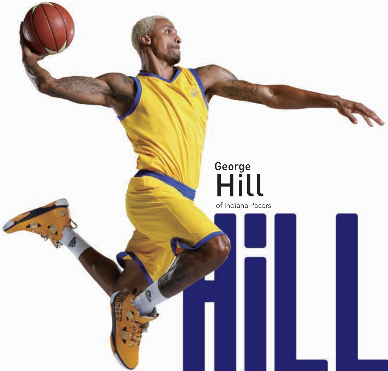
George Hill of Indiana Pacers