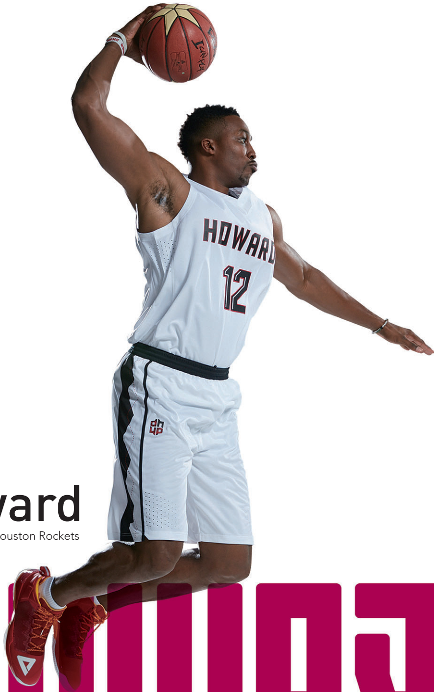
Dwight Howard of Houston Rockets