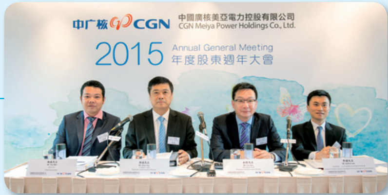
召開第一次股東週年大會