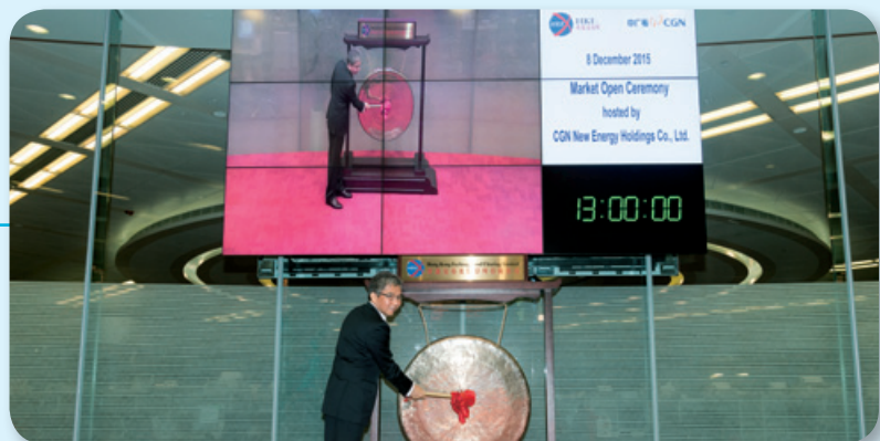
舉行開市儀式，慶祝公司更名