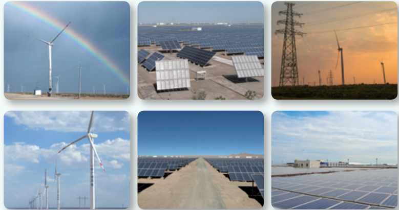
完成向中廣核集團有限公司收購第一批非核清潔及可再生能源發電資產