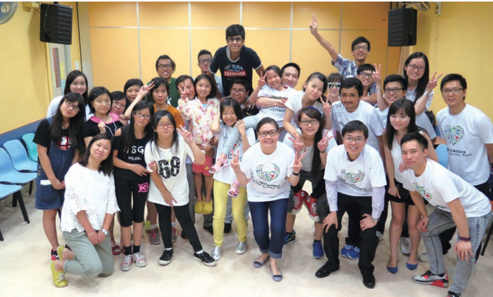
為一群年青參加者及精電義工舉行之新社會服務計劃迎新活動

政策的清晰編撰可預防僱員的爭論及糾紛，員工手冊已闡明僱員規章制度。到目前為止，集團並無發現任何構成貪污行為的個案。