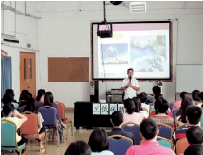
香港長春社在河源廠房舉辦環保講座

本集團的香港總部已開始在日常營運中推行「綠色辦公室」概念。2015年，本集團榮獲世界綠色組織頒發「綠色辦公室標誌」。同年，總部第二年進行了碳排放審核，並獲得「商界減碳建未來辦公室」認證。