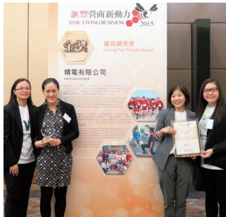
精電獲頒僱員關懷金獎