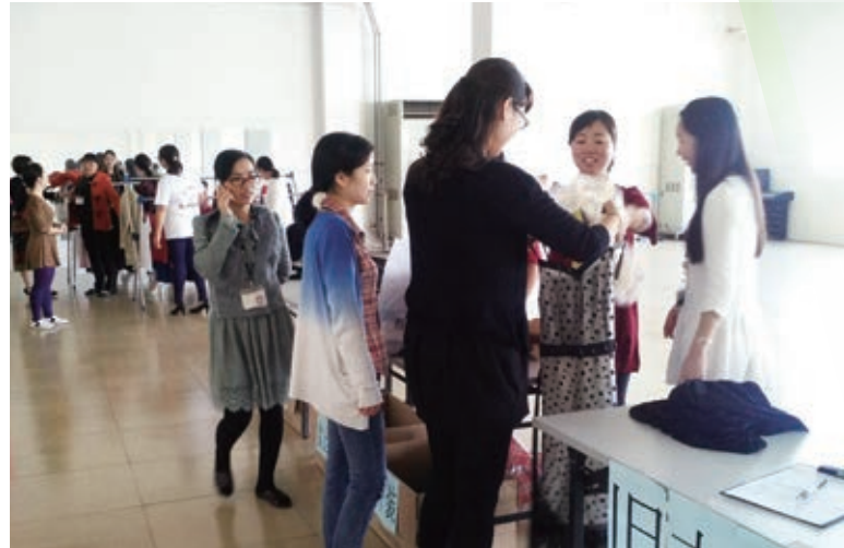
在廠房舉行「舊衣交換計劃」受到同事們的支持

除了植樹及綠色騎行活動外，生產廠房於回顧年度內首次舉辦「舊衣交換計劃」，邀請職員互相交換舊衣。同事對該計劃熱烈支持，並表示希望來年公司繼續舉辦此項活動。