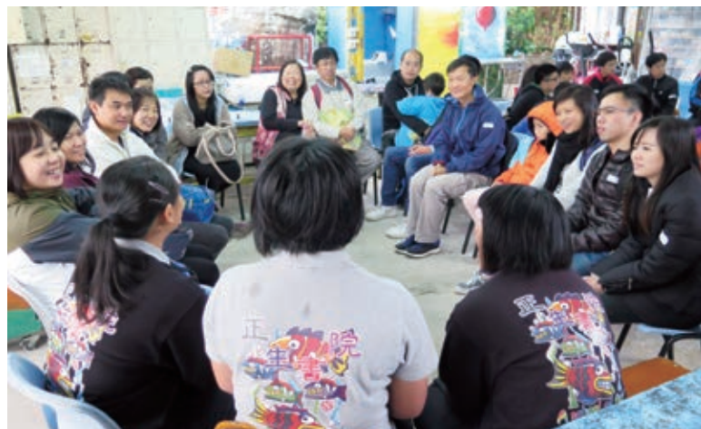
公司同事參加基督教正生書院一日遊

2015年第四季度，集團邀請僱員及家屬參加公司旅行活動，前往位於香港南丫島的基督教正生書院。基督教正生書院為一所私立學校，旨在透過生命教育改造受毒癮及其他問題困擾的學生。精電員工及其家屬在此次探訪中了解該校的宗旨及其訓練活動，認識到該校學生可以獲得的服務並不足夠，並目睹這群青少年在該校接受訓練後出現的正面轉變。這是一次有意義的旅程，過程充滿積極正面的訊息。該書院希望日後可興建新校舍，為需要幫助的學生提供安全及完善的設施，為表支持，本集團捐款資助該書院。