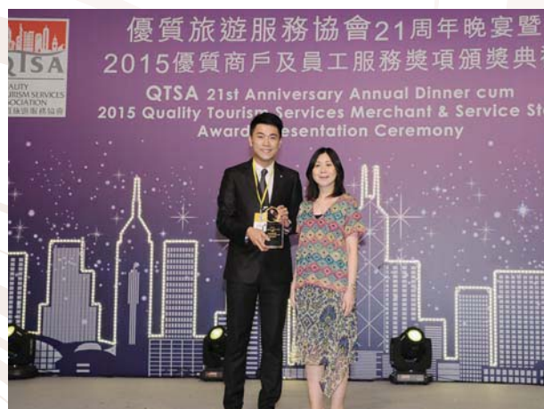
2015年優質商戶及員工服務獎 珠寶及鐘錶類別金獎 香港優質旅遊服務協會，2015年5月