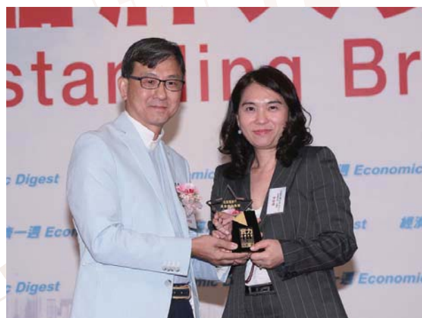
2015年實力品牌大獎 鐘錶零售商類別 經濟一週，2015年6月