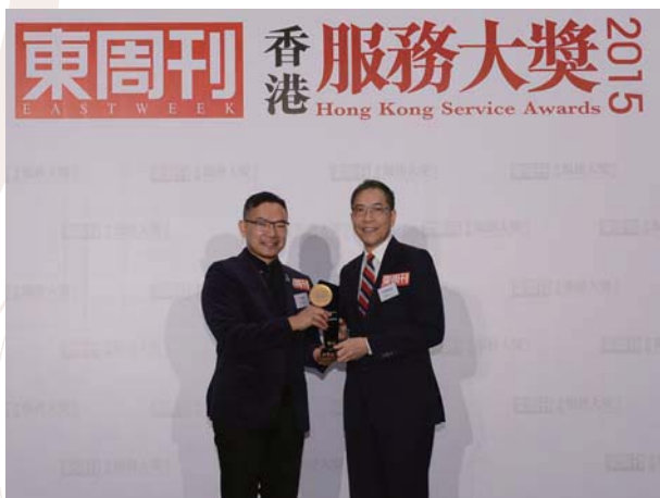
2015年香港服務大獎 名貴鐘錶行類別 東周刊，2015年3月