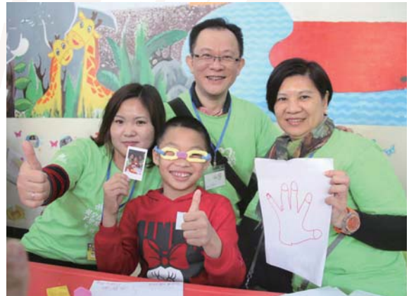
河北省志願者之旅