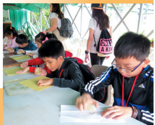
兒童學習以石頭敲打樹葉的表面，製作奇妙的水印圖畫。