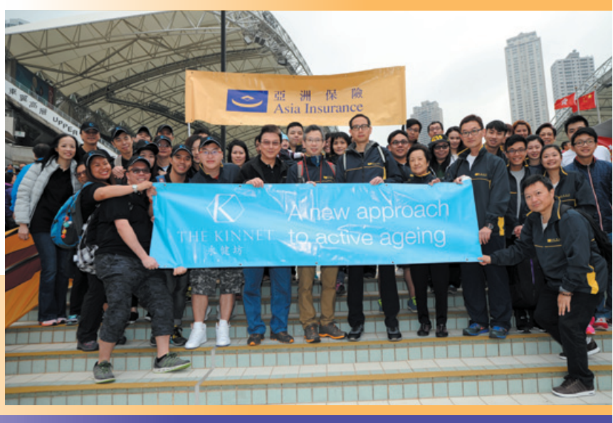
每年，亞洲金融集團、亞洲保險及永健坊的員工都積極參與香港公益金港島區百萬行籌款活動，幫助有需要的人士。

在2015年11月及2016年3月，亞洲金融集團義工隊與基督教香港信義會社會服務處—屯門青少年綜合服務中心攜手舉辦之『讓我閃耀』服務計劃，讓屯門寶田邨約30位小朋友透過參與東涌濕地、昂平市集及馬鞍山礦場等不同的團體活動，認識大自然和生態保育，並且在發揮潛能的活動中取樂。