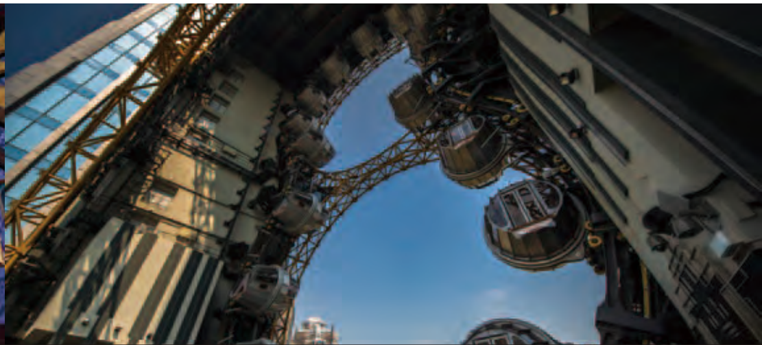
新濠影匯的「影匯之星」是全球首個及亞洲最高的「8」字型摩天輪，已經晉身為澳門以至亞洲的閃亮新地標。