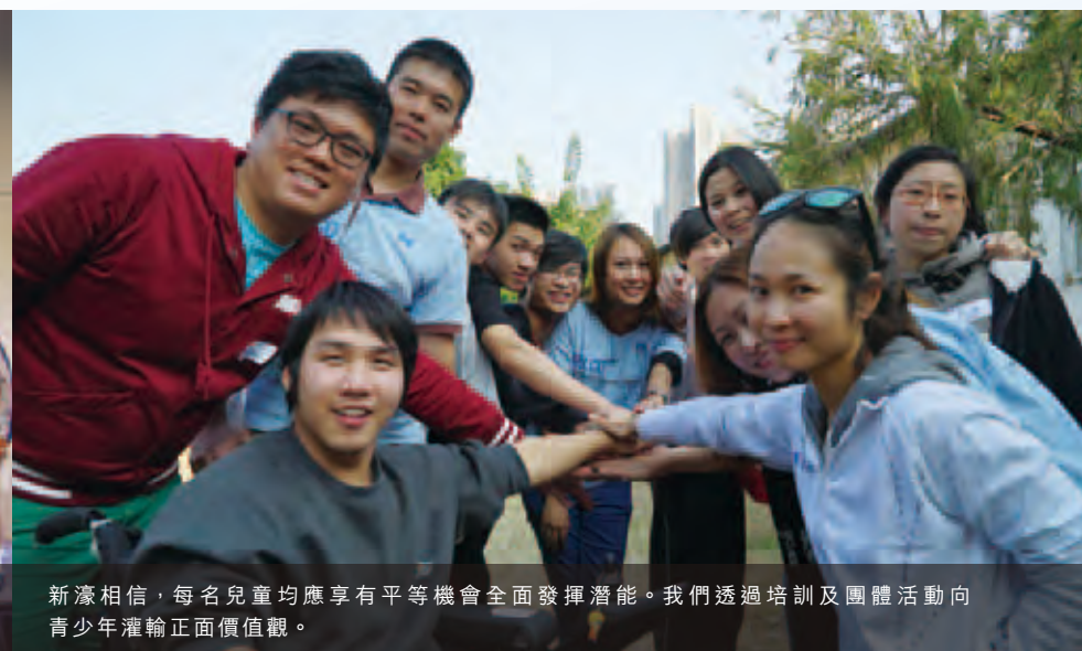
新濠相信，每名兒童均應享有平等機會全面發揮潛能。我們透過培訓及團體活動向青少年灌輸正面價值觀。