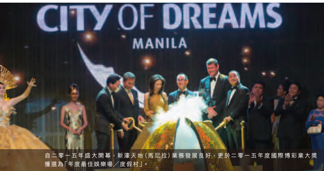
自二零一五年盛大開幕，新濠天地（馬尼拉）業務發展良好，更於二零一五年度國際博彩業大獎獲選為「年度最佳娛樂場／度假村」。

至於亞洲其他地區方面，集團擁有位於俄羅斯海參崴附近之濱海綜合娛樂區的娛樂場項目「Tigre de Cristal水晶虎宮殿」的權益。該項目於二零一五年十一月十一日正式開幕並取得理想成績。該項目是俄羅斯遠東地區的娛樂區中首個綜合娛樂場度假村，亦是俄羅斯聯邦內最具規模的。本集團掌握市場先驅的優勢，勢將吸引鄰近的亞洲東北部、距離項目只有三小時航程的四億人口，以及俄羅斯的國內顧客到訪該項目。俄羅斯政府全力支持該綜合娛樂區的發展，推出有利的入境及其他經濟政策，盡顯該區成為北亞博彩重地的潛力。