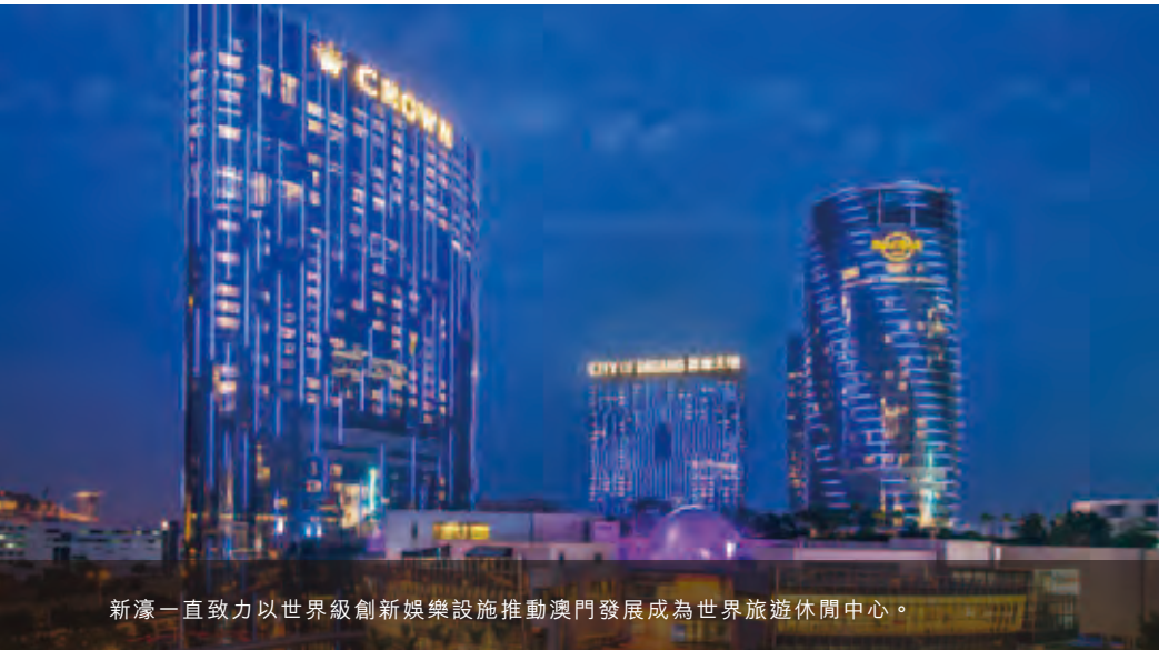
新濠一直致力以世界級創新娛樂設施推動澳門發展成為世界旅遊休閒中心。

與此同時，我們的旗艦綜合度假村新濠天地不斷推出創新構思，致力提升訪客體驗。其中包括在全球最大型水上滙演《水舞間》五週年之際，破天荒推出《水舞間》探索之旅，讓觀眾可踏足這個世界級滙演的後台及深入《水舞間》的水底世界。此外，新濠