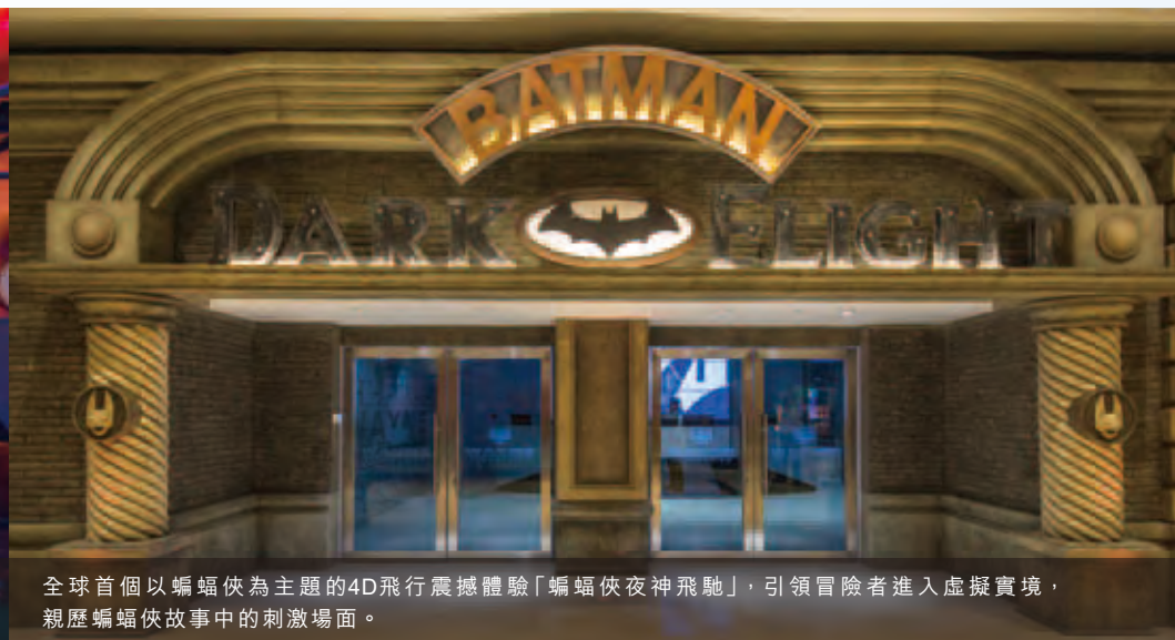
全球首個以蝙蝠俠為主題的4D飛行震撼體驗「蝙蝠俠夜神飛馳」，引領冒險者進入虛擬實境，親歷蝙蝠俠故事中的刺激場面。