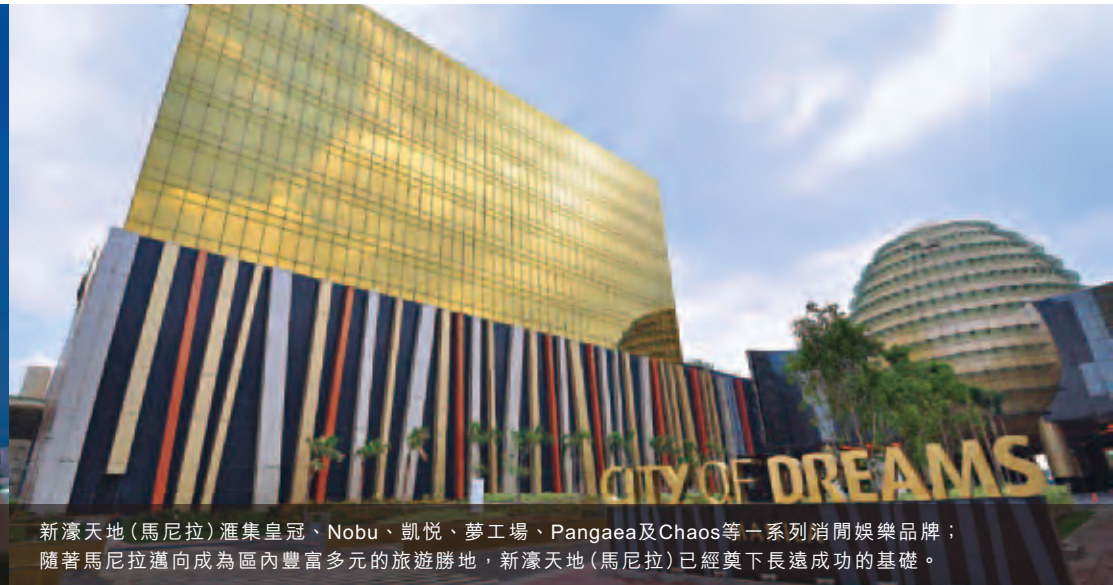
新濠天地（馬尼拉）滙集皇冠、Nobu、凱悅、夢工場、Pangaea及Chaos等一系列消閒娛樂品牌；隨著馬尼拉邁向成為區內豐富多元的旅遊勝地，新濠天地（馬尼拉）已經奠下長遠成功的基礎。