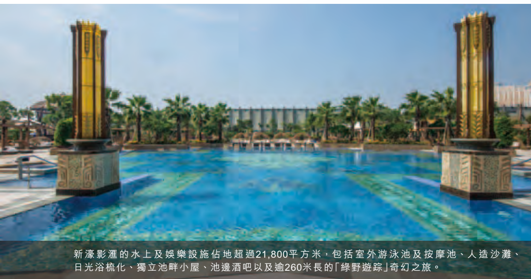
新濠影滙的水上及娛樂設施佔地超過21,800平方米，包括室外游泳池及按摩池、人造沙灘、日光浴梳化、獨立池畔小屋、池邊酒吧以及逾260米長的「綠野遊踪」奇幻之旅。

餐飲業務分類於截至二零一五年十二月三十一日止年度錄得虧損9,800,000港元，而二零一四年則錄得虧損5,000,000港元。虧損增加乃主要由於回顧年度之收益下降8.2%加上員工成本增加6.2%所致。