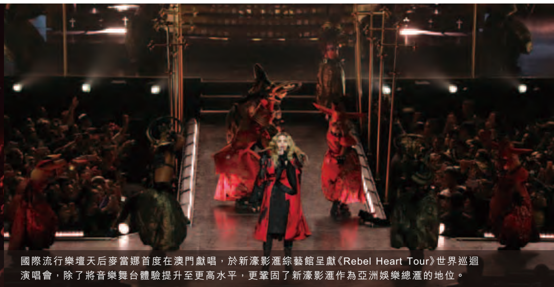
國際流行樂壇天后麥當娜首度在澳門獻唱，於新濠影滙綜藝館呈獻《Rebel Heart Tour》世界巡迴演唱會，除了將音樂舞台體驗提升至更高水平，更鞏固了新濠影滙作為亞洲娛樂總匯的地位。