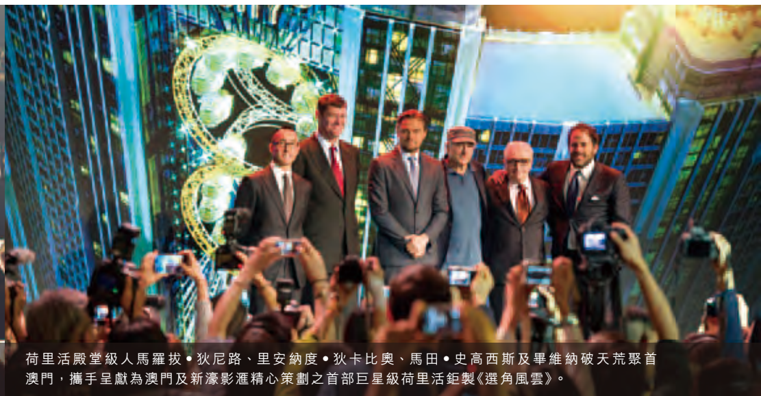
荷里活殿堂級人馬羅拔·狄尼路、里安納度·狄卡比奧、馬田·史高西斯及畢維納破天荒聚首澳門，攜手呈獻為澳門及新濠影滙精心策劃之首部巨星級荷里活鉅製《選角風雲》。