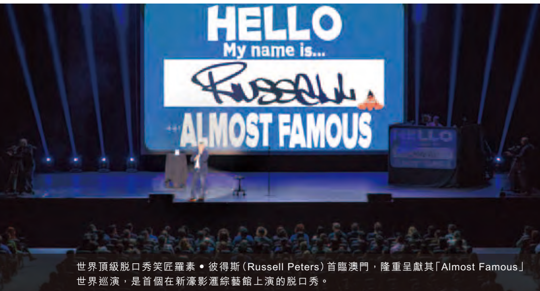
世界頂級脫口秀笑匠羅素·彼得斯（Russell Peters）首臨澳門，隆重呈獻其「Almost Famous」世界巡演，是首個在新濠影滙綜藝館上演的脫口秀。

本集團於二零一五年十二月三十一日持有Mountain China Resorts (Holding) Limited（「MCR」）的16.69%權益。MCR擁有及經營中國其中一個最著名的滑雪度假村－位於黑龍江省的亞布力陽光度假村（「亞布力度假村」）。