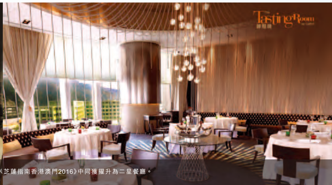
位於新濠天地的福布斯五星級餐廳——殿堂級粵菜食府「譽瓏軒」及當代法式料理餐廳「御膳房」在《米芝蓮指南香港澳門2016》中同獲擢升為二星餐廳。