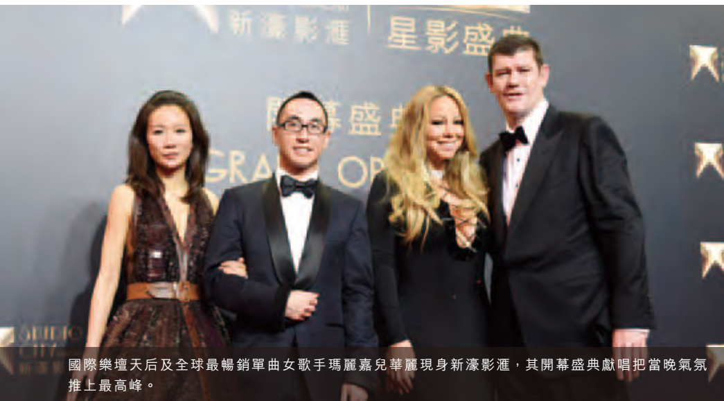
國際樂壇天后及全球最暢銷單曲女歌手瑪麗嘉兒華麗現身新濠影滙，其開幕盛典獻唱把當晚氣氛推上最高峰。

新濠影滙於第四季度隆重開幕，成功推動本集團在澳門的市場佔有率提升至歷史新高，同時進一步擴展更具盈利能力的中場分部及非博彩分部。新濠影滙提供的1,600間客房，比本集團現有項目提供的客房數目多逾一倍。自於二零一五年十月二十七