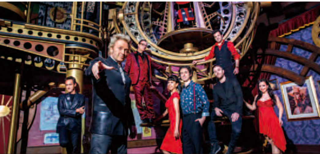
新濠影匯的「魔幻間」由舉世知名的魔幻大師法蘭茲·哈拉瑞(Franz Harary)精心打造，並雲集多位世界級頂尖魔術大師，為觀眾帶來亞洲前所未有的驚世魔幻旅程。

在亞洲其他地區方面，新濠繼續積極發掘潛在商機，豐富旗下業務組合，鞏固我們在全球博彩及娛樂行業的領先地位。本集團擁有位於俄羅斯海參崴附近的博彩及度假村發展項目「Tigre de Cristal水晶虎宮殿」的權益，該項目於二零一五年十一月十一日盛大開幕，深受市場歡迎。作為俄羅斯最大型的合法娛樂場，「Tigre de Cristal水晶虎宮殿」在該全新綜合娛樂區中掌握市場先驅的優勢，開拓華北、日本、韓國及俄羅斯市場，吸引亞洲各地以及俄羅斯國內的旅客到訪。此外，我們的附屬公司EGT亦已通過其角子機營運業務確立其在柬埔寨和菲律賓博彩市場的地位。新娛樂場開業所帶動的訂單增加以及提升生產效率的措施將繼續支持EGT的博彩產品業務。