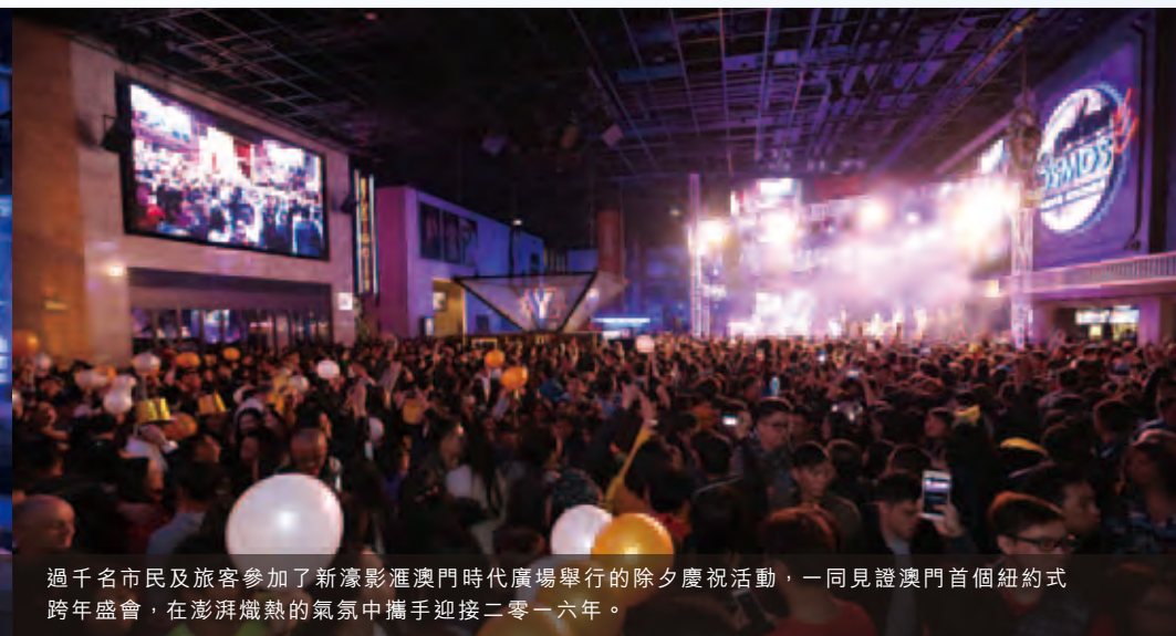
過千名市民及旅客參加了新濠影滙澳門時代廣場舉行的除夕慶祝活動，一同見證澳門首個紐約式跨年盛會，在澎湃熾熱的氣氛中攜手迎接二零一六年。