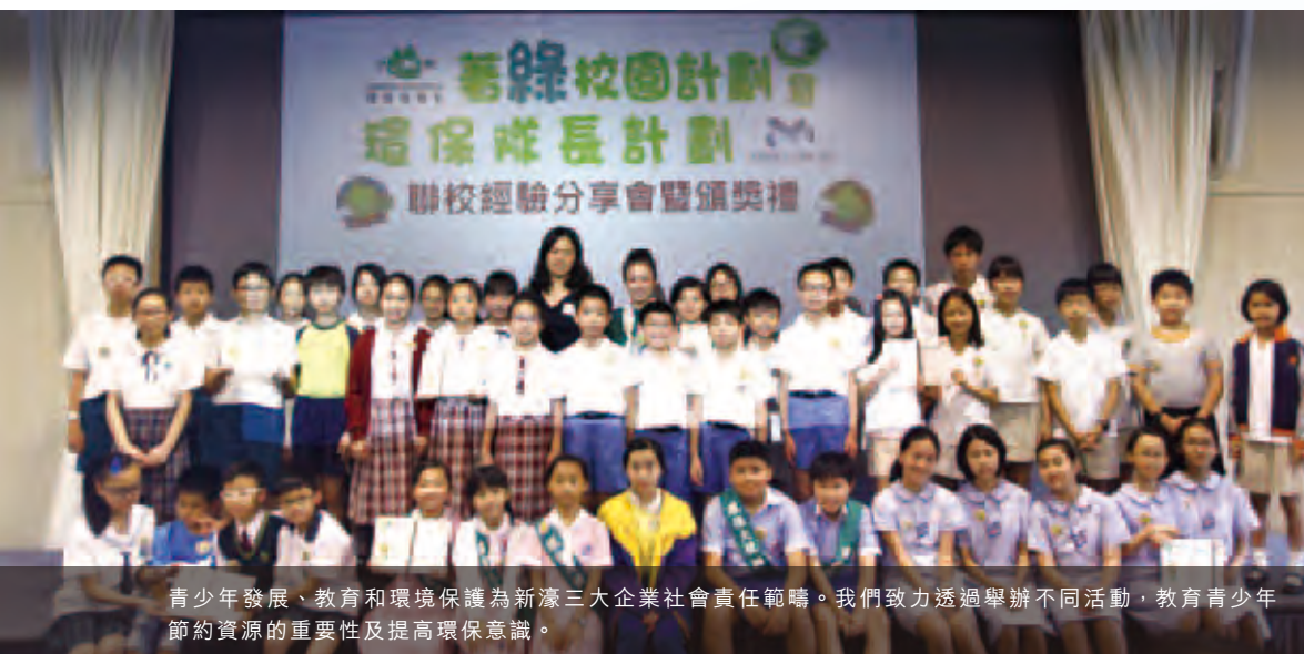
青少年發展、教育和環境保護為新濠三大企業社會責任範疇。我們致力透過舉辦不同活動，教育青少年節約資源的重要性及提高環保意識。

同時，本集團已將節能性高的LED燈廣泛應用於新濠天地室外及室內照明系統上。我們特別在後勤工作間選用市面上最節能的T5光管，並採用光感應器調節戶外燈光。