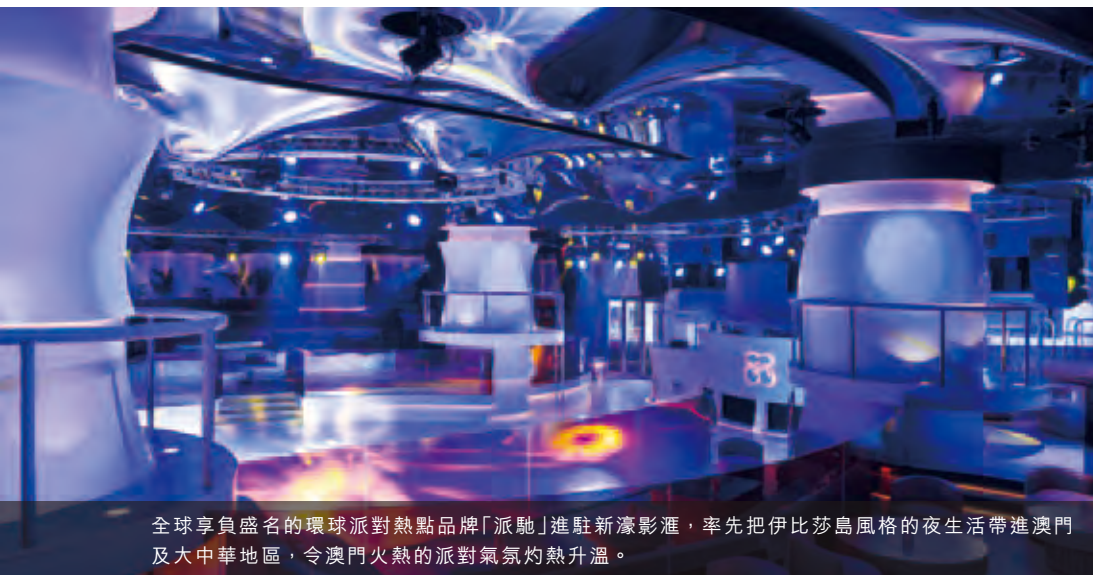
全球享負盛名的環球派對熱點品牌「派馳」進駐新濠影滙，率先把伊比莎島風格的夜生活帶進澳門及大中華地區，令澳門火熱的派對氣氛灼熱升溫。