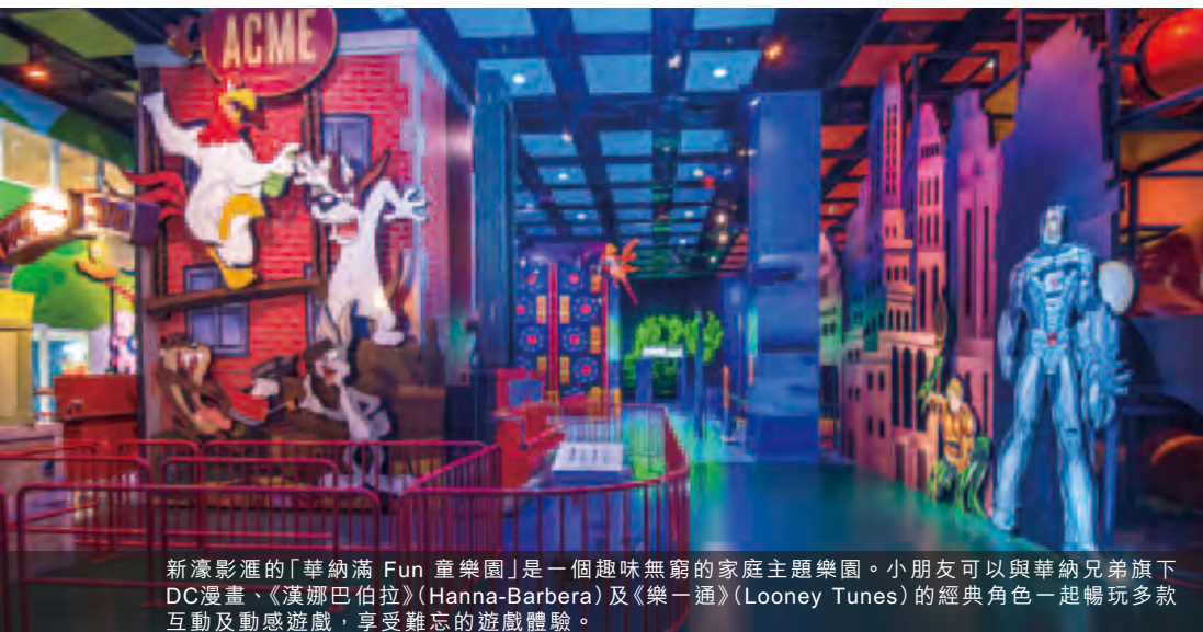
新濠影滙的「華納滿 Fun 童樂園」是一個趣味無窮的家庭主題樂園。小朋友可以與華納兄弟旗下DC漫畫、《漢娜巴伯拉》(Hanna-Barbera) 及《樂一通》(Looney Tunes) 的經典角色一起暢玩多款互動及動感遊戲，享受難忘的遊戲體驗。

儘管澳門博彩業於二零一六年仍面對挑戰，市場現已出現回穩的利好跡象。當中值得留意的包括二零一六年首兩個月的澳門博彩毛收入優於預期以及政府推出的新政策，如放寬中國居民以過境簽注赴澳的入境程序。這些新政策將有助長遠推動經濟多元