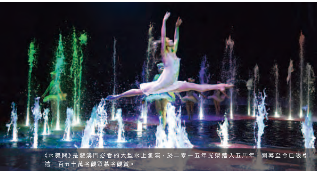
《水舞間》是遊澳門必看的大型水上滙演，於二零一五年光榮踏入五周年，開幕至今已吸引逾三百五十萬名觀眾慕名觀賞。

摩卡角子娛樂場截至二零一五年十二月三十一日止年度之淨收益合共為136,200,000美元，較截至二零一四年十二月三十一日止年度之147,400,000美元下跌。摩卡角子娛樂場於二零一五之經調整EBITDA為30,300,000美元，而上年度為36,300,000美元。於二零一五年第四季度，摩卡角子娛樂場經營的博彩機平均數目約為1,200台，而二零一四年同期則約為1,300台。摩卡角子娛樂場所滙報之博彩機數目減少，主要因為其中一個角子娛樂場於二零一五年改為經由澳門新濠鋒作滙報。二零一五年第四季度的每台博彩機每日的淨贏款為281美元，而二零一四年同期則為261美元。