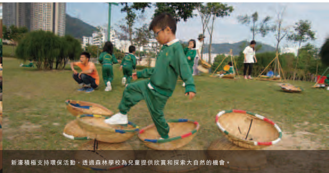
新濠積極支持環保活動，透過森林學校為兒童提供欣賞和探索大自然的機會。