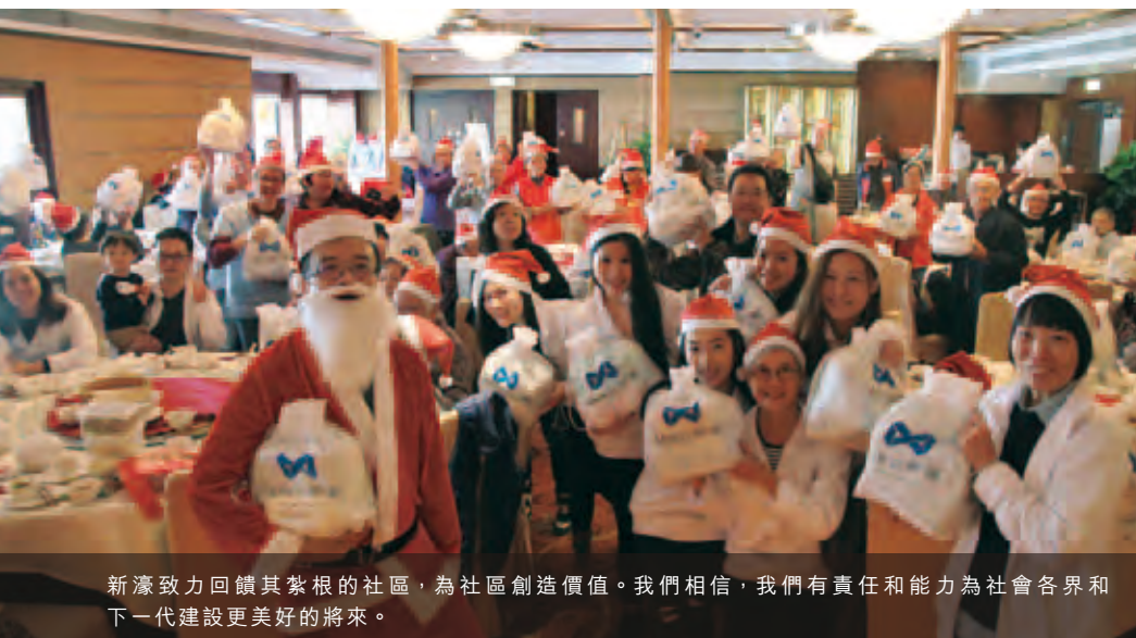
新濠致力回饋其紮根的社區，為社區創造價值。我們相信，我們有責任和能力為社會各界和下一代建設更美好的將來。

二零一五年，新濠繼續舉辦多項計劃，包括透過提供獎學金及其他援助鼓勵年輕人追求高等教育、為有濫藥問題的青少年提供培訓以協助他們重返社會，以及為問題賭博家庭提供機會重建親子關係。