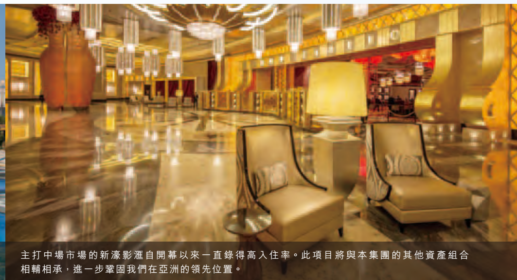
主打中場市場的新濠影滙自開幕以來一直錄得高入住率。此項目將與本集團的其他資產組合相輔相承，進一步鞏固我們在亞洲的領先位置。