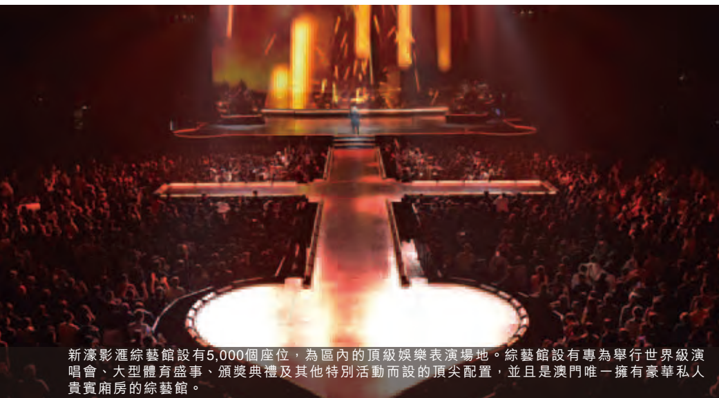
新濠影滙綜藝館設有5,000個座位，為區內的頂級娛樂表演場地。綜藝館設有專為舉行世界級演唱會、大型體育盛事、頒獎典禮及其他特別活動而設的頂尖配置，並且是澳門唯一擁有豪華私人貴賓廂房的綜藝館。

憑藉穩定的財務增長，博彩市場需求日增以及營運效率提升，預計EGT將成為本集團重要的收益來源。