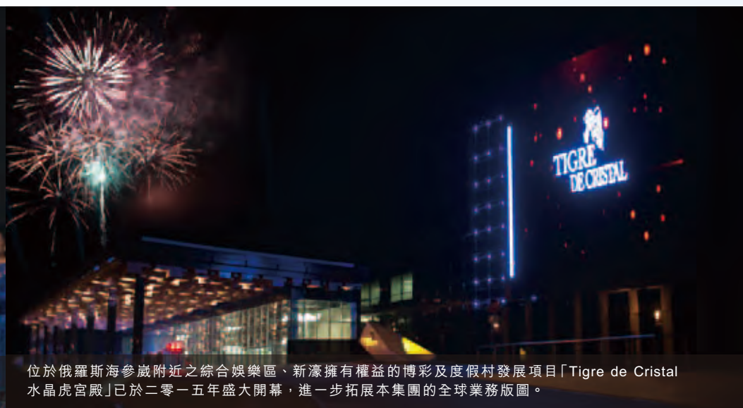
位於俄羅斯海參崴附近之綜合娛樂區、新濠擁有權益的博彩及度假村發展項目「Tigre de Cristal水晶虎宮殿」已於二零一五年盛大開幕，進一步拓展本集團的全球業務版圖。