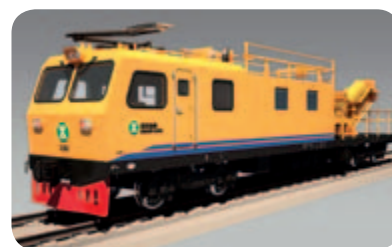
● 地鐵工程車再簽新訂單