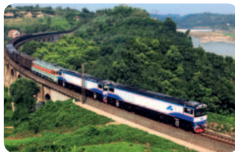
● 出口澳大利亞bradken公司的SDA1型機車