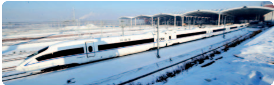
● 哈爾濱高寒動車組

概無本公司董事或其聯繫人或任何持有本公司5%以上股權的股東在上述供貨商或客戶中佔有任何權益。