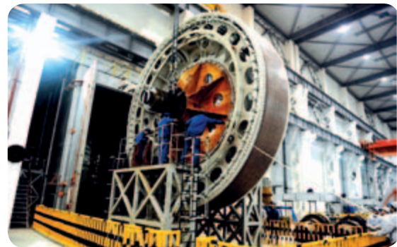
● 6MW直驅永磁同步風力發電機定子生產鏡頭

(四) 技術創新碩果累累 。產品研發取得一系列新成果。兩列時速350公里中國標準動車組型式試驗全面完成，各項技術性能表現優異，標誌著我國動車組研製步入了全面自主化、標準化的新階段。國內首條具有自主知識產權的中低速磁浮列車在長沙投入試運營。出口澳大利亞窄軌漏斗鐵路貨車被科技部評為國家重點新產品。技術創新能力得到新提高。獲准建設軌道交通車輛系統集成國家工程實驗室、大功率交流傳動電力機車系統集成國家重點實驗室、新型功率半導體器件國家重點實驗室，新增3家企業獲批建設國家級企業技術中心。高速列車全球創新中心、國家工業設計中心、磁懸浮列車技術研發中心建設取得積極進展。海外研發中心建設穩步推進，中德、中英、中美聯合研發中心相繼成立，海外研發中心達9個，統籌全球技術資源能力顯著增強。中國中車所屬有關企業作為「京滬高速鐵路工程」重要參加單位，榮獲國家科技進步特等獎。