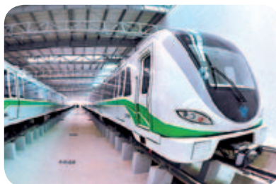
● 南寧首列地鐵交付