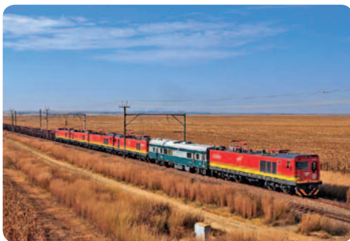
● 南非電力機車馳騁在非洲的原野上

城軌與城市基礎設施業務：抓住國家加快推進城鎮化建設、大力發展綠色公共交通的機遇，以提供城市軌道交通全鏈條系統解決方案為發展方向，以產融結合和產業轉型為發展路徑，延展城市軌道交通相關功能設施和城軌產業鏈，通過整合、併購、合資、合作等手段，發展信號、供電系統、運營等強相關業務，建立差異化的競爭優勢。