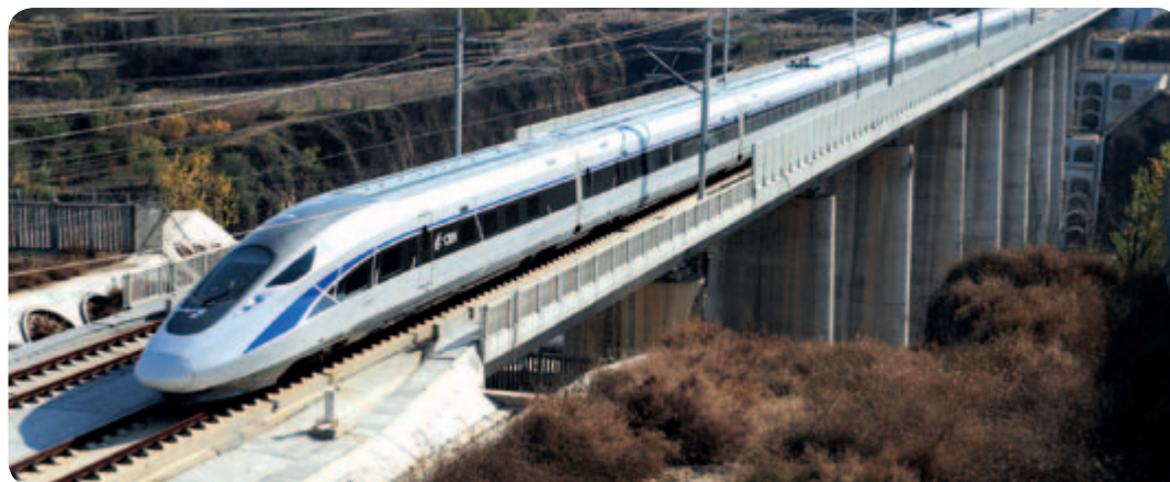
● 時速350公里中國標準動車組在大西線原平西至陽曲西段進行高速試驗

(五) 管理提升成績顯著。精心謀劃「十三五」規劃。深入分析全球競爭環境，組織召開戰略研討會和戰略務虛會，描繪出中國中車「十三五」發展藍圖。堅持融合與提升並重，持續深化精益示範區(線)、精益車間建設，精益體系框架初步形成，富有中車特色的精益管理體系已具雛形。突出效績考核導向，制定實施統一的企業效績評價考核辦法，初步構建高效的考核評價體系。人力資源管理體系日趨完善，人才的創新活力和創造激情不斷迸發。深入推進高技能人才隊伍建設，高技能人才隊伍不斷壯大，高技能人才佔比超過60%。