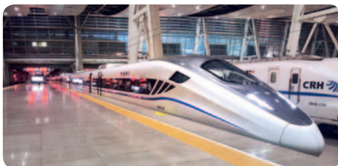
● 新型臥鋪動車組從北京南站準點駛出

公司營業收入比上年同期增長8.85%，鐵路裝備業務、城軌與城市基礎設施業務、新產業業務、現代服務業務分別佔總收入的54.48%，10.29%，22.09%，13.14%。其中鐵路裝備業務中機車業務收入32,361百萬元，銷售機車2,365台；客車業務收入10,227百萬元，銷售客車2,254輛；動車組業務收入76,824百萬元，銷售動車組3,782輛；貨車業務收入10,138百萬元，銷售貨車15,797輛。城軌地鐵收入22,485百萬元，銷售城軌地鐵4,024輛。