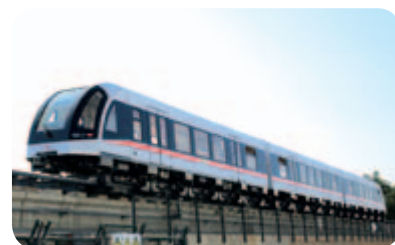
● 運行中的中低速磁懸浮列車