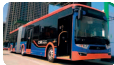
● 18米儲能式現代無軌電車