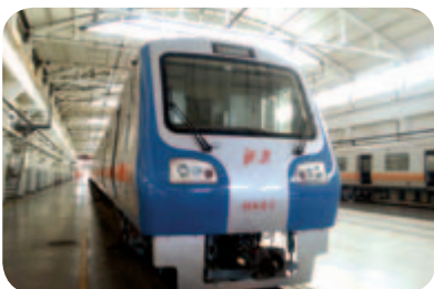
● 自主城軌核心系統“在京受閱”

由於單位產品的價值量較高，我們的銷售模式主要為參與招標或議標，通過投標或與客戶基於歷史價格進行溝通和商議後最終定價並獲得訂單。我們的銷售客戶主要為鐵路及城軌交通運營商。鐵路客戶分為路內客戶與路外客戶。路內客戶即鐵道部及下屬各鐵路局，為行業內最大的客戶，所以我們對鐵道部及下屬各鐵路局有較強的依賴性。路外客戶多為大型廠礦集團、港口等，需求量呈逐年上升趨勢，客戶較為分散，我們對其不存在過度依賴。城市軌道交通客戶為各城市軌道交通運營商。運營商數量逐年增加，客戶較為分散，我們對其也不存在過度依賴。截止二零一五年十二月三十一日止年度，我們約55.42%的產品銷售給前五大客戶。