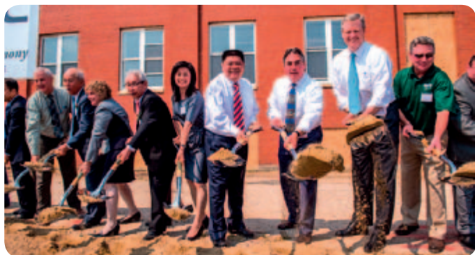
● 美國春田基地動工