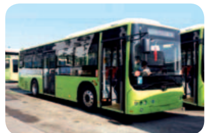
● 18台新能源客車開進中國大陸最南端