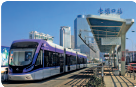
● 淮安儲能式現代有軌電車

(三) 經營模式探索創新 。以「戰略統領、業務主導、管理支持、面向全球」為目標，積極構建以業務開展為基本活動，以職能服務、區域管理為支持活動的運營模式，明確了領導班子成員的分工和總部各部室、各事業部職能，業務主導型運營模式初步建立，涵蓋總部、事業部、各子企業三個層級，業務、管理兩個維度的矩陣式管理架構逐步清晰。傳統產業積極轉型，各企業不斷深化與用戶的合作關係，延伸產品及服務鏈條，積極謀求新的業務增長點。新產業邁出堅實步伐，成功中標江蘇省常熟市村鎮污水處理項目，形成良好示範效應；新能源汽車、風力發電、環保裝備、高分子複合材料等新產業快速增長。資本運作穩妥推進。