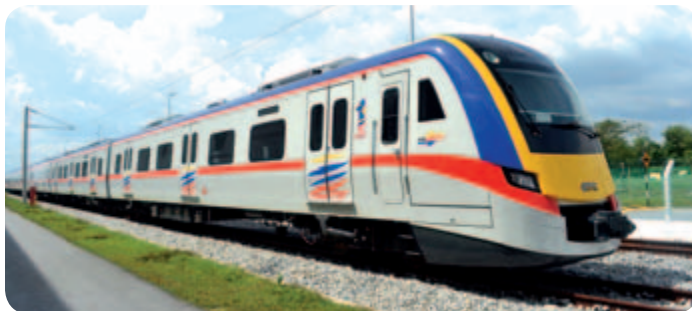
● 出口馬來西亞動車組

公司抓住國內城市軌道交通快速發展的良好機遇，圍繞「融合創新、協同發展」主題，拓展業務、強化管理，全力培育城軌業務整體競爭優勢，不斷拓展國內、國際城軌車輛市場。國內市場，以市場為主導、以客戶需求為目標，通過產品技術提升、全壽命週期服務為用戶提供系統解決方案，瞄準長三角、珠三角等地區重點區域，加強協調、強化管理，不斷拓展城軌市場獲取訂單能力和市場開發能力。深化商業模式創新，加強與地方政府的交流與合作，加大城軌工程市場開發力度，為進一步開拓工程總包市場奠定了堅實基礎。