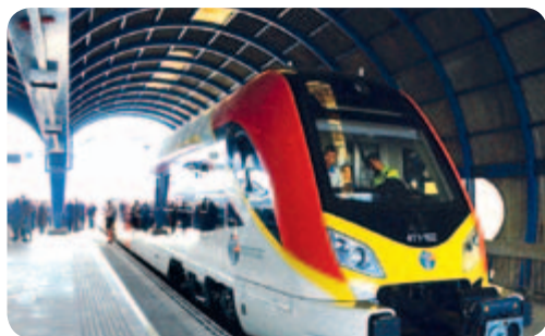
● “中國造”動車組首次在歐洲開跑

海外經營網絡佈局進一步加快。美國波士頓地鐵項目在春田市成功奠基。中國鐵路裝備首個海外製造基地在馬來西亞建成投產，成為「國際產能合作」的新亮點。與美國合資成立的貨車公司開始首批樣車生產，北美市場本地化翻開新的一頁。收購世界知名海工企業SMD公司，強勢進入高端深海機器人裝備產業，為培育和發展高端海洋工程裝備產業提供了重要支撐。將全球卓越橡膠企業BOGE公司納入旗下，跨國融合成效顯著。