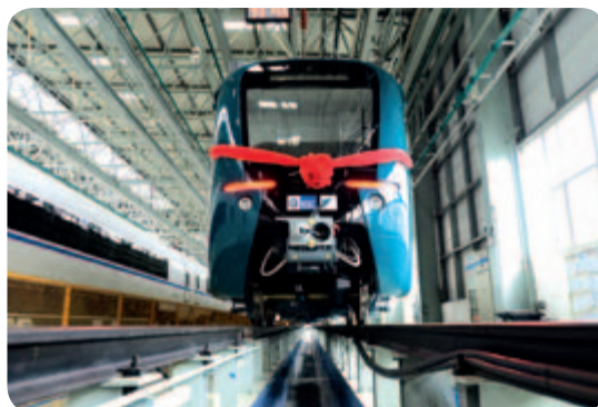
● 巴西里約奧運電動車組全部交付