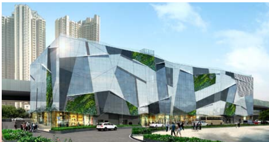
■ 位於新界沙田馬鞍山保泰街沙田市地段第 482 號之購物商場 — 地基工程已完成 (*)