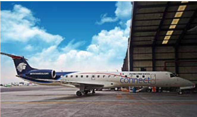
■ ERJ-145 型號 Embraer 飛機