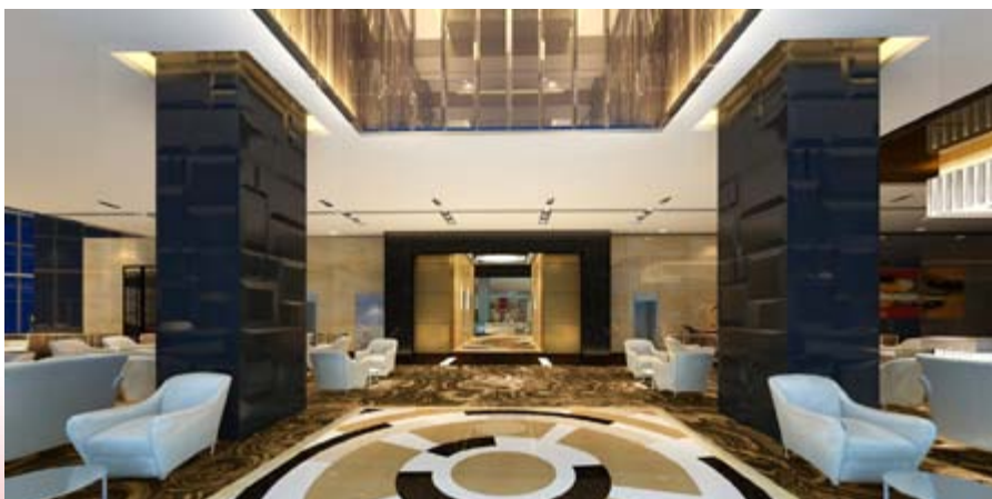
■ 富豪新都酒店大堂酒廊(*)