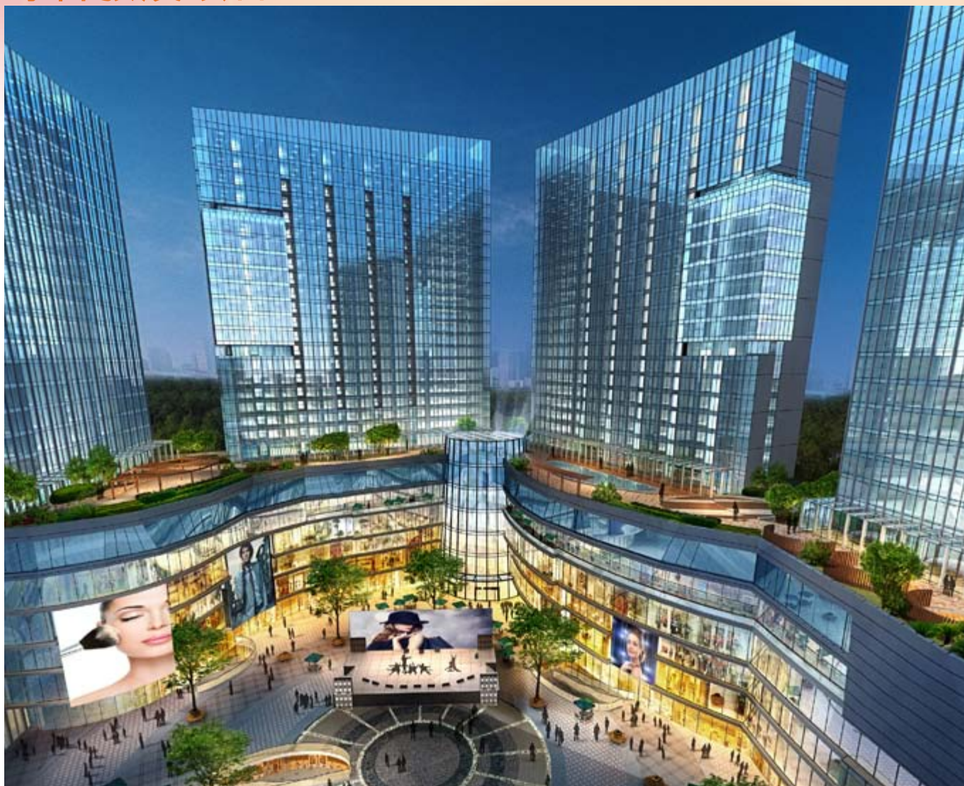
■ 位於四川成都新都區之綜合發展項目第一階段之購物商場及商務大樓(*)