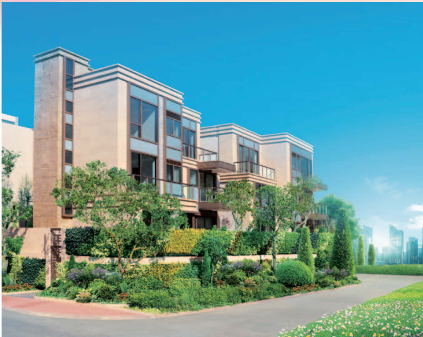
■ 位於新界元朗丹桂村路分界區 124 號地段第 4309 號之住宅發展項目內名為「富豪 • 悅庭」之花園洋房(*)/#