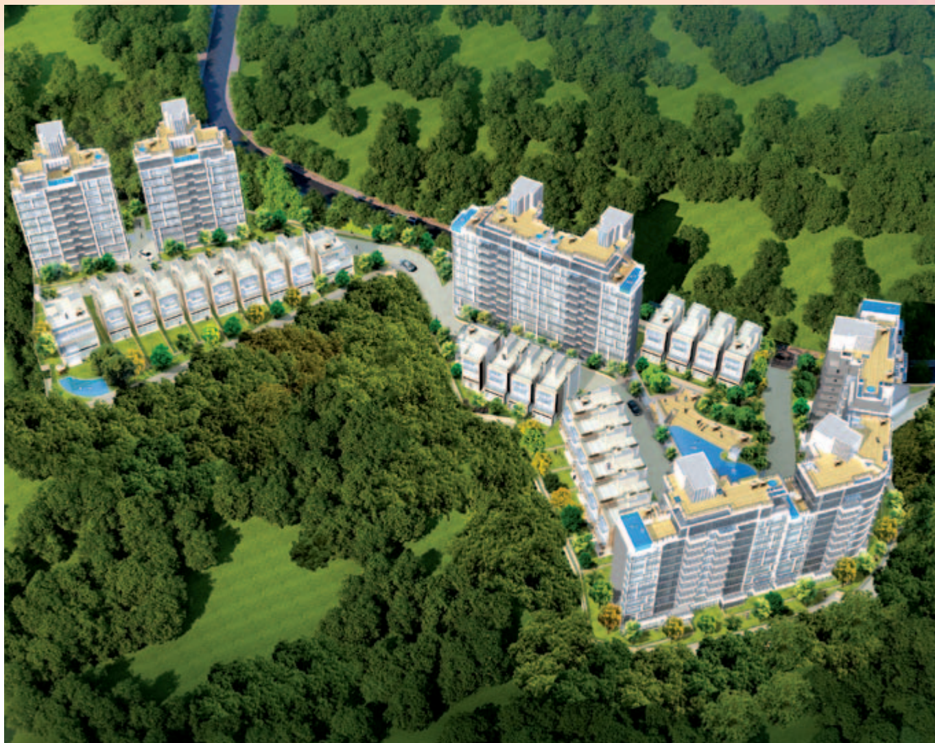
■ 位於新界沙田九肚第 56A 區沙田市地段第 578 號之豪華住宅發展項目 — 地基工程進行中 (*)