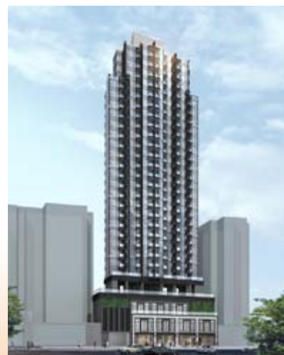
■ 位於九龍深水埗順寧道 69 至 83 號之商業 / 住宅發展項目 — 上蓋建築工程進行中 (*)