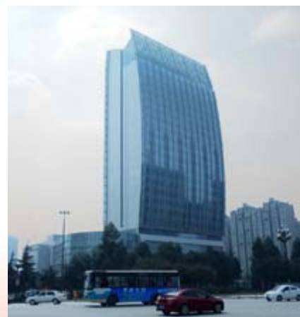
■ 綜合發展項目之第一階段之五星級酒店富豪新都酒店 — 上蓋工程已完成