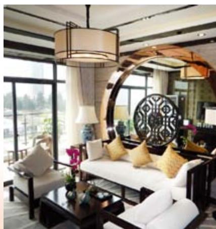
■ 綜合發展項目內住宅之現代中式風格示範單位