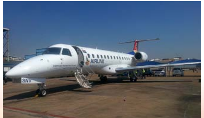
■ ERJ-135 型號 Embraer 飛機