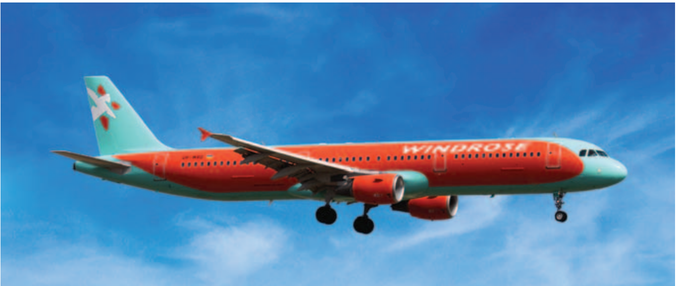
■ A321-211 型號空中巴士