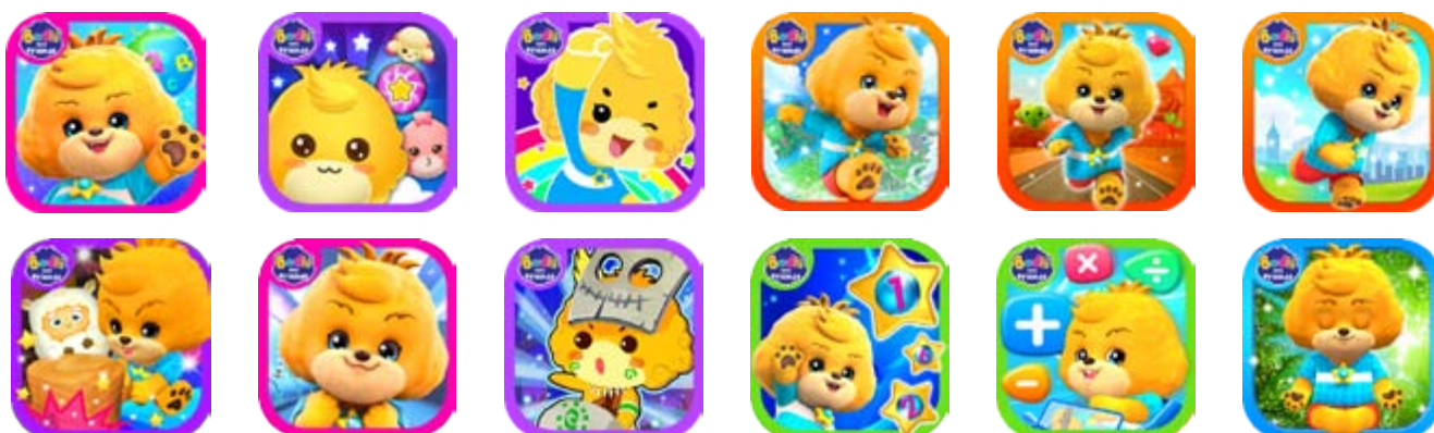
■ 寶狄與好友手機教學程式