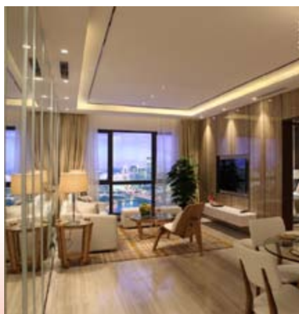
■ 綜合發展項目內住宅之現代西式風格示範單位