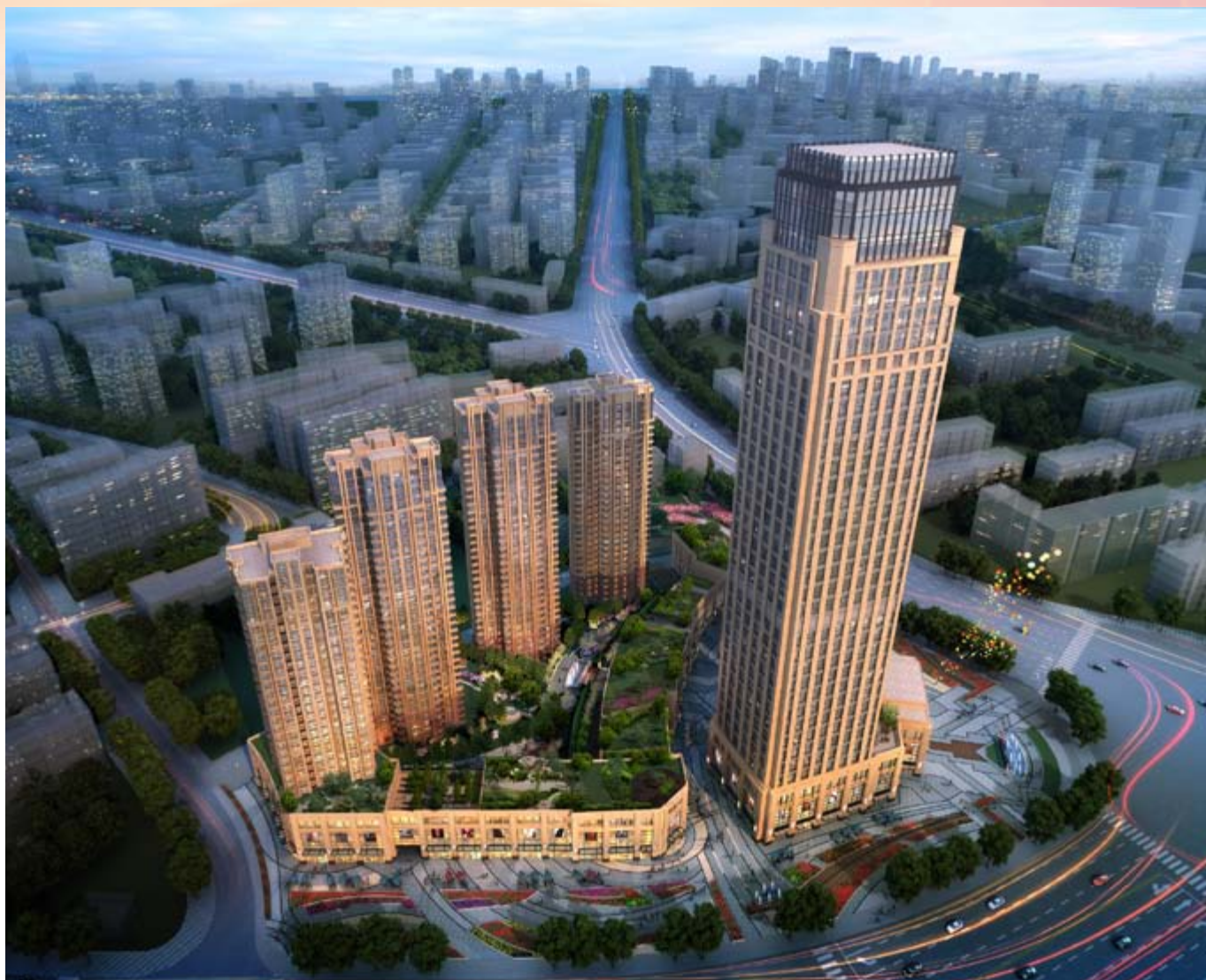
■ 位於天津河東區黃金地段之商業/寫字樓/住宅綜合發展項目(*)