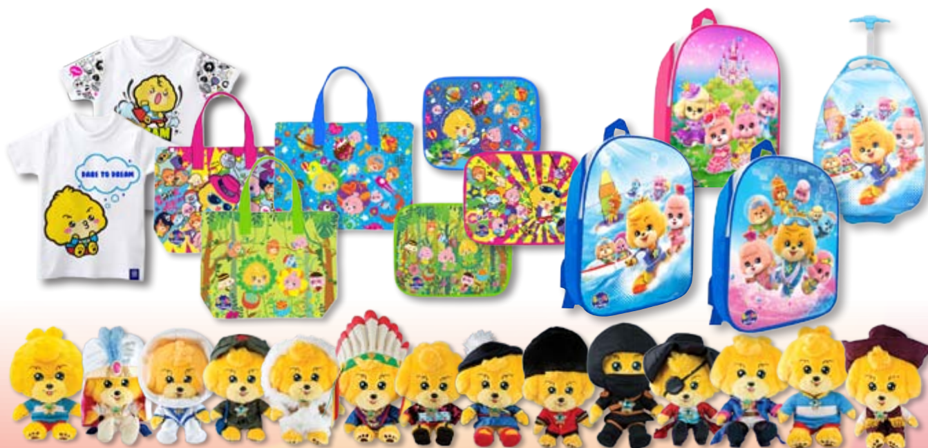
■ 寶狄與好友玩具及文具產品