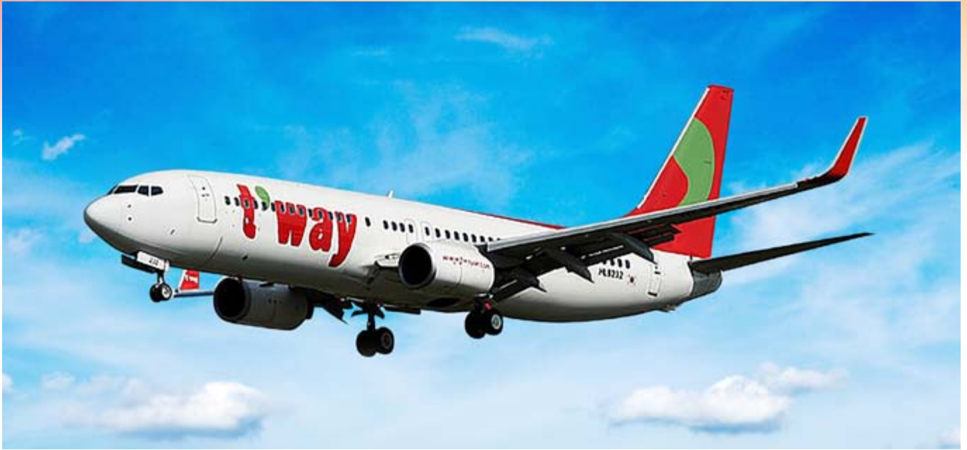
■ 波音 737-800 型號飛機