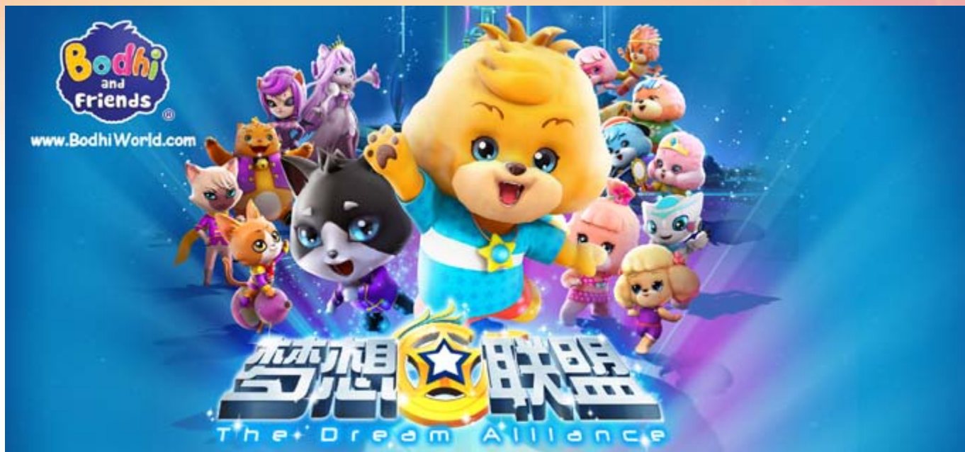
■ 寶狄與好友旗艦動畫系列