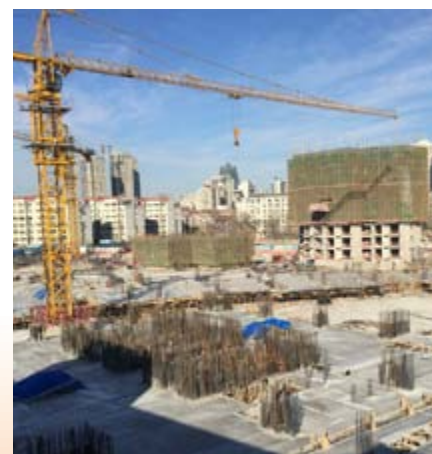
■ 綜合發展項目住宅大樓一上蓋工程進行中