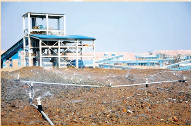
Muliashi項目堆浸系統1號堆場噴淋作業