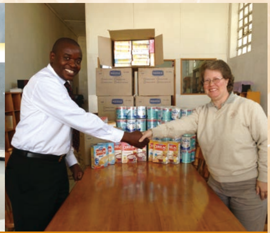
中色盧安夏向當地嬰 幼兒捐贈食品