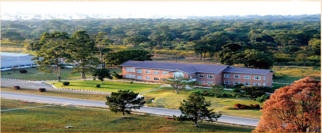
綠樹叢中的中色非洲礦業中心辦公樓

穆利亞希濕法項目和馬本德項目產能不斷擴大，穆利亞希南氧化礦項目投產。高鈷冰銅項目將於2016年完工，謙比希東南礦體探建結合項目正在進行大規模施工，隨著計劃中項目的完成，將為本集團未來的進一步業務發展奠定堅實基礎。