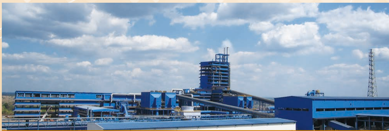
銅冶煉公司廠房全景

* 就轉包安排而言，這是指某一合同的一方，與合同之外的第三方所訂立的，內容涉及由第三方全部或部份履行原合同義務的安排。舉例而言，即指本集團在承包某項工程後，繼而將承包的工程轉讓或部份發包給第三方的情形。