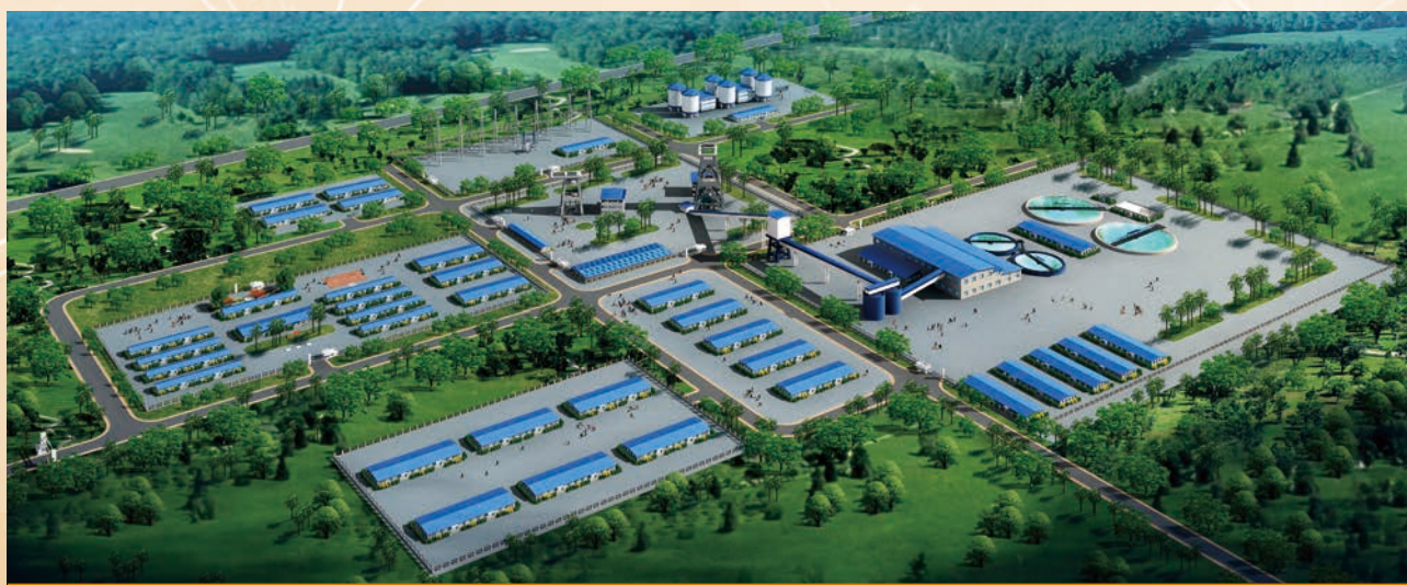
謙比希銅礦東南礦體採選工程鳥瞰圖