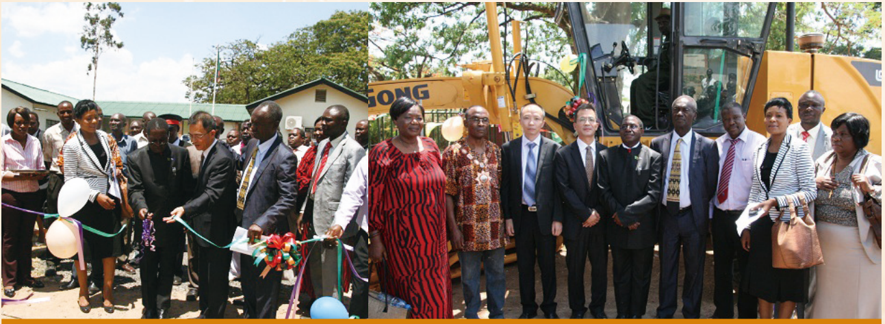
中色非洲礦業向當地市政廳捐贈平路工程車及建設圍牆

本集團始終堅持「發展企業，回報股東、員工和社會」的營業宗旨。2015年，本集團各附屬公司在做好發展、取得經濟效益的同時，嚴格遵守駐在國有關安全生產和環境保護等法律法規，在安全生產、環境保護、帶動當地經濟發展、提供就業崗位、參與當地公益事業等方面積極履行企業社會責任。