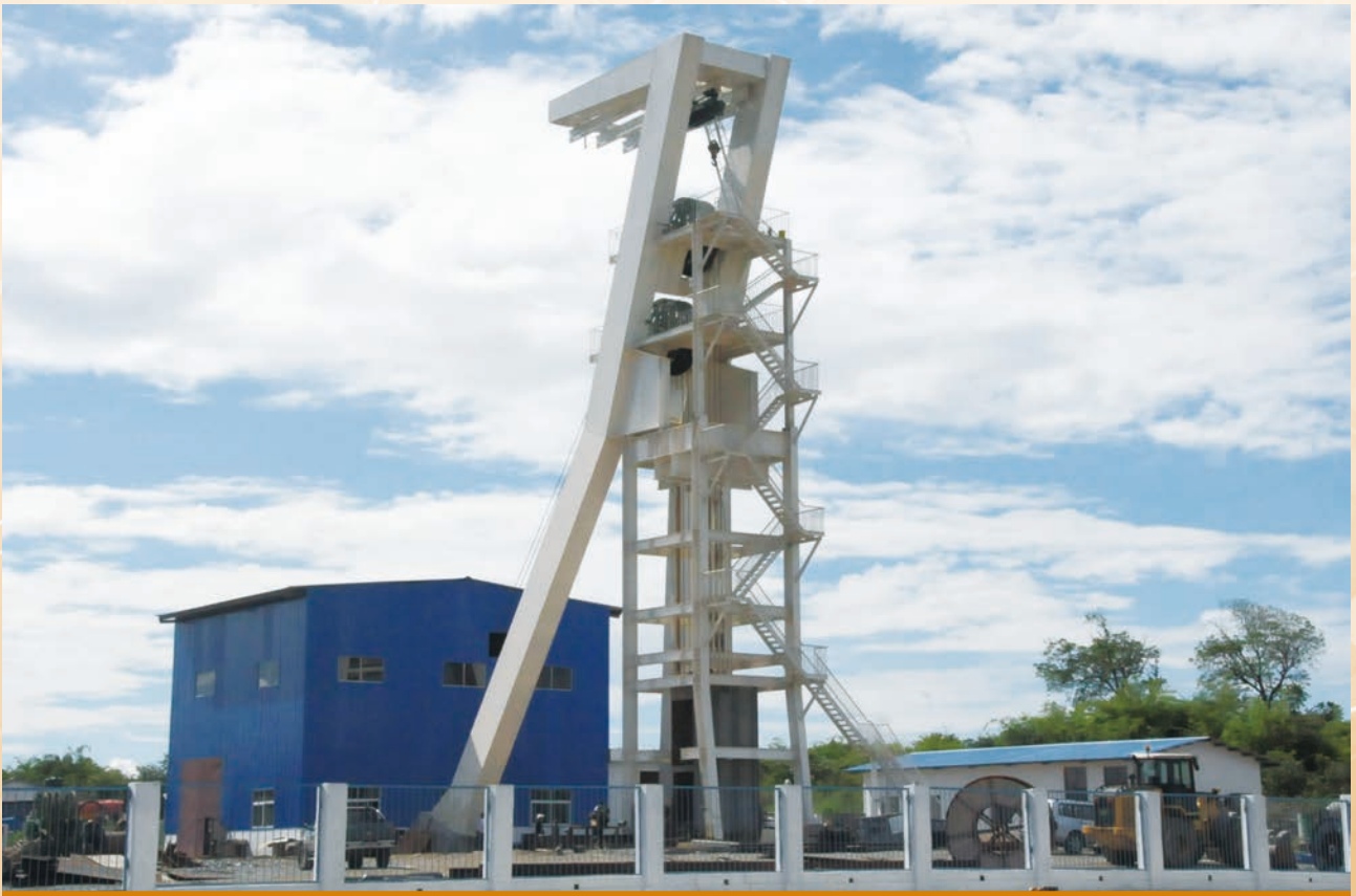
謙比希銅礦西礦體中央副井

正在開發中的謙比希東南礦體探建結合項目是本公司重點開發的礦山項目之一，設計年採選礦石330萬噸，年產銅精礦含銅約6.3萬噸。截止2015年底，豎井掘砌：主井掘砌累計進尺1,251米，完成掘砌56,070立方米／11,608立方米；副井掘砌累計進尺1,014米，完成掘砌55,989立方米／11,651立方米；南風井已掘砌到底，井深678米，完成掘砌28,681立方米／4,821立方米；北風井已掘砌到底，井深958米，完成掘砌38,468立方米／6,726立方米。平巷開拓：南風井560mL中段進尺1,004米，掘進14,700立方米；680mL及680mL以下開拓工程進尺3,283米，掘進45,294立方米；措施工程進尺589米，掘進