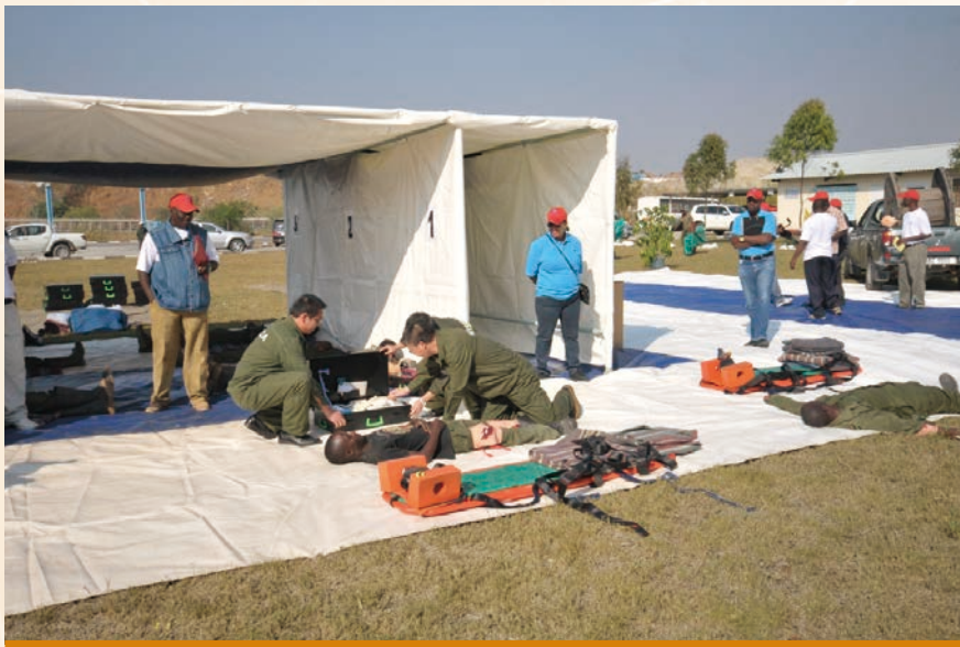
中色非洲礦業經理層參加礦山急救冶煉競賽

截至2015年12月31日止，本集團共聘有僱員6,690人(截至2014年12月31日：7,004人)，其中包括494名外籍員工及6,196名當地員工。本集團按照僱員之工作表現、經驗及當時之行業慣例釐定僱員薪酬。截至2015年12月31日止，反映在綜合損益及其他全面收益表中之僱員總成本約為79.4百萬美元(2014年：97.7百萬美元)。