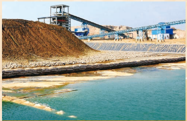
Muliashi項目噴淋後浸出液