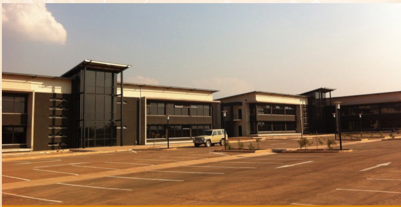
謙比希濕法治煉剛果(金)盧本巴希辦公區

公司網站為與投資者溝通最快捷的方式之一。資訊透過本集團網站 www.cnmcl.net 傳遞，作為對外界的溝通平台。本集團定期更新網站內容，發放本集團的最新資訊，讓外界可適時獲取有關資訊。此外，本集團亦會通過電郵、傳真及電話方式，及時回應股東、投資者、分析員及傳媒的各種查詢，並以發放公告、新聞稿及其他有關本集團動向的最新資訊，以加強資訊傳遞的有效性。