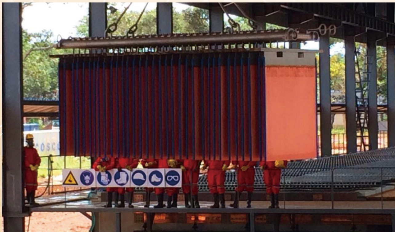
馬本德項目工人吊裝陰極銅產品(2014年3月生產第一批產品)

該項目規模為年處理5萬噸高鈷冰銅，年產銅精礦34,650噸(含銅39.07%)。該工程於2015年4月6日開工，截止2015年底主體結構全部完成，並完成大部份主體設備的安裝，預計2016年4月建成。項目總投資3,264萬美元，截止2015年12月底，累計完成投資877.62萬美元，完成總投資26.89%。