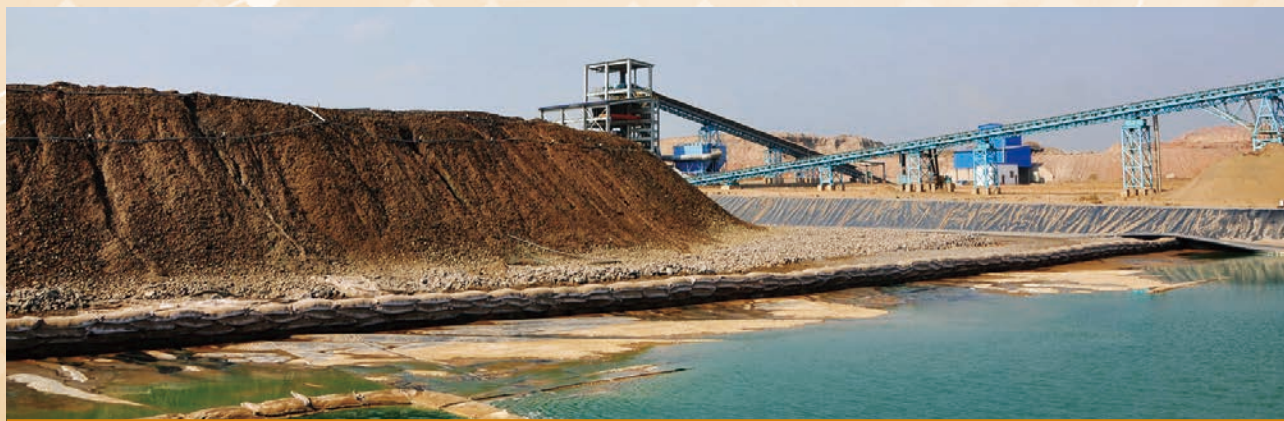
穆利亞希項目噴淋後浸出液