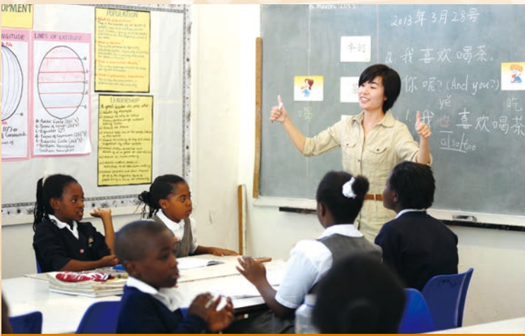
中色盧安夏信託學校志願者在教授中文