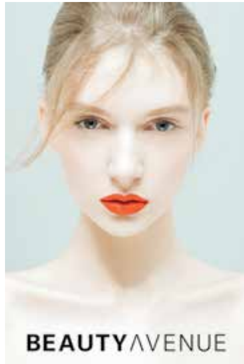
Cosmetics and beauty products at Beauty Avenue. 於「Beauty Avenue」的化妝及美容產品。

香港零售業不僅是面對著經濟放緩及從中國大陸或其他國家來港之高消費旅客人數下降，還正面對著極高成本之基礎，包括租金、推廣、以至員工薪酬等。此外，著名國際品牌亦重組其價格策略。尤其對本港零售影響深遠的，是日本之零售價格由傳統較香港昂貴減至現時與香港相約之水平。加上每當日圓減弱時，其零售價格可低於香港的百分之五至十，令其更能吸引旅客在日本消費。