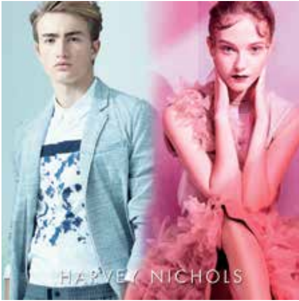
Fashion at Harvey Nichols. 於「Harvey Nichols」的時裝。