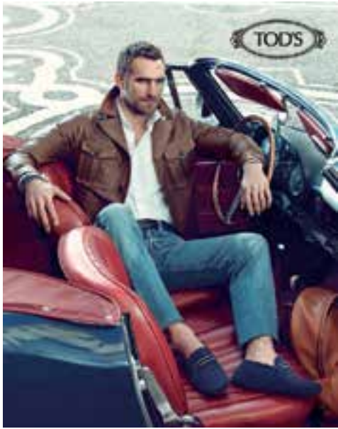
Shoes by Tod's. 「Tod's」鞋履。