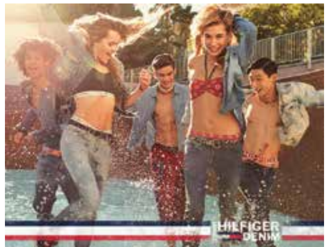
Fashionwear by Tommy Hilfiger Denim. 「Tommy Hilfiger Denim」時裝。