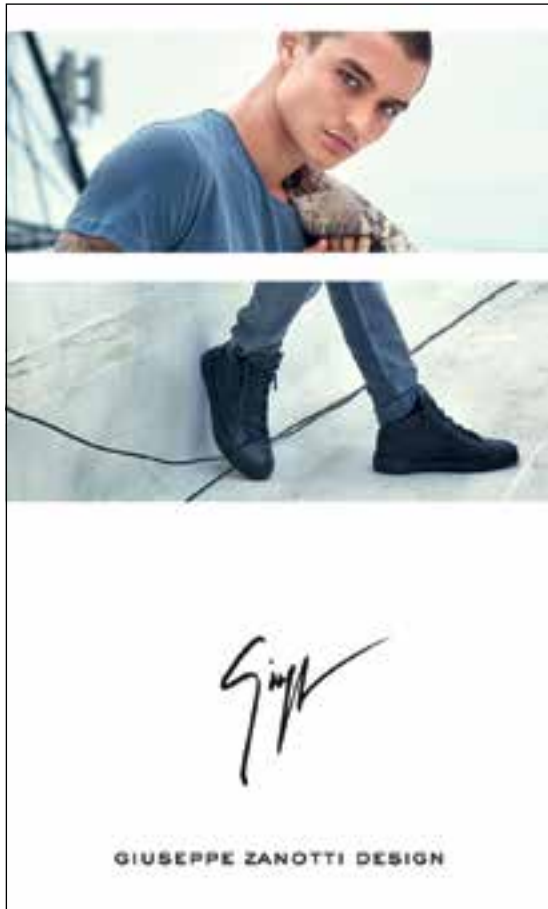
Shoes by Giuseppe Zanotti Design. 「Giuseppe Zanotti Design」鞋履。