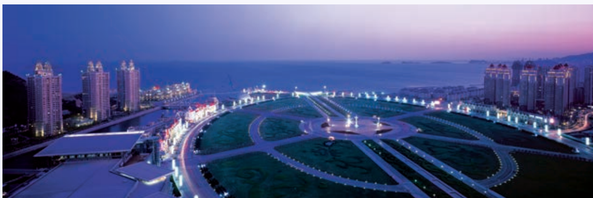
大連沿海國際中心上層鳥瞰圖