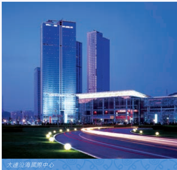
大連沿海國際中心