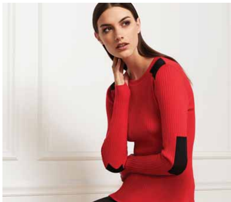
JONES NEW YORK