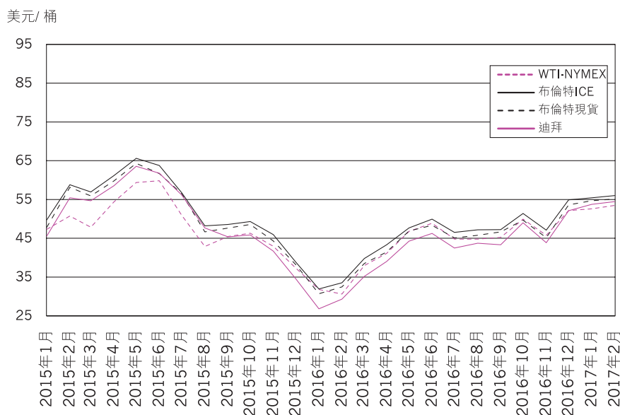
國際原油價格變化走勢圖

2016年國際原油價格觸底反彈，震盪攀升，但總體保持低位。普氏布倫特原油現貨價格全年平均為43.69美元／桶，同比降低16.7%。