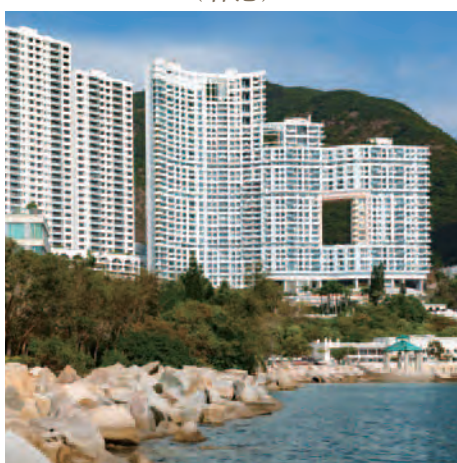
淺水灣影灣園 (香港)