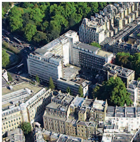
總樓面面積：246,192平方呎 | 擁有權：100%