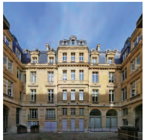
總樓面面積：43,163平方呎 | 擁有權：100%