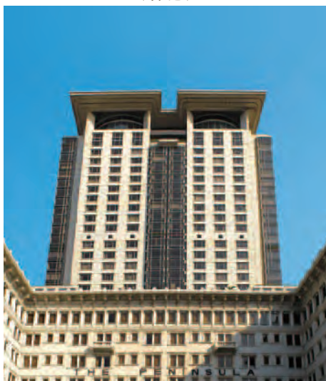
半島辦公大樓 (香港)