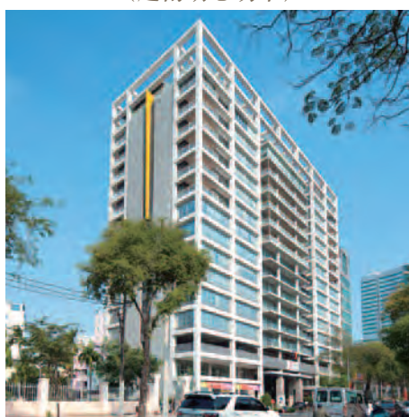
The Landmark (越南胡志明市)