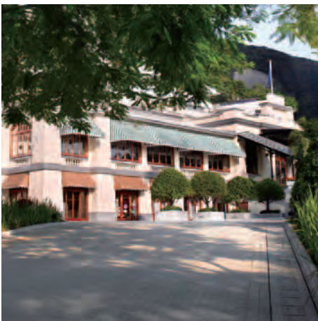
總樓面面積：62,909平方呎 | 擁有權：100%