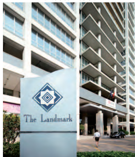
The Landmark (越南胡志明市)