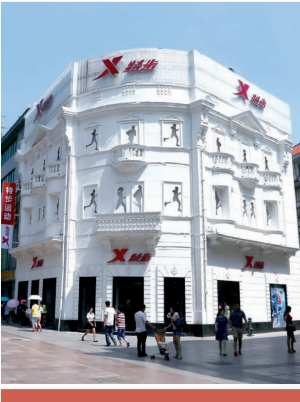
特步店鋪，位於湖北省武漢

本集團繼續強調有效的零售渠道管理乃成功的關鍵。扁平化的分銷渠道及精細化的店鋪管理使整體經營效率及盈利能力大大提高。本集團根據從集團的分銷資源系統收集所得的實時數據，制定了控制存貨、統一店鋪形象和產品定價的詳細指引。分銷資源系統現已覆蓋超過90%的特步零售店，數據通過手機應用程式傳送至各級零售員工，員工可藉此監控、分析並迅速應對零售數據，帶來店鋪銷售效益的提高。過去三年對優化渠道管理扁平化的過程，使店鋪更為標準化、零售店及分銷商能作出更迅速反應、渠道存貨水平亦能控制於指引水平內。我們戰略性地增加了分銷商直接管理的零售店的比例，減少多層銷售，未來年度亦會繼續沿用此戰略。