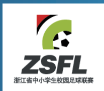
浙江省中小學生校園足球聯賽 (自2010年起贊助)