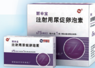
注射用尿促卵泡素 用於不排卵且對枸橼酸克羅米芬治療無效者以及輔助生殖技術超促排卵者。