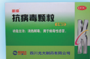
抗病毒顆粒 清熱解毒。用於病毒性感冒。