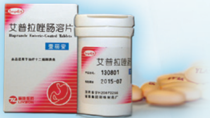
艾普拉唑腸溶片 用於治療十二指腸潰瘍。

本年度內，本集團的主營業務未發生變化，以醫藥產品的研發、生產及銷售為主業，產品涵蓋製劑產品、原料藥和中間體及診斷試劑及設備，主要產品包括參芪扶正注射液、麗珠得樂（枸橼酸鉍鉀）系列產品、抗病毒顆粒、麗申寶（注射用尿促卵泡素）、樂寶得（注射用尿促性素）、壹麗安（艾普拉唑腸溶片）、麗福康（注射用伏立康唑）、麗康樂（注射用鼠神經生長因子）及貝依（注射用亮丙瑞林微球）等中西藥製劑；美伐他汀、硫酸粘菌素、苯丙氨酸及頭孢曲松鈉等原料藥和中間體；HIV抗體診斷試劑、肺炎支原體抗體診斷試劑（被動凝聚法）及梅毒旋轉體抗體診斷試劑（凝聚法）等診斷試劑產品。