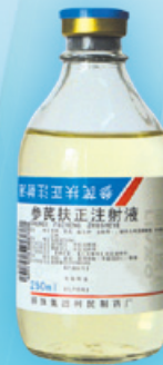
參芪扶正注射液 益氣扶正。用於氣虛證肺癌、胃癌的輔助治療。