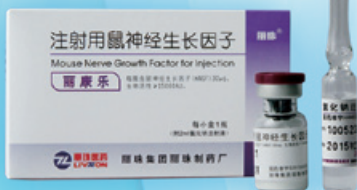
注射用鼠神經生長因子 用於治療視神經損傷。