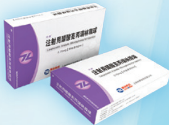
注射用醋酸亮丙瑞林微球 子宮內膜異位症；子宮肌瘤。