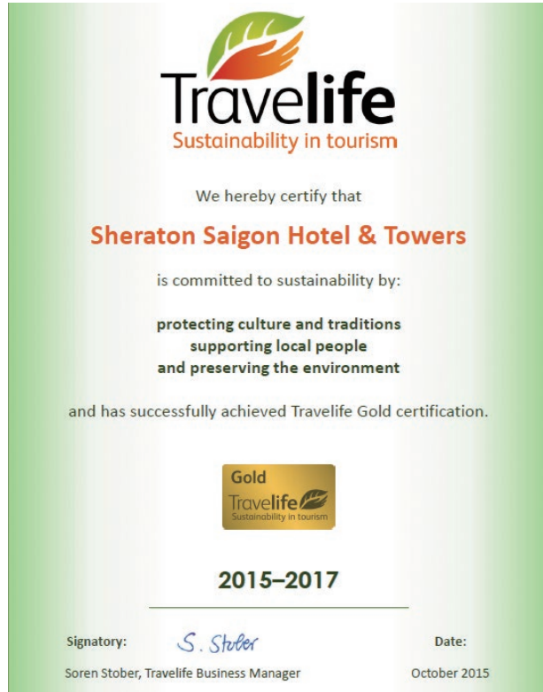
Travelife Gold Certification Travelife 金牌證書