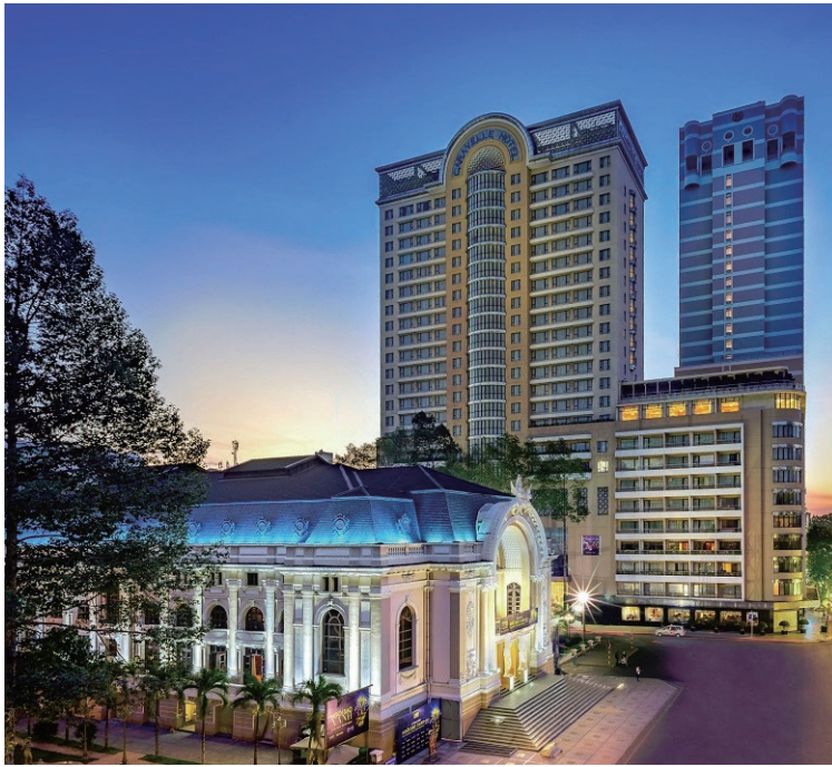
Caravelle Saigon, Vietnam 越南西貢帆船酒店