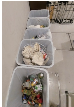
Best Western HotelFino Shinsaibashi, Japan – Recycling Initiatives in the office 日本大阪心齋橋 西佳酒店 – 辦公室廢物分類循環