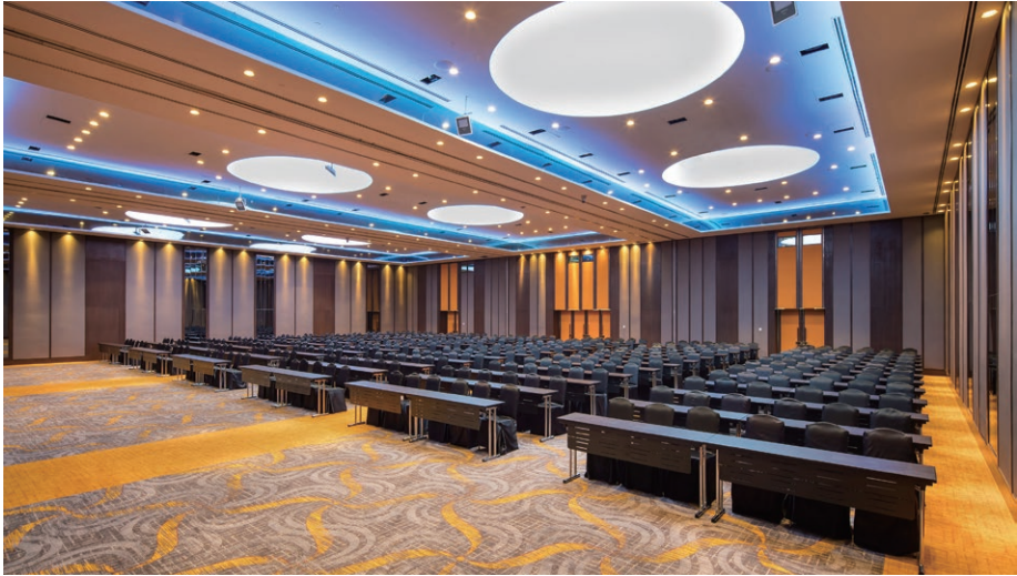
Grand Ballroom 宴會廳