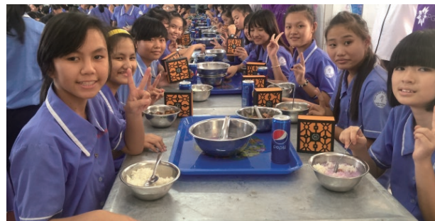
Charity Trip to Binh Duong Deaf School 平陽聾啞學校之慈善日