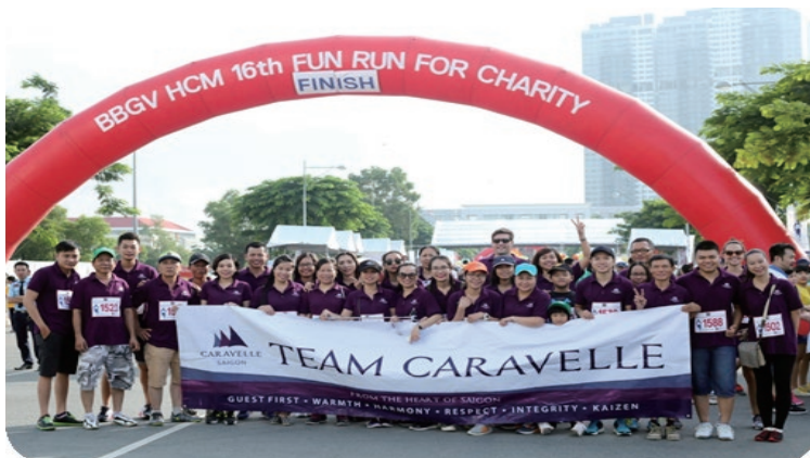
BBGV Fun Run contributes to a wide range of charitable projects BBGV 樂跑贊助一系列廣泛的慈善項目