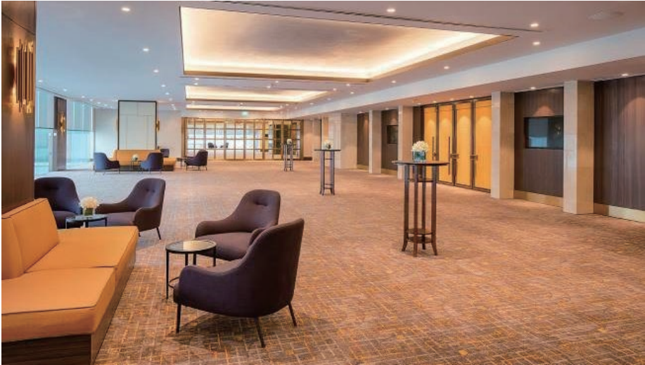
Pre-function Hall 會議迎賓區