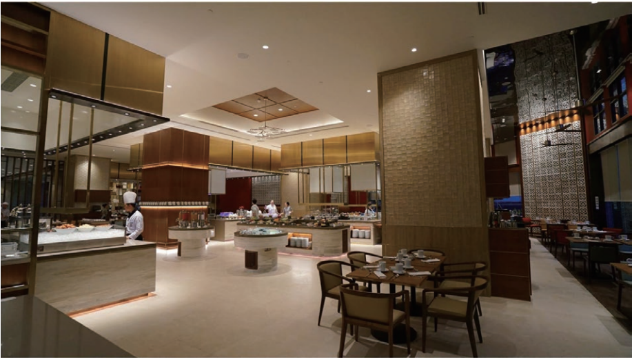
Saigon Cafe 咖啡廳