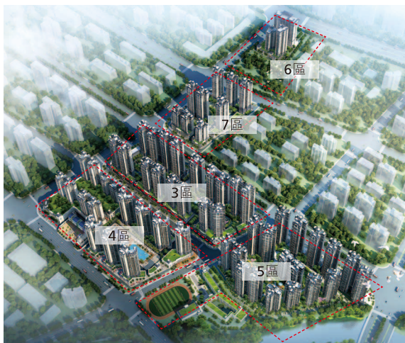
南寧天譽花園—效果圖