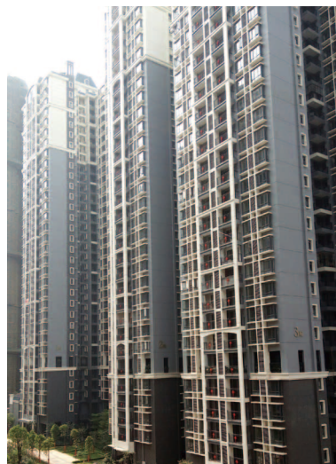
南寧天譽花園3區1-3座

於本報告日期，全部5個區域均在施工中，在合共65幢大樓中已有56幢大樓封頂，及5幢公寓(可售面積約78,000平方米)已竣工。物業預定於二零一六年末至二零一八年分期交付。可售面積約623,000平方米的第3、4及5區物業單位已推出市場預售。截至二零一七年三月二十五日，預售住宅單位的合同銷售金額合共約人民幣36億元(可售面積約567,000平方米，代表佔已開售住宅面積95.4%)。於二零一六年，已交付予買家的合計可售建築面積約為51,000平方米。此外，已從政府收取回建房銷售所得款項合共人民幣993,200,000元，將交付予原居民的合計可售面積為245,000平方米。