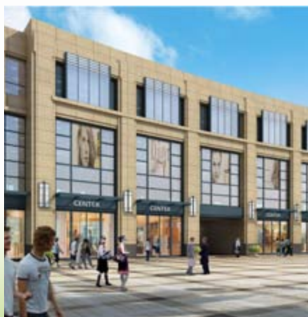
■ 富豪貓步天街 — 富豪新開門之購物步行街(*)