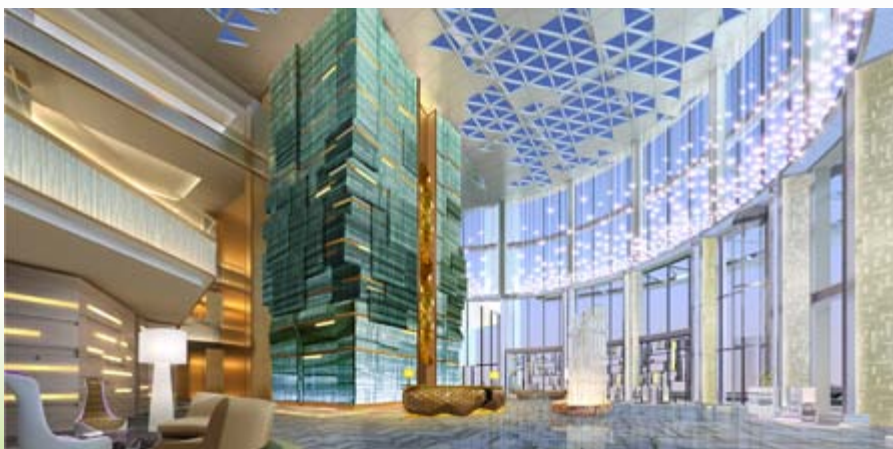
■ 富豪國際新都薈之富豪新都酒店的大堂(*)