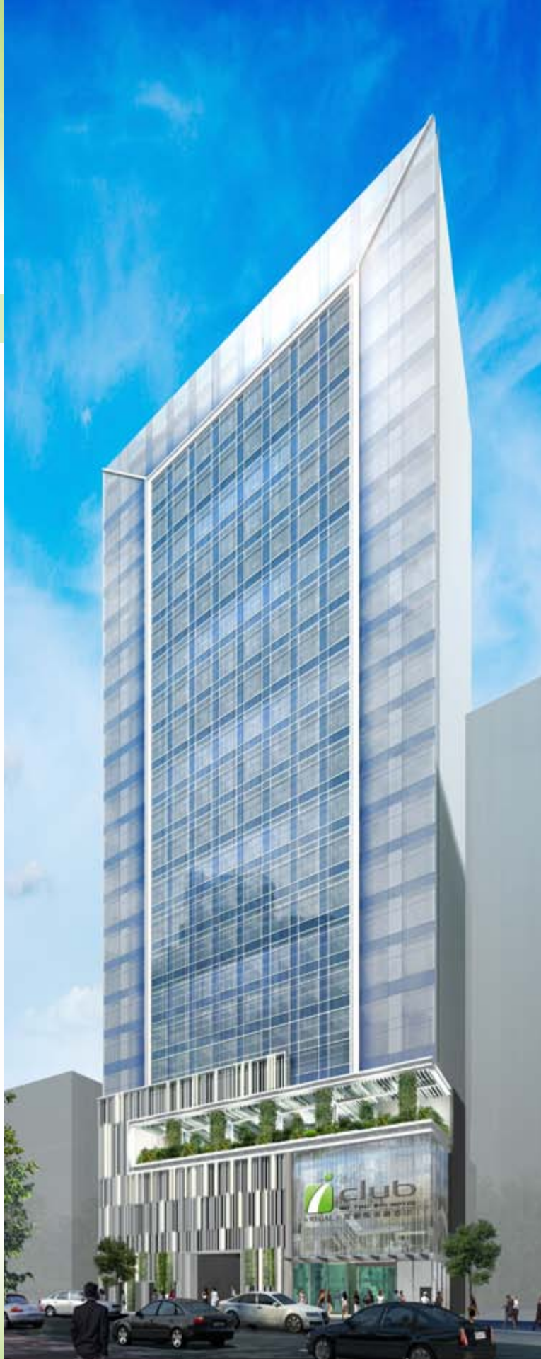
■ 位於九龍土瓜灣下鄉道8、8A、10、10A、12及12A號之富薈馬頭圍酒店 — 入伙紙已獲發出(*)