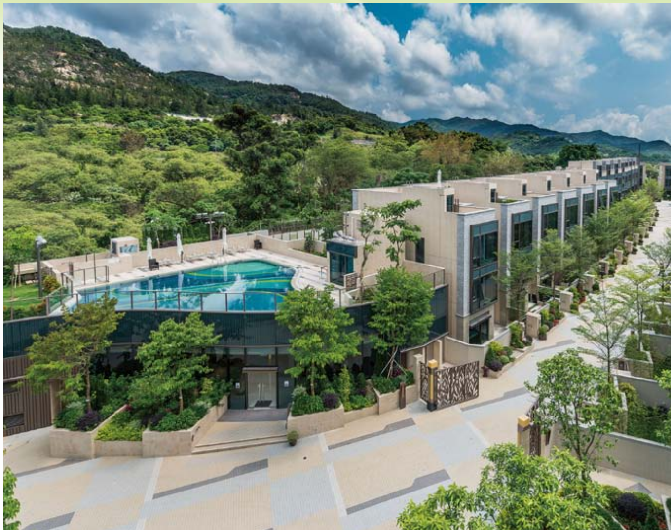
■ 富豪•悦庭 — 位於新界元朗丹桂村路65至89號之住宅發展項目之花園洋房