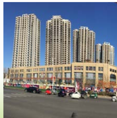
■ 富豪新開門之住宅及商業部分(*)