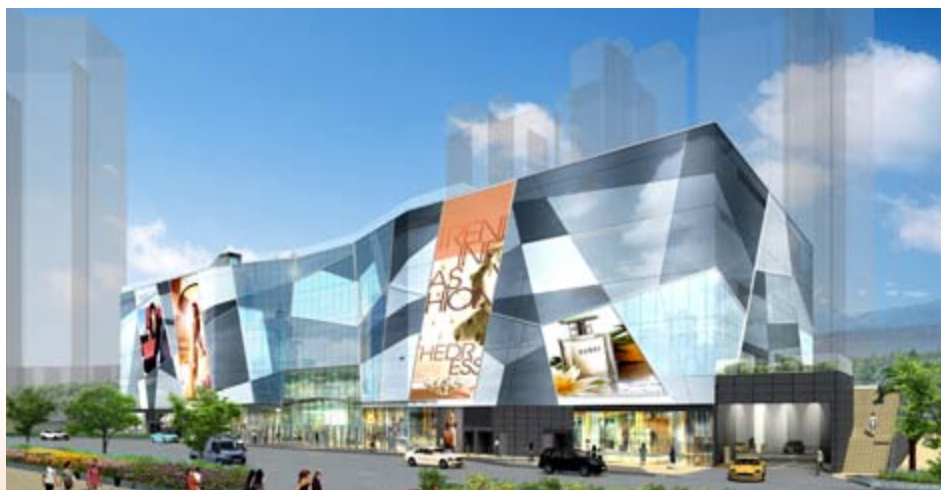
■ 位於新界沙田馬鞍山保泰街沙田市地段第482號之購物商場 — 上蓋建築工程接近完成(*)