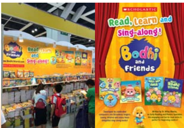
■ 樂學書籍登陸香港