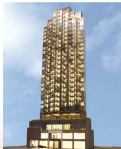
■ 尚都 — 位於九龍深水埗順寧道83號之商業/住宅發展項目 — 上蓋建築工程進行中(*)