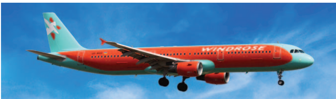
■ A321-211 型號空中巴士