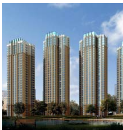
■ 富豪新開門之住宅大樓 — 上蓋工程接近完成 (*)