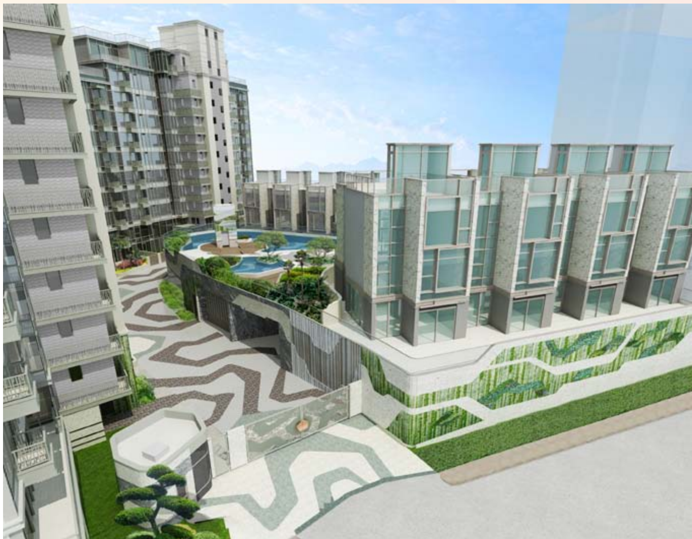
■ 位於新界沙田九肚第56A區沙田市地段第578號之豪華住宅發展項目 — 上蓋建築工程進行中(*)