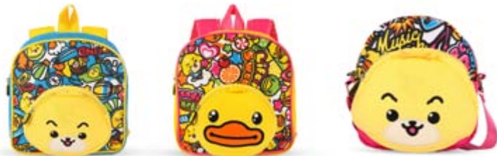
■ 與小黃鴨戰略合作