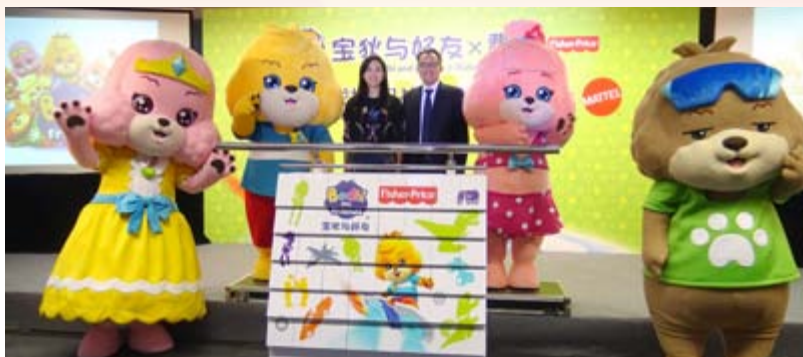
■「寶狄與好友」x「費雪」全球授權戰略合作發佈會