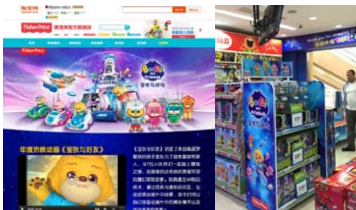
■ 寶狄與好友玩具登陸天貓費雪牌官方旗艦店及其他連鎖玩具店