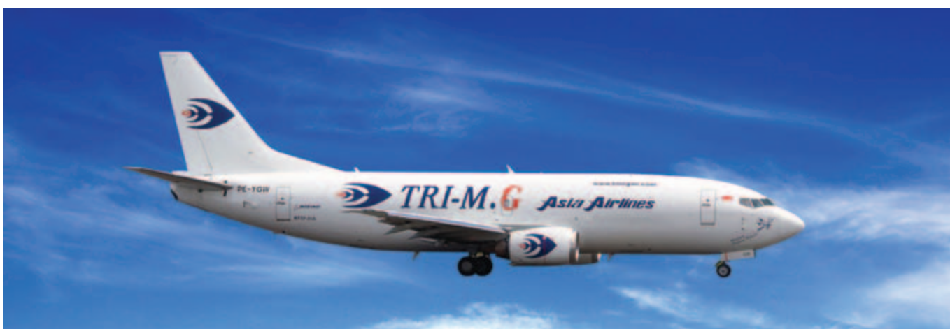
■ 波音 737-33A(SF) 型號飛機