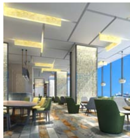
■ 富豪新都酒店大堂酒廊 (*)