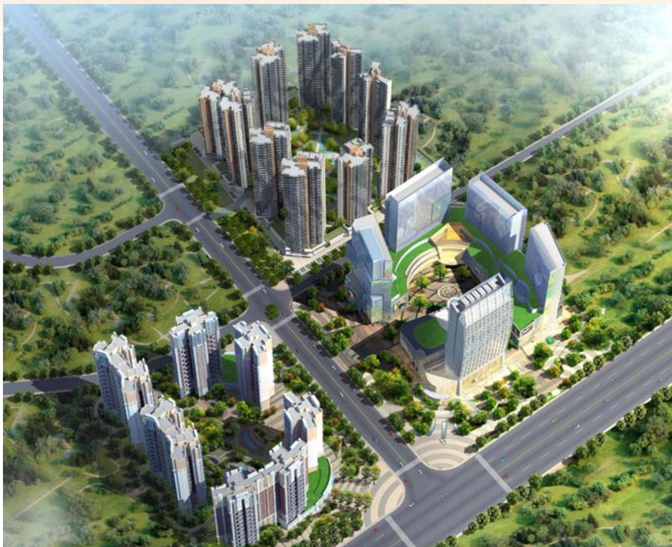
■ 富豪國際新都薈 — 位於四川成都新都區之酒店 / 商業 / 寫字樓 / 服務式公寓 / 住宅綜合發展項目 (*)