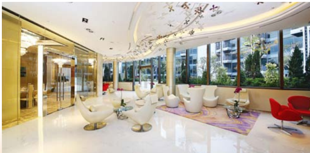
■ 丹桂村路發展項目「富豪 • 悦庭」及「尚築」之會所