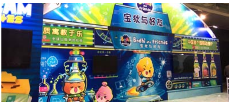
■ 於上海「中國授權展」參展