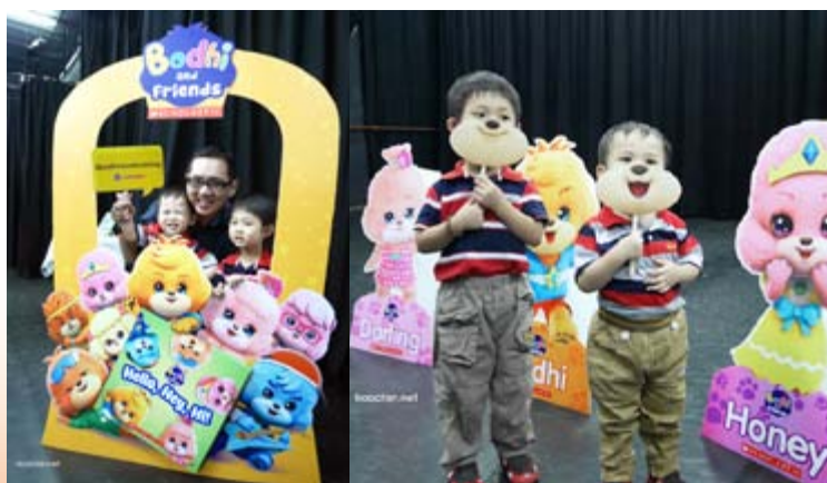
■ 樂學於馬來西亞舉行新書發佈會