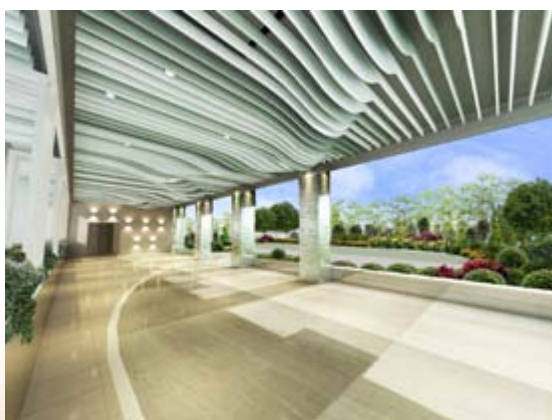
■ iLounge (*)