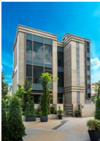
■ 「富豪 • 悦庭」之豪華花園洋房