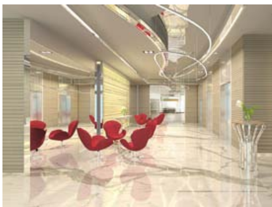
■ 酒店大堂 (*)