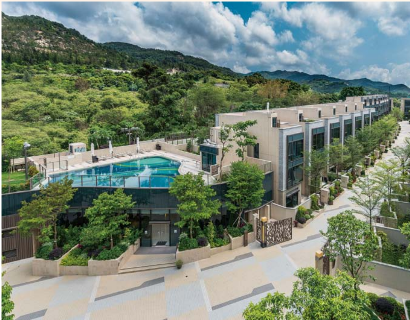
■ 富豪 • 悦庭 — 位於新界元朗丹桂村路 65 至 89 號之住宅發展項目之花園洋房