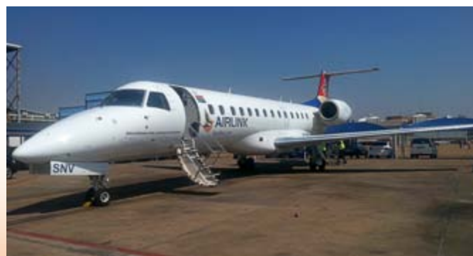
■ ERJ-135 型號 Embraer 飛機