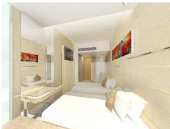
■ 卓薈 (*)