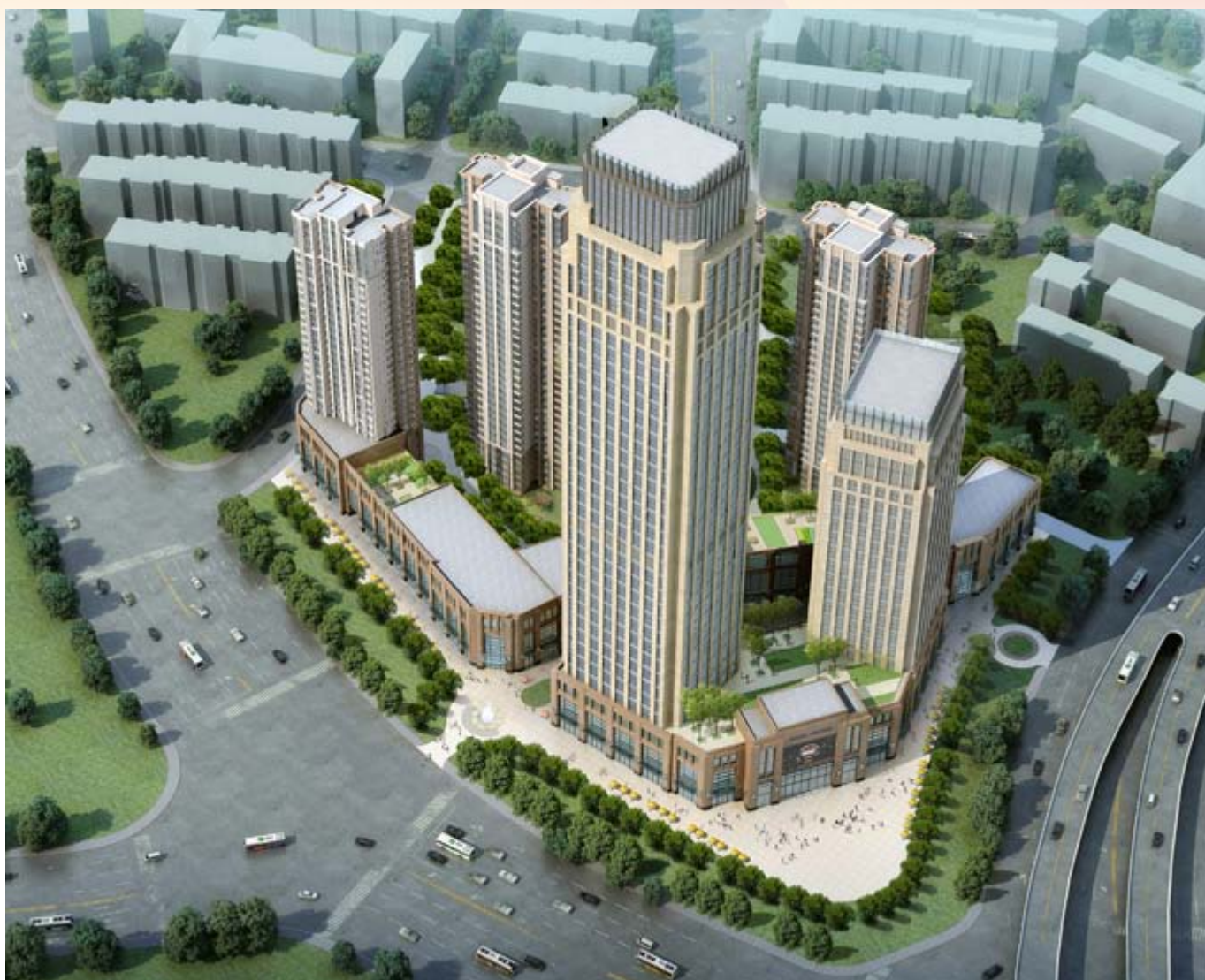
■ 富豪新開門 — 位於天津河東區黃金地段之商業 / 寫字樓 / 住宅綜合發展項目 (*)