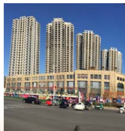
■ 富豪新開門之住宅及商業部分 (*)