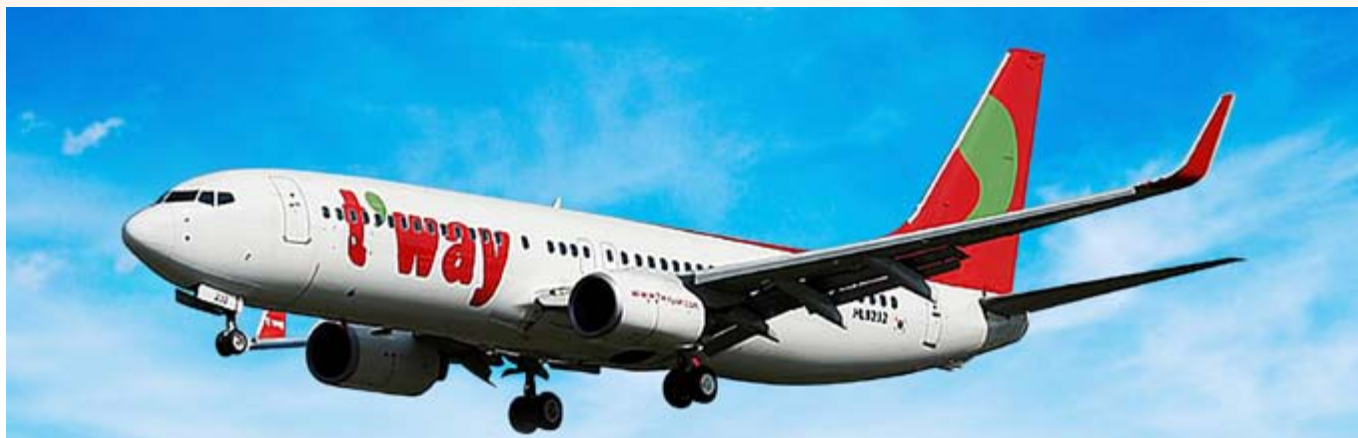
■ 波音 737-800 型號飛機