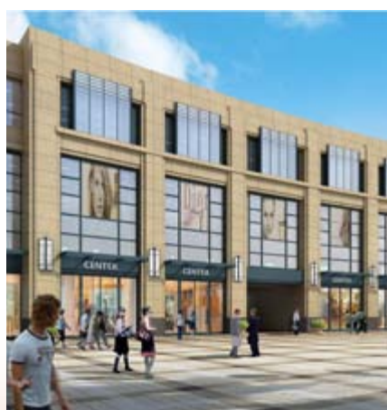
■ 富豪貓步天街 — 富豪新開門之購物步行街 (*)