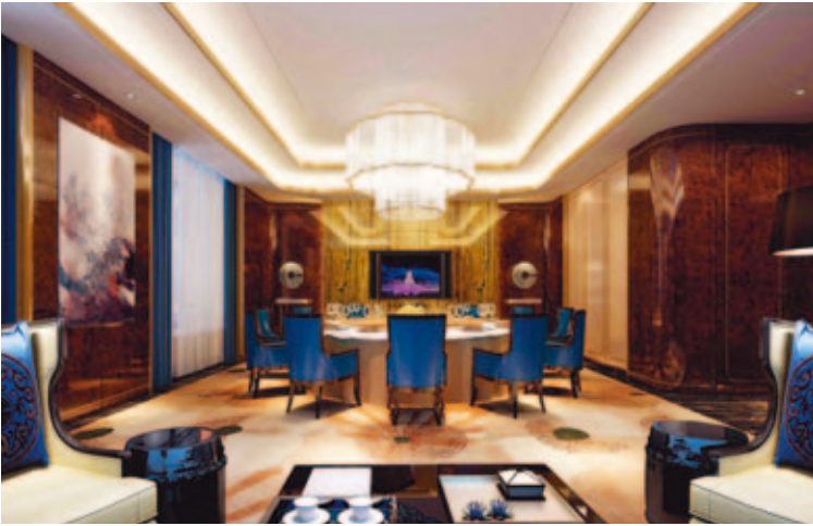
Central Park 珠光新城國際