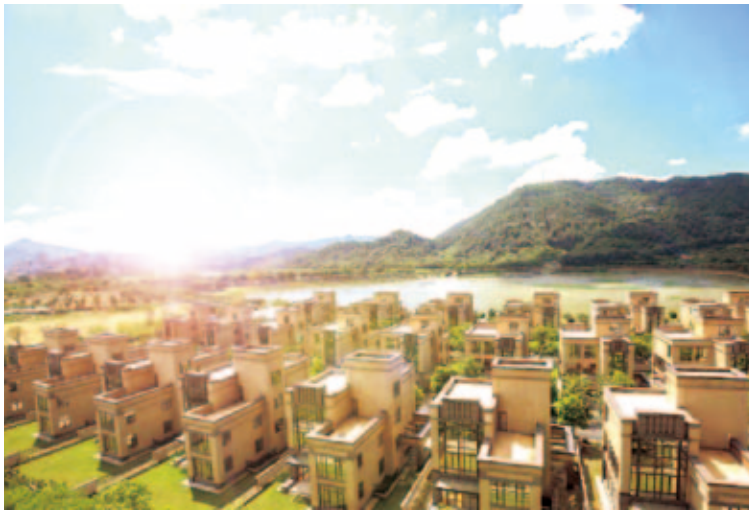
■ Pearl Yunling Lake 珠光•雲嶺湖