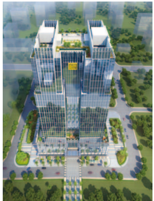
Zhukong International 珠控國際中心

「天湖御景」位於中國廣州市從化溫泉鎮九里步區水底村，佔地面積約55,031平方米。該土地位於御景山水花園旁邊，本集團將該土地與御景山水花園一併開發，從而擴大本集團於從化地區之發展及版圖。該項目已發展成為五幢32層現代住宅大樓及臨街商舖，可供出售的總建築面積約227,973平方米。發展分為兩期進行。第一期可供出售的總建築面積約96,799平方米，其中73,157平方米已於回顧年度內交付。第二期將於二零一七年交付。