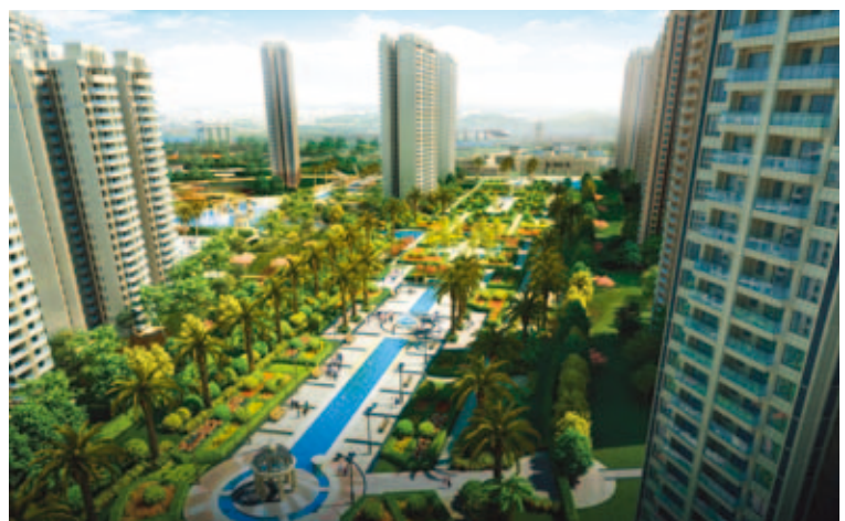
■ Yujing Scenic Garden 御景山水花園

本集團於二零一六年九月成立並發展「新城御景」項目。新城御景位於中國廣東省梅州市豐順縣湯南鎮陽光村種王上圍，毗鄰G235國道線，一個以溫泉資源聞名的縣，為主要旅遊景點。該項目佔地面積約280,836平方米，預期將開發總建築面積約344,162平方米。其將發展成為多種不同類型別墅、高層住宅及配套型商業發展項目。該項目將分為四期開發。第一期包括約54,431平方米之可供出售建築面積，預期將於二零一七年上半年推出預售。