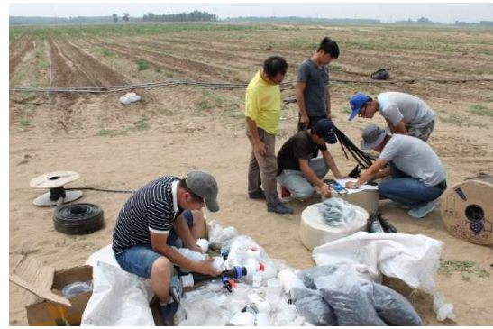
中化化肥捐贈並安裝水肥一體化滴灌設備