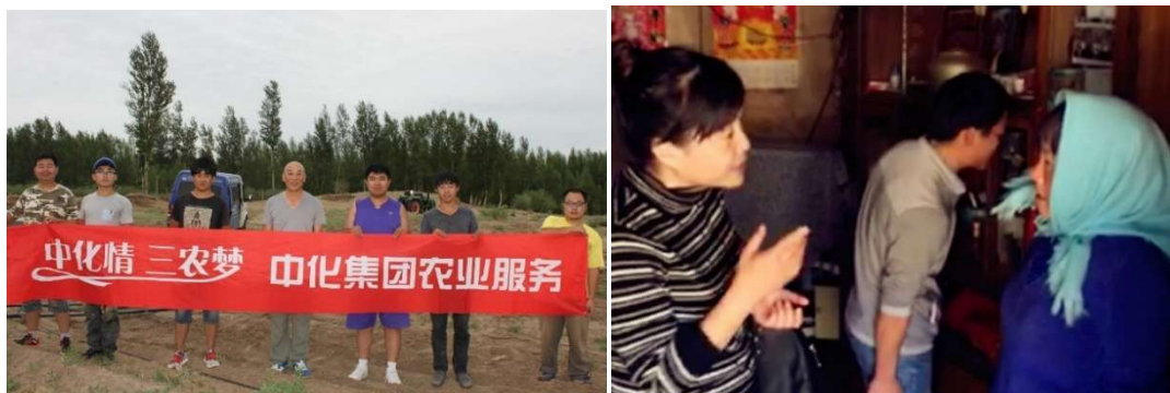
「中化情·三農夢」項目為農民提供上門田間指導及測土配肥服務