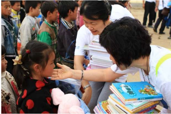
中化化肥捐助予貧困縣的孩子們

的水肥一體化滴灌設備安裝完畢並試水成功，經過 4 天的苦戰，工作人員每天奮戰 13 個小時，滴管設備終於正常運行，水肥一體化滴灌設施安裝在 100 畝的葵花地進行示範，預計增產 10%-15%，節約水資源 30%-45%，輻射帶動周邊農戶可望達到 5,000 畝。