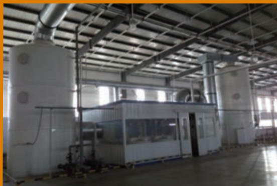
海綿發泡廢氣處理裝置1

為保證工作場所的空氣質量，本集團所有海綿工廠全部建立了全圍敞廢氣收集裝置，採用等離子光解和活性炭吸附處理。（請參閱下圖）