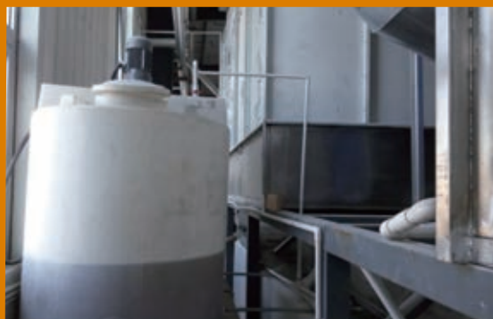
板式傢具廠廢水處理裝置