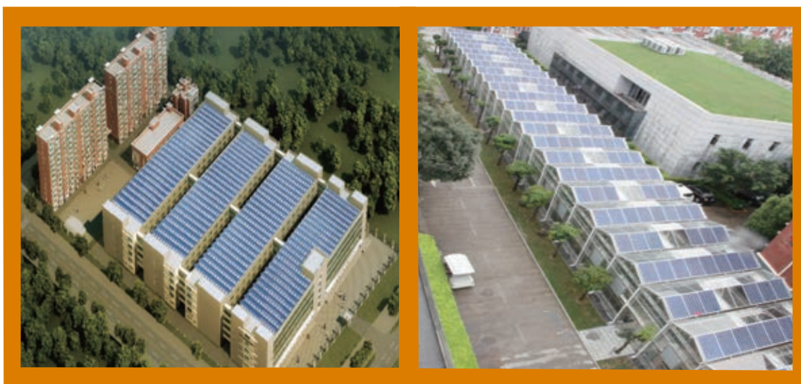
新惠州工廠廠房屋頂太陽能發電系統

繼惠州和吳江工廠後，本集團惠州新生產基地的屋頂太陽能光伏發電系統於二零一六年七月投入運行。於回顧期本集團的三個製造基地共通過光伏系統發電，約17.3百萬千瓦小時(kWh)，佔沙發製造基地總耗電量的約41.0%。