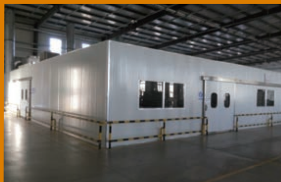
設備密閉式噴塗裝置