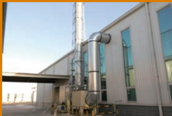
海綿發泡廢氣處理裝置2