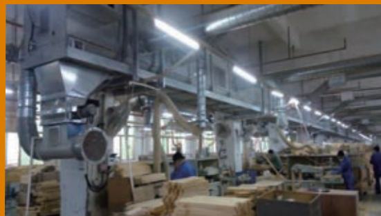
木工車間粉塵收集裝置