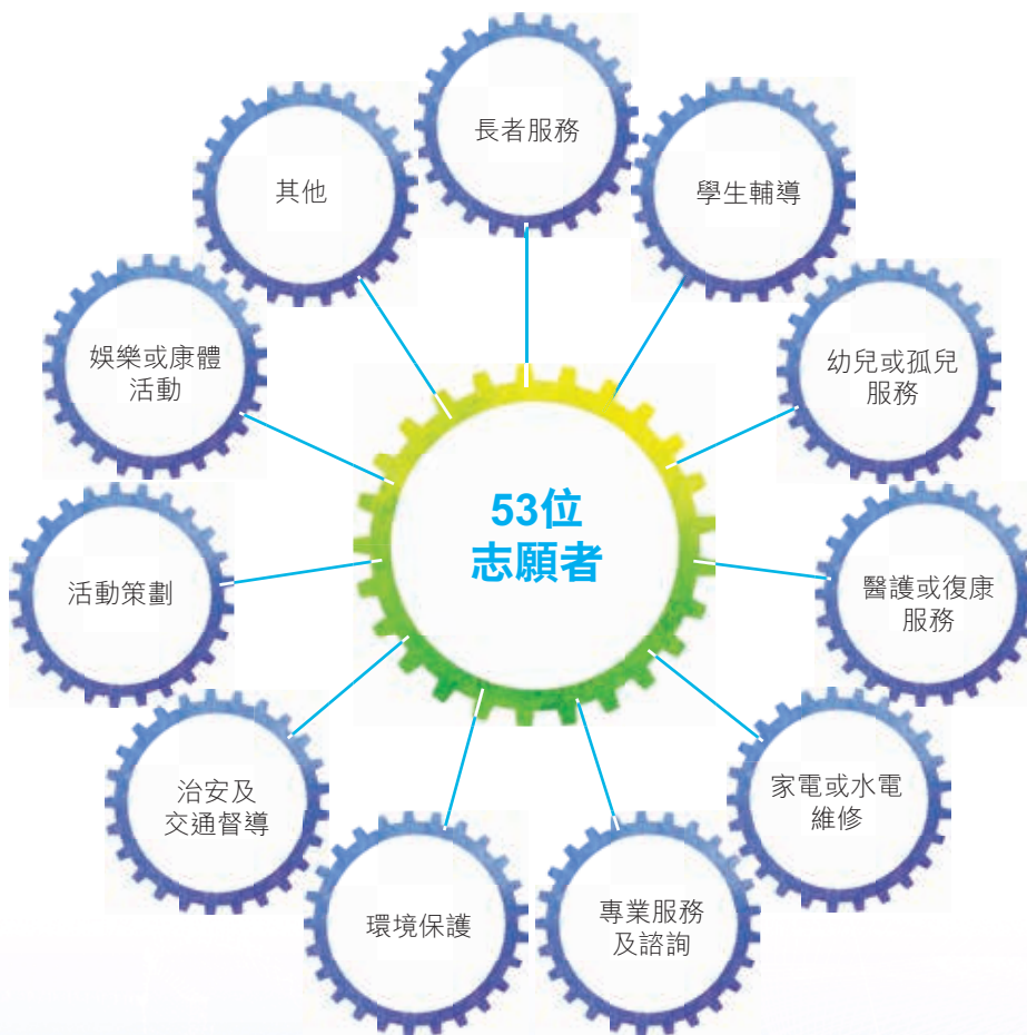
南京協眾志願者註冊登記表摘錄

為了鼓勵員工參與義務工作，協眾南京的工會設立了「志願者註冊登記總匯表」，讓有意參與志願服務的廠房員工登記個人資料，以及服務領域、時間、地區等意向。未來，協眾國際會積極研究如何結合員工的專業技能、個人興趣以及社區需要，與社會團體合辦不同的項目，為社區的可持續發展作出更大貢獻。