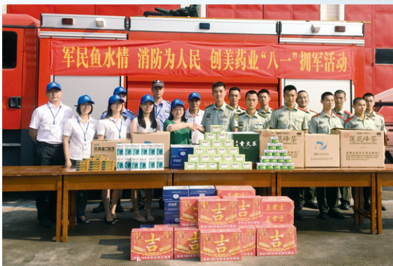
夏日擁軍送舒爽，軍民魚水情更濃