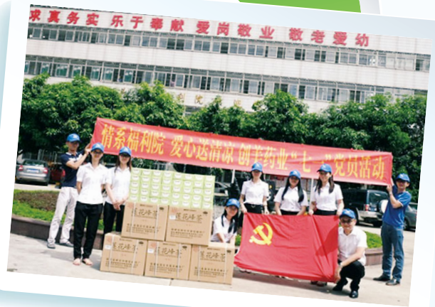
情系福利院，愛心送清涼

2016年7月1日，為慶祝中國共產黨成立95周年，創美藥業黨支部自發組織黨員為汕頭市福利院的老人與兒童們送上蓮花峰茶等清涼解暑物資，並打掃福利院，為他們創造整潔、衛生的生活環境，用實際行動向黨的生日獻禮，實踐「創造健康美好生活」的企業使命。