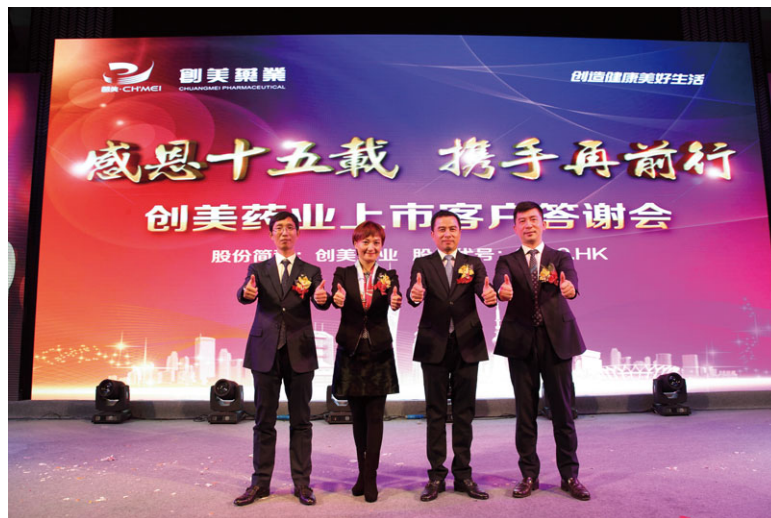
「感恩十五載 • 攜手再前行」上市客戶答謝會

本集團高度尊重客戶私隱，在日常運營中嚴格保護客戶私隱，確保客戶信息安全，嚴禁任何形式的信息洩漏。