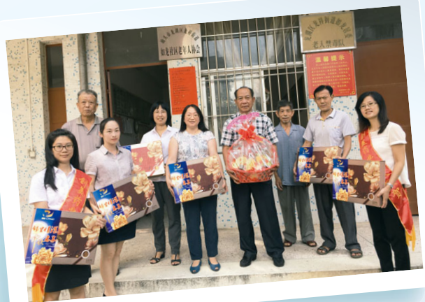
中秋節慰問社區老人

中秋節前夕，創美藥業職工代表為社區老人活動中心的老年朋友們送上潮式月餅、水果以及節日慰問金，向社區的老者長輩致以節日的問候，帶去創美藥業全體員工的拳拳心意。