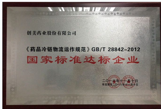
「《藥品冷鏈物流運作規範》國家標準達標企業」

報告期內，本集團獲得中國物流與採購聯合會醫藥物流分會、中國物流與採購聯合會冷鏈物流專業委員會所授予的「《藥品冷鏈物流運作規範》國家標準達標企業」。