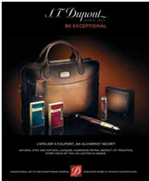
S.T. Dupont 'L'ATELIER' writing instrument, lighters and leathers. 「都彭」的「L'ATELIER」書寫文具、 打火機及皮具。