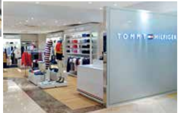
Newly opened Tommy Hilfiger boutique at Pacific SOGO, Zhongxiao Store, Taipei, Taiwan. 位於台灣台北市太平洋SOGO忠孝館新開設 的「Tommy Hilfiger」精品店。