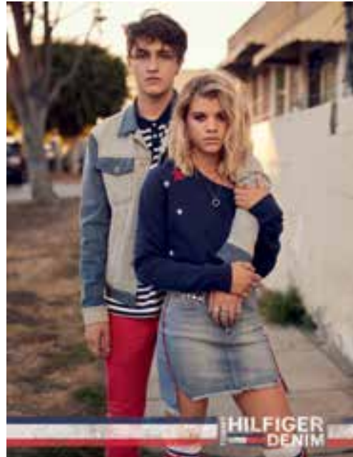
Fashionwear by Tommy Hilfiger Denim. 「Tommy Hilfiger Denim」時裝。

於本年度內，本集團已多元化拓展至證券買賣，連同直接投資，已成為本集團另一核心業務。該部門賺取之淨溢利為港幣七千四百二十萬元。