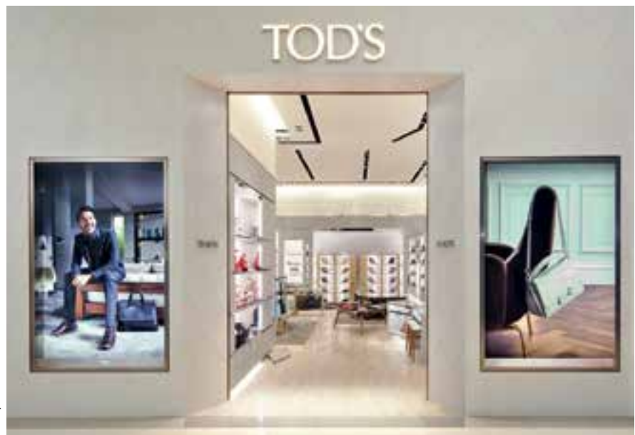
Newly renovated Tod's boutique at Pacific SOGO, Fuxing Store, Taipei, Taiwan. 位於台灣台北市太平洋SOGO復興館 新裝修的「Tod's」精品店。