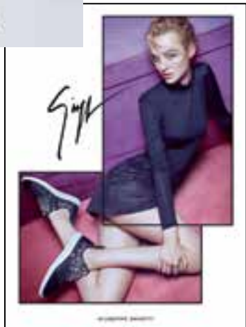
Shoes by Giuseppe Zanotti Design. 「Giuseppe Zanotti Design」鞋履。