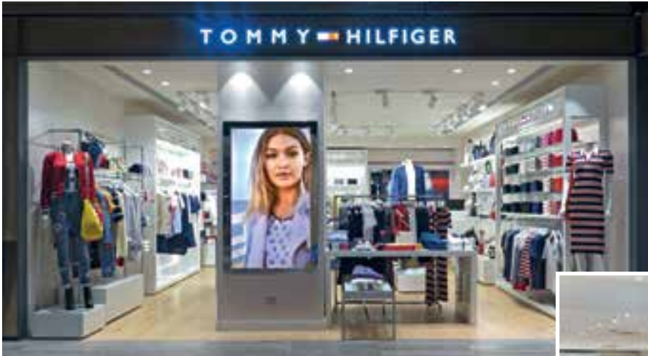
Newly opened Tommy Hilfiger boutique at Shin Kong Mitsukoshi Hsinyi Place A11, Taipei, Taiwan. 位於台灣台北市新光三越百貨台北信義新天地A11新開設 的「Tommy Hilfiger」精品店。