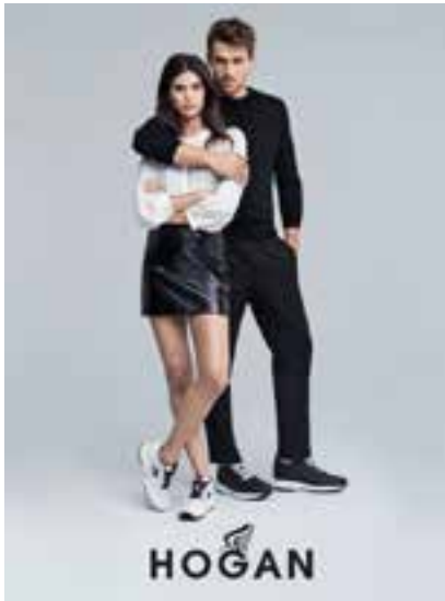
Shoes by Hogan. 「Hogan」鞋履。