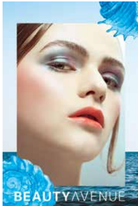
Cosmetics and beauty products at Beauty Avenue. 於「Beauty Avenue」的化妝及美容產品。