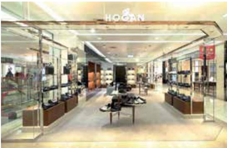
Newly renovated Hogan corner at Pacific SOGO, Fuxing Store, Taipei, Taiwan. 位於台灣台北市太平洋SOGO復興館 新裝修的「Hogan」專櫃。