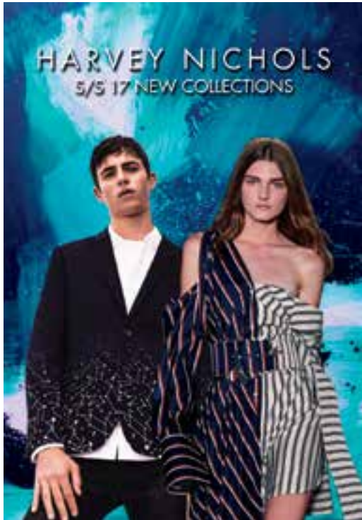
Spring / Summer 2017 fashion at Harvey Nichols. 於「Harvey Nichols」的二零一七年春/夏季時裝。