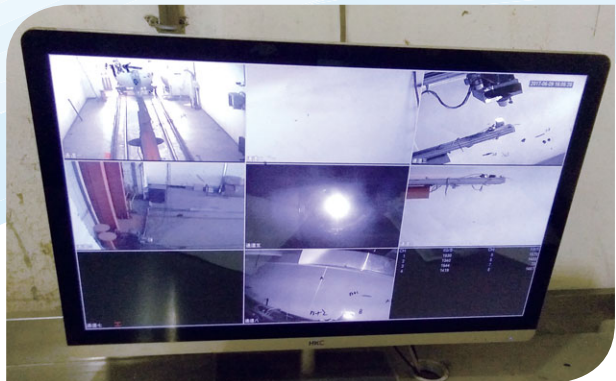
上圖：可為產品內部結構拍照的攝影機