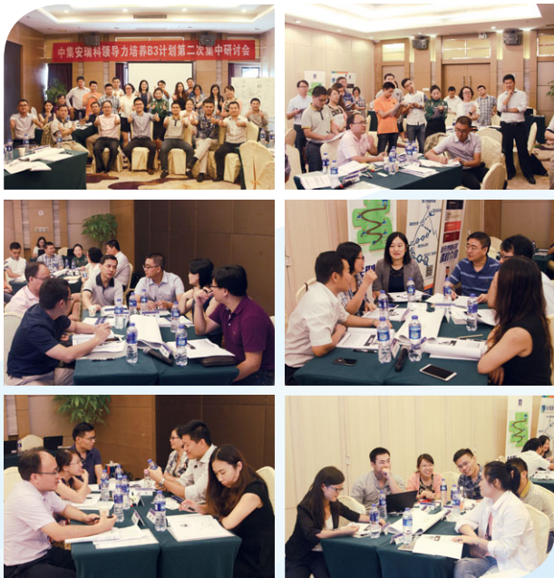
新任管理人員的銜接課程

從知名大學招聘年輕人才對中集安瑞科的成功至關重要。2016年，我們其中一家附屬公司共聘請32名優秀畢業生。根據人力資源部指引，為使畢業生融入企業文化，彼等獲提供的培訓包括公司介紹、核心技能、銷售技巧及商務禮儀。