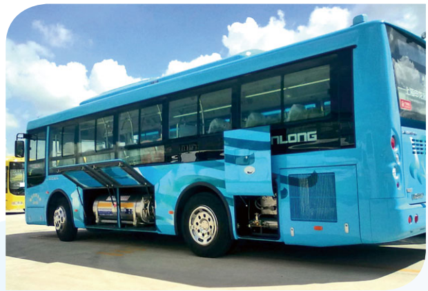
珠海公交的維修服務

珠海公交巴士有限公司（「珠海公交」）為中集聖達因的主要客戶。於2016年8月，珠海公交要求進行維修檢查。由於在旺季產能供不應求，預期會導致維修檢查有所延誤，並可能會導致巴士服務短暫中斷。我們的代表在接獲有關投訴後，進行了實地視察，並提出解決方案：與珠海公交人員開設微信群組，可不時通報維修狀況。結果維修工作較原本預期快一倍完成，而我們亦成功解決客戶的疑難。