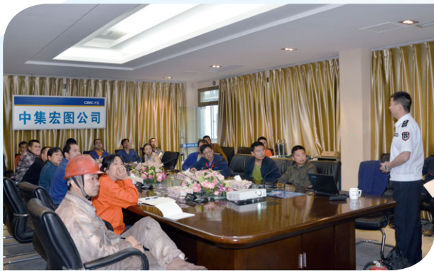
消防局舉辦之工作坊

此外，各業務部門均須遵守本集團的安全生產事故應急預案管理制度，重點應對化學品溢漏、水災、火災、爆炸、颱風等情況，並組織特定演練。2016年間，本公司共舉辦80多次應急演練。