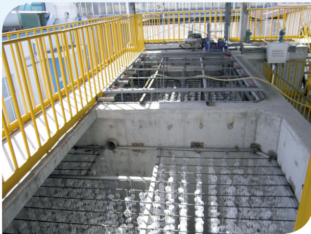
油漆廢水處理設施

就所有有害及無害廢物而言，我們遵守《中華人民共和國固體廢物污染環境防治法》及《江蘇省危險廢物管理暫行辦法》。就此，我們聘用合資格第三方收集所有有害廢物，並向環保局申報。無害廢物則交由環衛處作進一步處理。