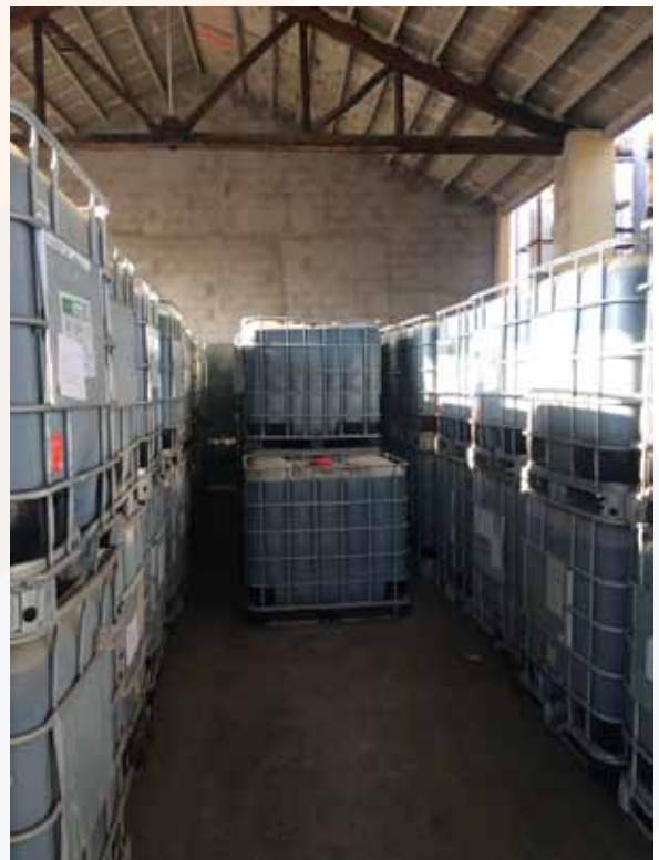
廢鉻液集中收集處理

另一類是含鉻廢液集中收集處理，從廢水裡把重金屬鉻提煉出來，現在完全可以達到90%以上回用，把鉻沉澱下來用脫水機脫水後，再加硫酸再生成鉻鹽迴圈利用。含硫在前期處理有兩個方法，一是催化氧化，把硫離子生成硫酸鹽，再加一點鐵鹽生成硫化鐵，就幾乎進入綜合廢水的要求。二是鉻泥加酸生成硫酸鉻，回到生產程序當中，這是中國皮革和製革工業研究院比較先進的技術，處理得比較徹底，迴圈利用處理。