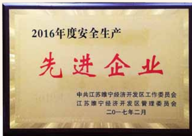
「2016年度安全生產先進企業」牌匾