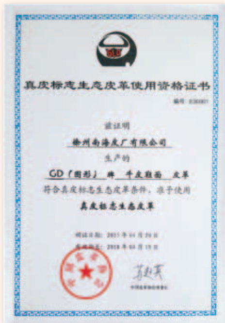
真皮標誌生態皮革 使用資格證書