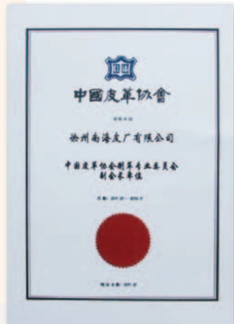
中國皮革協會制革專業 委員會副會長單位