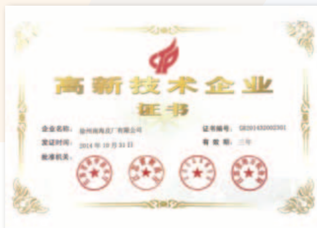
高新技術企業證書