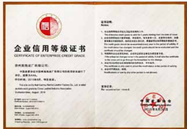
企業信用等級證書