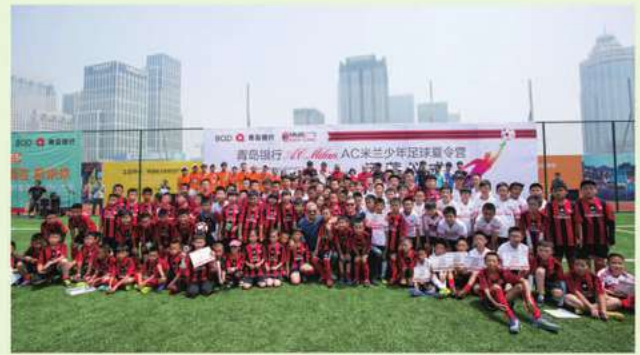
2016年青島銀行AC米蘭少年足球夏令營閉營儀式後合影