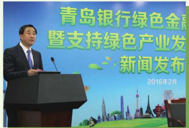
青島銀行綠色金融債券發行暨支持綠色產業發展銀企簽約新聞發佈會

本行一直致力於將綠色信貸的理念融入行業政策，完善綠色信貸系統，嚴控「兩高一剩」行業信貸，致力於實現經濟、社會和環境三位一體的可持續發展。2016年3月和11月，在中國人民銀行的大力支持下，本行作為首批試點商業銀行之一，分別發行2016年第一期和第二期綠色金融債券，共募集資金80億元。本行綠色金融債券募集資金由專戶管理，募集資金的使用設置專項台賬，截至2016年12月末，我行利用募集資金已支持綠色信貸項目金額合計44.65億元，綠色信貸項目貸款餘額62.62億元，比同期增長36.58億元，增幅達140.48%，「兩高一剩」貸款餘額27.23億元，同比減少6.86億元，降幅20.12%。