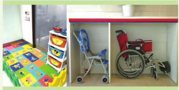
營業廳兒童區、嬰兒椅、輪椅

本行針對特殊客戶建立了極具人性化的服務體系，包括：營業廳兒童區、嬰兒椅、輪椅、愛心座椅、助盲卡、戶外增設特殊客戶求助電話、衛生間增設客用扶手、愛心記錄本，從而體現對特殊客群關愛之情。