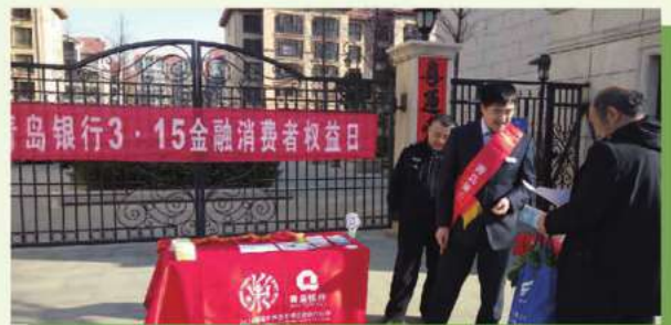
315金融消費者權益日社區宣傳活動