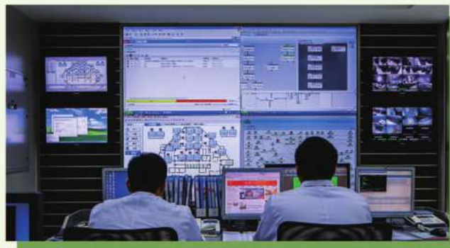
新客戶服務系統上線現場

本行持續推進高效、靈活、輕量級的雲數據中心建設，通過雲技術帶來的可擴展架構、集中式運維以及資源的高度整合，全面提升數據中心的運營效率，實現資源集約化。2016年，本行新客戶服務系統上線，通過統一數據標準、統一用戶管理、機構管理，實現業務集中運營，簡化前台操作，提高員工工作效率，提升客戶體驗。