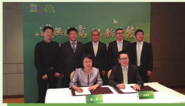
青島銀行與上海百雀羚集團簽署供應鏈金融業務合作協議

本行與海爾集團旗下一家公司（以下簡稱「核心企業」）簽署協議，為其上下游客戶提供在線融資服務「E秒貸」。通過E秒貸業務，核心企業向本行推薦其產業鏈條上下游的優秀客戶，本行依據其上下游客戶以往與核心企業的合作記錄情況，向上下游客戶提供在線融資服務，包括便捷融資和支付服務等。本行在該在線融資模式的基礎上，又接入了歐普照明，系統已於2016年5月份上線運營，為歐普下游經銷商提供在線融資。2016年本行陸續與百雀羚集團、匯源果汁、魯花集團、益海嘉里糧油、蒙牛乳業集團、金羅肉食、九聯肉食等國內知名快消品核心企業建立合作關係。截至2016年末，累計為快消品核心企業經銷商發放貸款408戶、金額3.68億元。