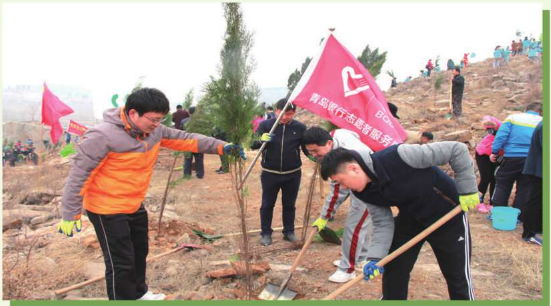
2016年3月12日，棗莊分行開展「青春綠色行動·扮靚棗莊城鄉」植樹活動