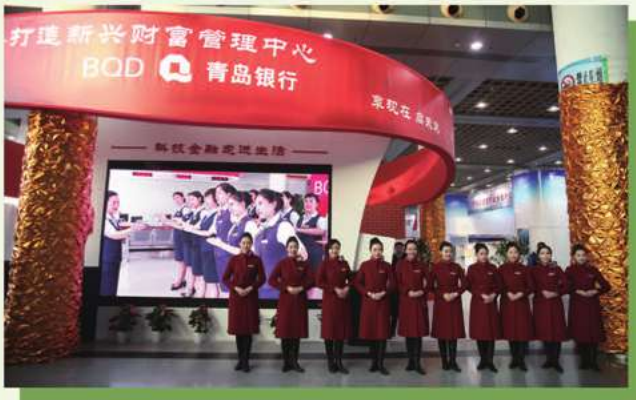
2016年12月，青島銀行參加首屆山東省金融博覽會

本行圍繞政府及公用事業單位等與民生密切相關的行業和項目，通過多元化的服務，積極拓展民生領域行業的合作範圍。在熱電、水務、燃氣、公交、醫療、養老、教育等民生行業領域，不斷實現突破，全年共審批城市發展基金項目20個，總金額200多億元，實際投放8筆，合計91億元；全年融資保理業務投放15筆，金額20.13億元。