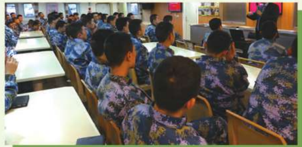
送金融知識進軍營活動

為進一步加大反假幣宣傳力度，增強防範假幣意識和識別假幣能力，本行各分支行採取進社區、進校園、路演等多種方式，向廣大市民認真細緻地講解了假幣的危害和反假幣的作用，以及人民幣大眾防偽特徵，用真假貨幣實物進行對比，採取眼觀、手摸等方法指導群眾迅速準確地識別假幣。