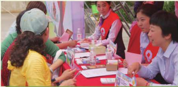
金融知識戶外宣傳活動