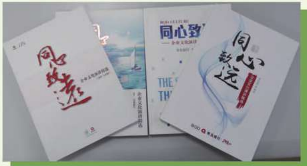
近四年晨會演講叢書

從2010年起，本行實行週一全行晨會演講活動。每週一的晨會，貫穿合規與服務、奉獻與成長，總行和分支行輪流進行主題演講和點評，全行通過視頻系統觀看，不僅是對作風的激濁揚清，更是價值觀的重塑再造，通過一個個鮮活的案例給予全行警示和啟發，使以內控文化、服務文化、風險文化和關愛文化等為核心的價值理念「入腦，入心，入行」。同時，晨會中開展知識問答，通過一問一答，使員工熟悉銀行業務和合規知識，營造出時時、事事、處處、人人講合規的積極向上的文化氛圍。2016年，先後開展了「服務專員話服務」、「我為行慶做貢獻」、「同心築夢篤行致遠——我與青銀共成長」等主題演講。