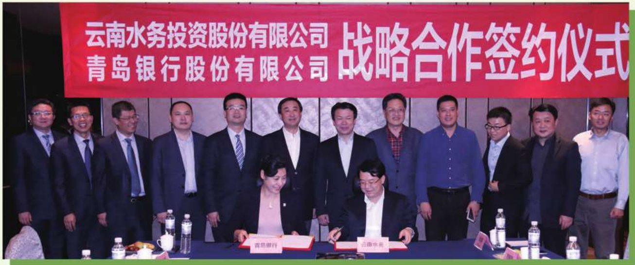
青島銀行與雲南水務投資股份有限公司簽署全面戰略合作協議推動綠色金融發展