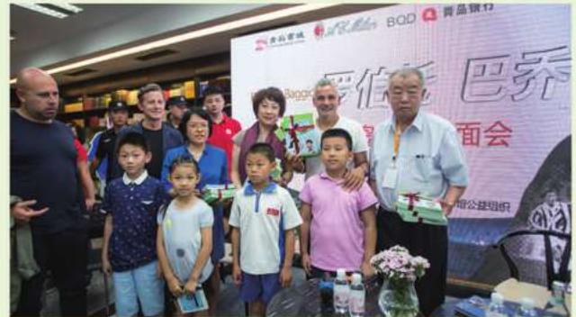
巴喬來到書城參加客戶青島見面會