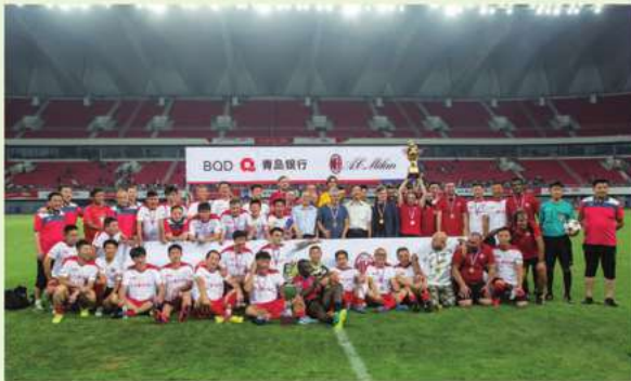
2016年青島銀行杯明星邀請賽賽後合影