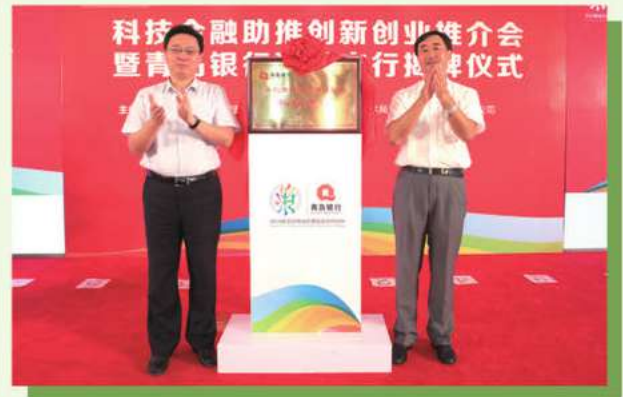
金融助推創新創業推介會暨青島銀行科技支行揭牌儀式

以「專業、專注、專營」的思路和創新模式設立科技支行，開展科技金融業務，2016年，科技支行共為科技型企業發放授信資金10.47億元，年末餘額6.85億元，較上一年度增長40.1%，有餘額授信客戶數量125戶。支行創新開展專利權質押貸款業務一年多，已發放授信35戶，授信金額1.26億元，實現放款1.18億元。下一步將逐步籌建位於藍色矽谷核心區的即墨科技支行。