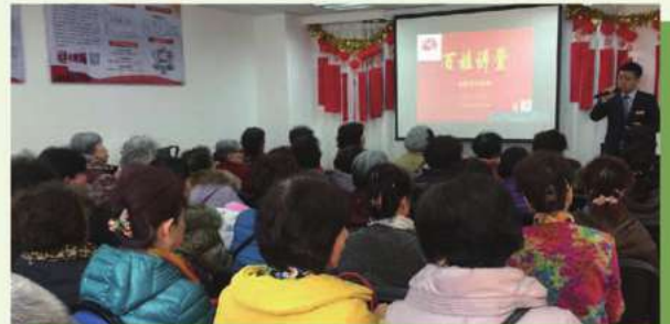
送金融知識進老年大學——百姓講堂