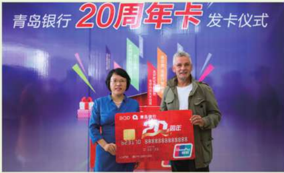
巴喬參加我行20週年紀念銀行卡發卡儀式

2016年5月21日上午，我行成立20週年暨第五屆「海融財富」理財節開幕，圍繞「感恩同行，綻放精彩」這一主題，理財節除向客戶提供全方位金融服務外，還推出多項增值回饋活動，如發行青島銀行20週年紀念卡，邀請前意大利國家隊主力球員羅伯特·巴喬、弗朗哥·巴雷西參加「AC米蘭少年足球訓練營」，組織了由巴喬、巴雷西領銜的國際明星隊與王東寧、戴仁慶等領銜的山東明星足球隊參加的青島銀行杯中外明星邀請賽等。