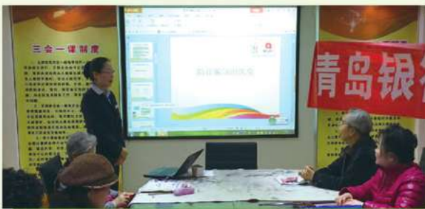
送金融知識進老年大學——防詐騙知識課堂