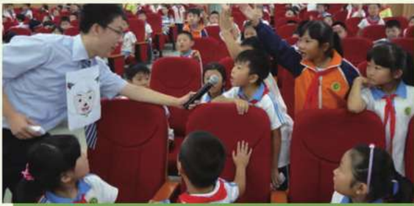
送金融知識進小學活動

本行持續深化社會公眾對金融知識和金融風險的理解，切實加強對消費者個人金融信息保護、防範電信詐騙領域的宣傳教育和引導，尤其是加強對農村金融消費群體、特殊群體的金融知識宣傳普及工作，將普及金融知識工作常態化、規範化。2016年，先後組織開展了「3.15消費者保護宣傳活動」、「金融知識萬里行活動」、「金融知識進萬家」活動等，向社會公眾介紹銀行業基本常識。