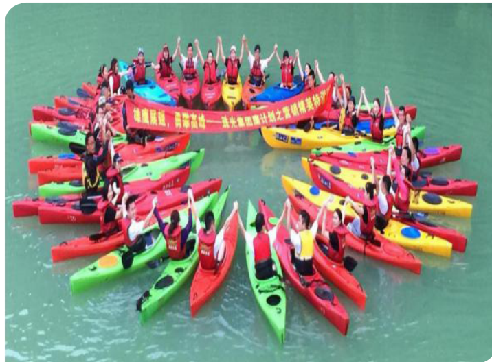
■ 營銷精英特訓營拓展活動

本集團亦鼓勵優秀僱員參加外部培訓，通過不斷學習提高競爭力及提升能力。本集團可安排外部培訓機構及培訓人員為其僱員提供工作相關培訓。