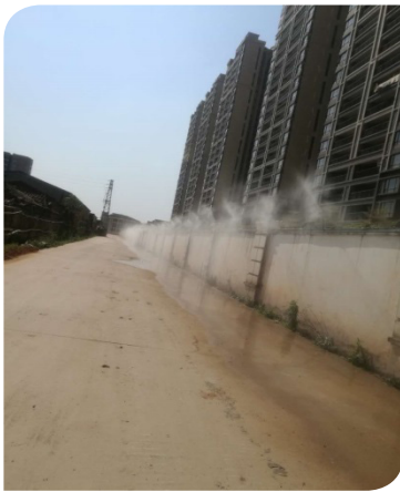
■ 加壓噴霧除塵裝置