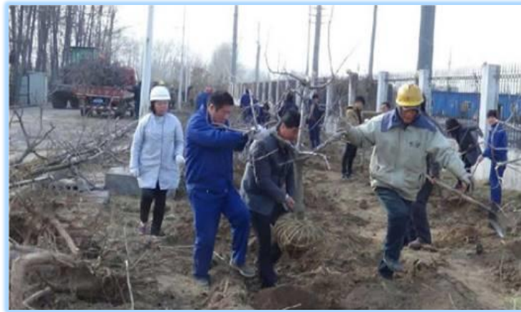
植樹造林，修復礦山自然環境

石灰石的開採會進行山體的爆破及鑽挖，因而改變地勢及破壞自然環境。本集團意識到該影響，因此鼓勵各子公司自主開展植樹活動，並於年度內多次進行植樹及綠化活動修復自然環境。本集團共舉辦了9次廠區植樹活動，並於廠內荒地種植草籽及水果樹。例如，天瑞集團禹州水泥有限公司通過廠區的植樹活動，期望提高全體員工的綠化及環保意識，並有效利用廠區荒地，共種植了200多棵蘋果樹及100多棵辛夷樹。