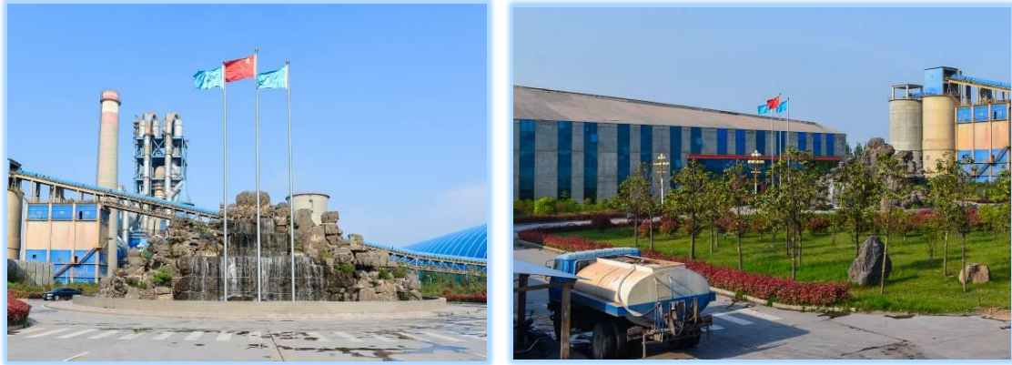
廠區景觀（左圖）和降塵噴灑作業（右圖）使用餘熱發電系統的循環水

部分冷卻系統更使用處理過的廠區工業水作冷卻水，避免額外抽取其他水資源。系統的水泵具過濾功能，保證用水安全無害，能協助生產。另一方面，本集團亦積極利用經處理後的循環水作綠化灌溉、廠區景觀和降塵噴灑的用水。