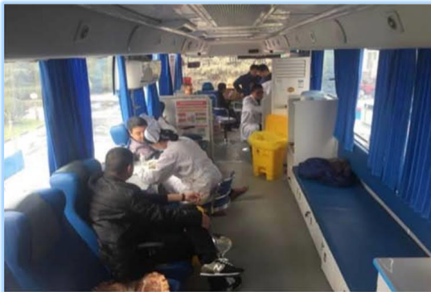
天瑞集團周口水泥有限公司的員工積極參與無償的獻血活動

血液庫存保障社區的醫療服務素質，使接受手術的人士有足夠的血液供給，即時接受適當的治療。由於血液沒有替代品，而且受儲存期所限，醫療機構在確保充足的庫存上面對一定的困難。因此，天瑞集團周口水泥有限公司的員工積極參與無償的獻血活動，希望舒緩血庫緊張的情況。活動當天，有眾多員工參與，表現出他們的支持及無私奉獻的精神。