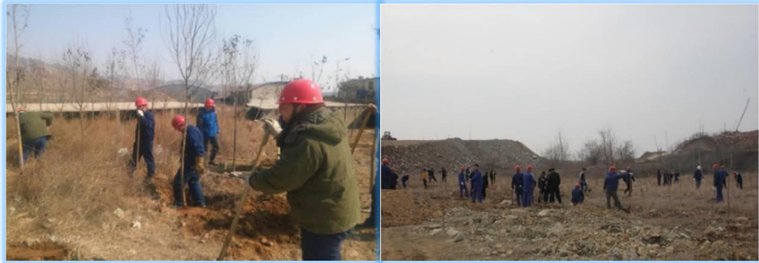
礦山的植樹活動，修復礦山的自然環境。