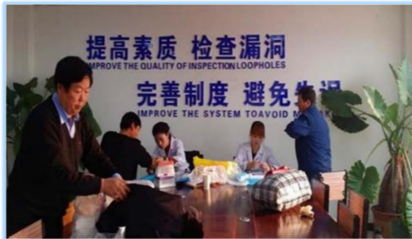
天津天瑞水泥有限公司的體檢活動

本集團亦關心員工的健康與安全，每年舉辦一至兩次職業健康體檢。例如，天津天瑞水泥有限公司邀請社區的醫務人員到廠進行年度的職業健康體檢。其檢測主要有耳科檢查、心電圖、血常規、肺功能、DR 胸片等。醫務人員亦為員工講解健康知識，提升他們對職業安全及健康的意識。