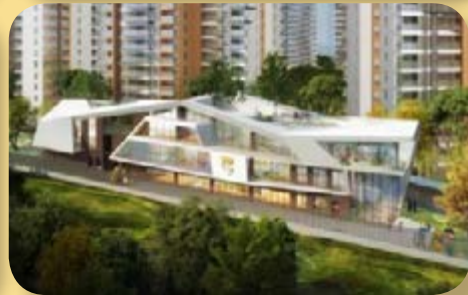
成都項目構思圖－富豪國際新都薈