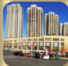
天津項目構思圖－富豪新開門