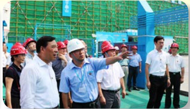
由政府人員進行檢查