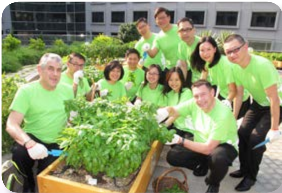
有機農場義工活動

我們對節約能源並減少碳排放的承諾，可於我們參與環保活動及獲頒授綠色獎項中可見一斑。為支持應對氣候變化及環境保護運動，我們旗下酒店已參與「世界自然基金會地球一小時」活動。若干酒店獲全國旅遊星級飯店評定委員會頒授銀葉或金葉級綠色旅遊飯店，以表揚我們對環保所作努力。