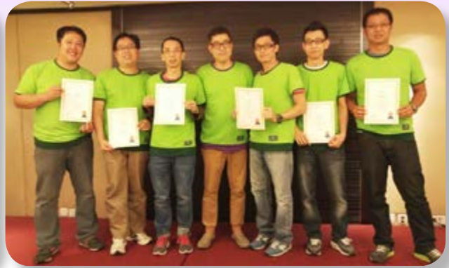
酒店員工安全訓練

持續建立安全意識對營造健康及安全的工作環境攸關重要。就此，我們已向員工張貼海報並派發安全資訊單張、通訊簡報及告示，並於酒店辦公室、工作間及員工福利設施當眼位置貼出相關警告標誌、應變及救援程序、通告及告示以提醒員工。我們亦根據安全獎勵計劃定期頒發安全獎，以確認個別人員的良好健康及安全相關表現。