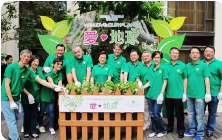
我們旗下酒店業務的高級管理人員推出「愛地球」計劃。

另一方面，我們致力在工作場所內外推行環保計劃。例如，我們自二零一二年起一直推行「愛地球」，藉以推進我們的可持續發展工作。作為我們以更環保方式營運的共同承諾的一部分，我們的酒店下設的各部門，包括工程部、財務部、人力資源部、市場推廣部、營運部、項目發展部、採購部及營業部已採取各種措施。