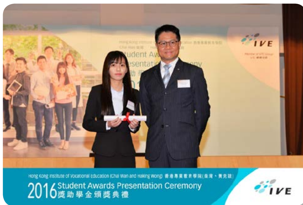
富豪青年發展計劃學生獎學金

富豪致力為酒店業培育人才。就此，我們為年輕人提供機會深入了解酒店行業。自二零一五年起，我們推出「富豪國際酒店集團青年發展計劃」，為17名來自香港專業教育學院酒店、服務及旅遊學課程的學生提供獎學金，以及在我們旗下酒店不同營運部門，例如前台、餐飲及房務部獲得300小時的實習機會，讓他們可透過該計劃獲得更多實際工作經驗。例如，前台實習生會直接為客人服務，透過處理不同的日常業務及即場解決問題，提高他們解決問題的能力。