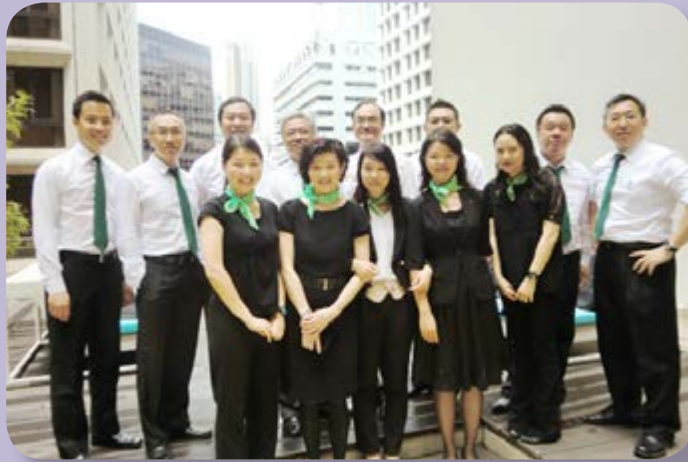
員工在「著綠日 (Wear Green Day)」穿著以綠色飾物點綴的商務套裝。

加強同事及其家人對環境保護的意識，共同營造生態友好的工作環境及養成愛地球的習慣。