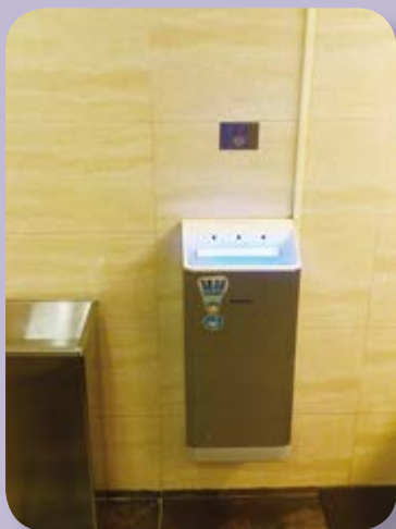
在洗手間安裝乾手機