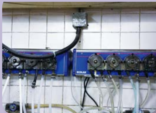
化學清潔劑分配器