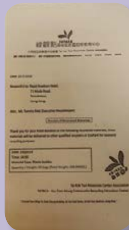
綠觀點頒發的減廢證書