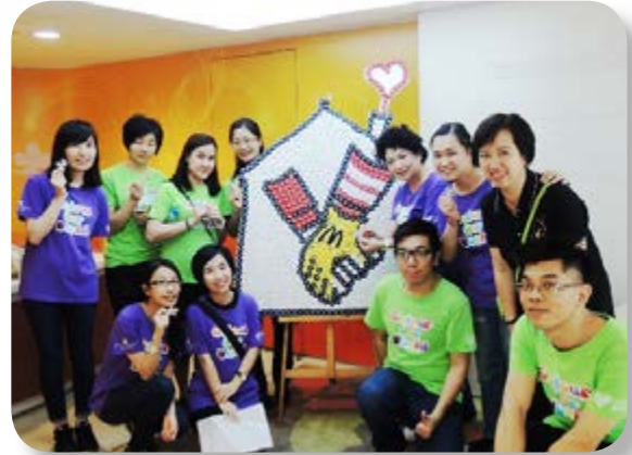
義工探訪麥當勞叔叔之家。