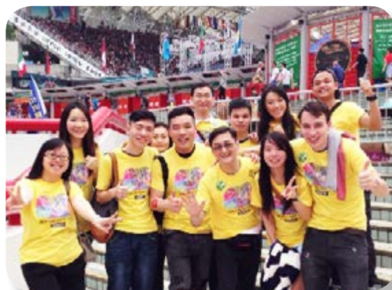
員工大力支持「Save Our Sevens」活動。