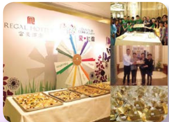
於二零一六年，與扶康會一同舉辦的慈善曲奇義賣圓滿成功。