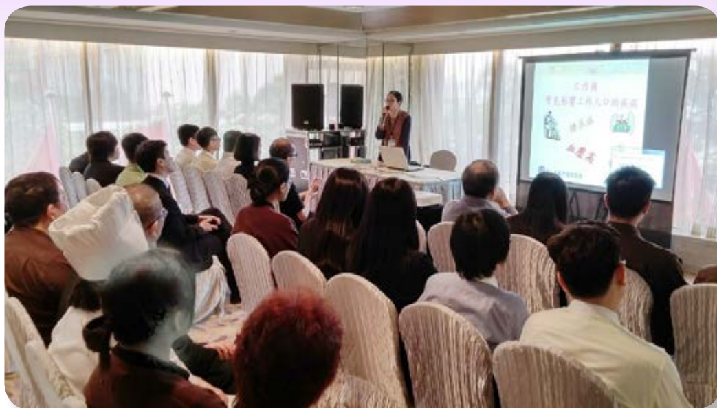
新入職員工迎新培訓課程