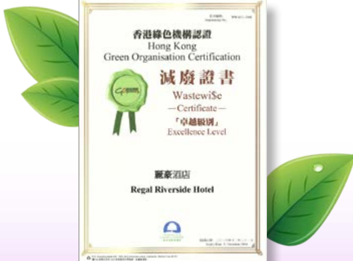
卓越明智減廢標誌